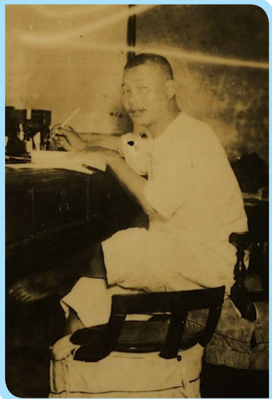
▲ 民族詩人賴和醫生，素有「臺灣現代文學之父」的美譽。

國內 杏林藝術家不少，在文壇享有盛名的，早年以出身彰化的賴和（1894-1943）為最，是臺灣日治時期的重要作家，在文學領域相當活躍，尤其詩作，公認是最具代表性的民族詩人之一，更是1930年代的文壇領袖，而有「臺灣現代文學之父」美譽。