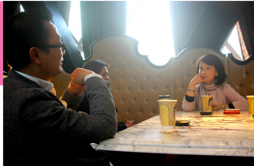
▲ 葉局長與尤董事長暢談企業對於耕耘文化的作為與施力。

原眼科，因為保留及活化臺中古蹟是我的職責與使命，我心中一直盤算如何將演武場、典獄長宿舍、臺中州廳和市役所等串連起一座大都會中懷舊的Old town。我也期望外賓來到臺中時，能夠有個能品味臺中文化歷史的地方。