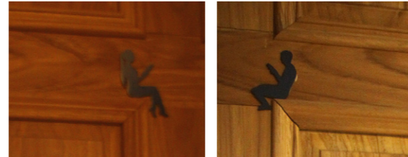
▲ 宮原眼科每個角落都有意義和典故，就連洗手間的圖示都「不忘閱讀」，在反映了「日出」重視文化的企業精神。