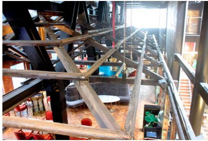
▲ 運用新舊的對比與連結賦予這棟建築物新的生命。