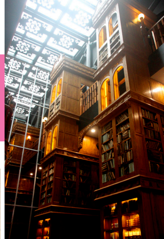
▲ 宮原眼科裡，直達天花板的大書櫃。