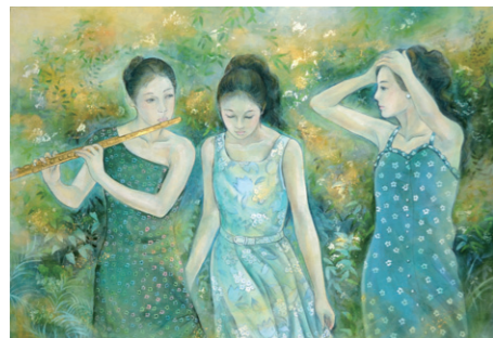
▲ 陳淑嬌/旋/膠彩畫/30F/2012年

這次展出的作品以人物畫為主，人物畫自古即被稱為繪畫的基本，具有相當的魅力和挑戰性，再以現代來弘揚傳統，也是人物畫發展趨勢。當然膠彩畫最重要的還是要保有些許傳統的線條及墨趣，更要重視作品內涵與技法，而詮釋出時代性、民族性、個人獨特性，足令觀賞者玩味不已，才是創作發表的最大方向。