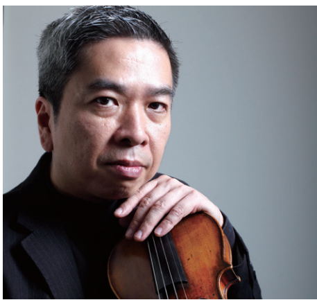
▲ Taiwan Connection音樂節由知名小提琴家胡乃元發起。

2012年TC音樂節將演出布拉姆斯及舒伯特五重奏。成員除了來自國內各地音樂好手之外，各聲部首席更是邀請前國立臺灣交響樂團小提琴首席薛志璋、韓國漢城首爾愛樂中提琴黃鴻偉、旅居加拿大Borealis弦樂四重奏大提琴家陳世霖等傑出華裔音樂家共同參與演出。音樂家傾聽與對話的演奏特性，將讓音樂產生渾然天成的力量，引領聽眾感受室內樂動人的魅力。