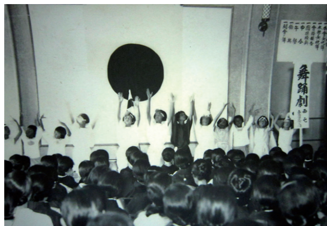
▲ 西屯公學校學生表演。

戰後初期，物質缺乏，相機及沖相皆屬奢侈品，當時一張相片的沖洗費用約一般工人的四分之一月薪，加上臺灣潮濕多災，紙質文物保存更為不易，因此每張老相片都是歷經歲月滄桑，幸運被保存下來，顯得彌足珍貴。而為了展現當時影像紀錄的環境，現場還展出多款老舊相機、早期玻璃底片和相片暗房沖洗模擬實境，介紹傳統黑白老相片的製作過程，希望引領民眾神遊過去的時空，體驗老相片背後動人的精采故事。