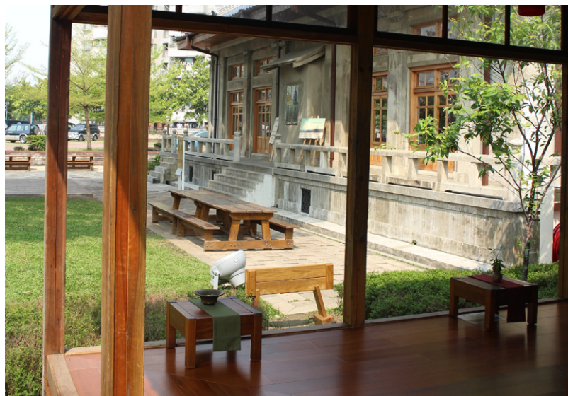
■ 從茶屋看出去的演武場。

喜歡親近、外地朋友時常造訪的地點。她希望這裡能真正重新回到居民的生活中，如同當年獄卒警員們在此切磋武藝、交流所學一般。