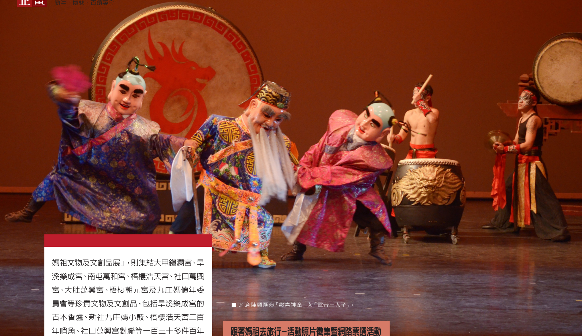
■ 創意陣頭匯演「歡喜神童」與「電音三太子」。

媽祖文物及文創品展」，則集結大甲鎮瀾宮、旱溪樂成宮、南屯萬和宮、梧棲浩天宮、社口萬興宮、大肚萬興宮、梧棲朝元宮及九庄媽值年委員會等珍貴文物及文創品，包括旱溪樂成宮的古木香爐、新社九庄媽小鼓、梧棲浩天宮二百年哨角、社口萬興宮對聯等一百三十多件百年宮廟文物，以及五十多種文創品，難得一見。