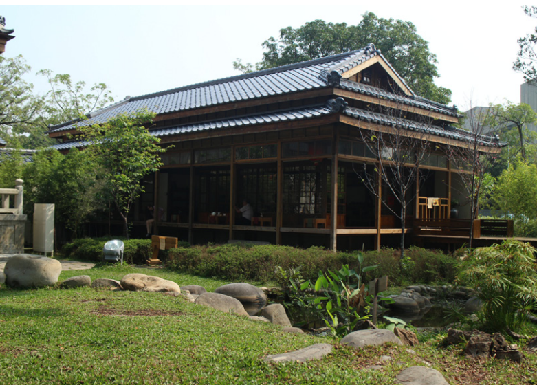
■ 演武場旁的宿舍，被改建成休憩的茶屋。