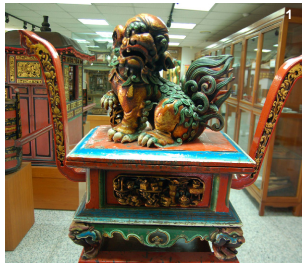
1. 南屯萬和宮〈木製麒麟座香爐〉。2. 梧棲朝元宮〈石香爐〉。3. 九庄媽值年委員會提供的〈古神轎〉。

讓我們尾隨媽祖的腳步，在千里眼與順風耳的庇佑中，在白海豚陣頭的簇擁下，一步一腳印，行經一座座巍峨廟宇，一路上熱鬧隨行 今年春天跟著媽祖去旅行吧！END