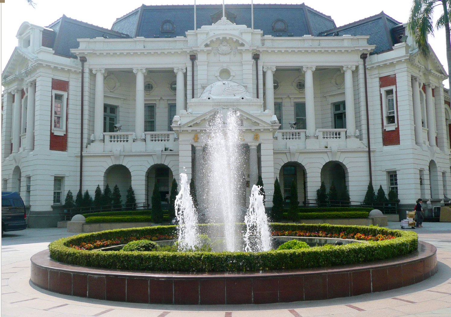
■ 臺中州廳仿古典建築風格，有「小白宮」之稱。