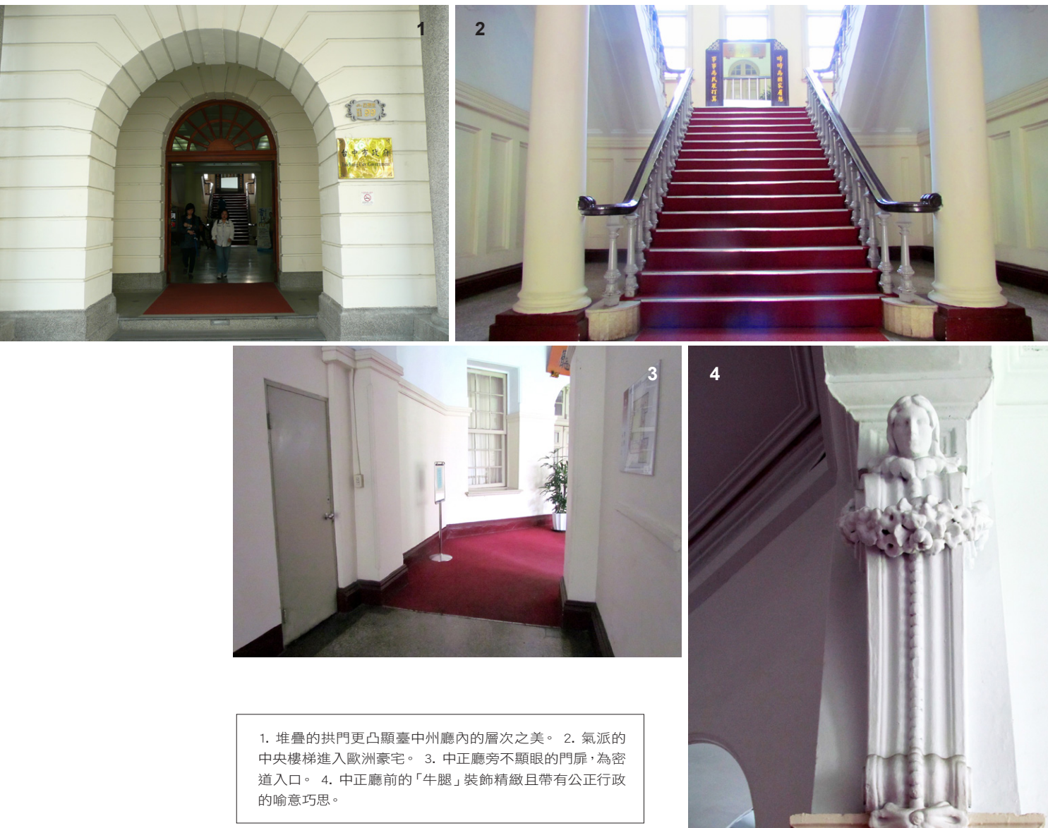
1. 堆疊的拱門更凸顯臺中州廳內的層次之美。 2. 氣派的中央樓梯進入歐洲豪宅。 3. 中正廳旁不顯眼的門扉，為密道入口。 4. 中正廳前的「牛腿」裝飾精緻且帶有公正行政的喻意巧思。

官署、城池。臺灣割讓之後，日軍將原本位於彰化的中部地區指揮部「臺灣民政支部」，移至清代臺灣府城北小北門之內的西北隅官署建築群，此被日人稱為試院或考棚（位於今日民權路以南、市府路與三民路之間）的這片區域，就此成為日本政府臺灣中部行政中樞的所在。