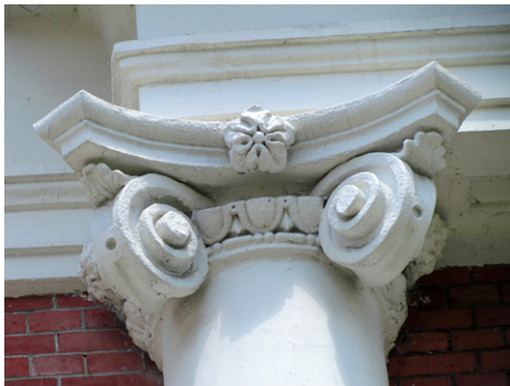
■ 臺中州廳立柱柱頭裝飾繁複，華麗又不失典雅。

臺中市被譽為文化城，其中最精髓的文化資產就是有著「小白宮」之稱的臺中州廳！行經中區民權路，很少人會忽略此片龐大的雪白建築群，而這瀟灑異國風情的歐式建築，從清領迄今，見證百年來臺灣中部政治權力更迭，儘管今日物換星移，它仍傲然屹立，繼續訴說著不凡的前世今生。