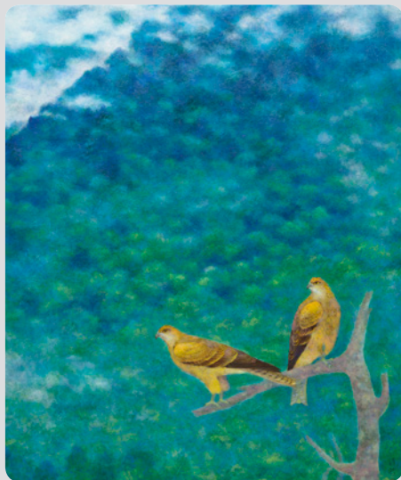
■ 《靈山傳奇》十連幅之七〈森域〉

日期：1/24 至 3/23 開幕典禮：2/8 (六) 10:30 地點：屯區藝文中心 展覽室 A