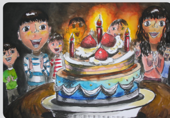
■ 六年級組第一名 僑信國小張紫妍

「第 21 屆全國兒童聯想創作畫比賽」決賽，於 102/12/8 從十三萬挑戰者中脫穎而出的 425 位小朋友集聚葫蘆墩文化中心現場即時創作，競逐前三名及佳作等獎項。