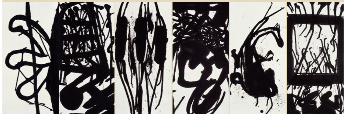
■ 陳幸婉〈德國·印象—听了葛瑞斯基的第三交響曲之後〉 140x450cm/1999/ 國立臺灣美術館典藏。圖像提供：國立臺灣美術館

這正是女性藝術家陳幸婉畢生關注的生死主題，也是足以付出生死代價探索的課題。在她逝世十年的紀念展前，我們謙卑聆聽她對人類命運所發出的呼求探問。END