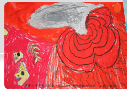
■ 一年級組第一名 草屯國小陳仲新