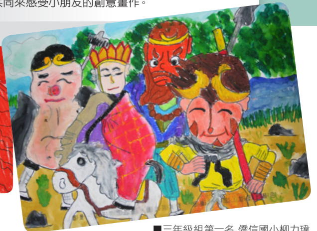
■ 三年級組第一名 僑信國小柳力璋