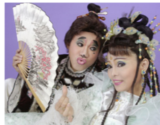
■ 明華園日團歌仔戲。

配合民俗公園遊園活動，安排熱鬧有趣的表演節目於每天的下午 2:30 準時演出，計有魔術喬治、川劇變臉、知己二重唱、海島音色、廖千順布袋戲團及來自東歐的 Katushya 舞團和加勒比海國家的 Nevi 加勒比海雷鬼樂團等音樂、戲曲、民俗各類團隊，讓民眾在遊園之時亦可觀賞到精彩的表演節目。