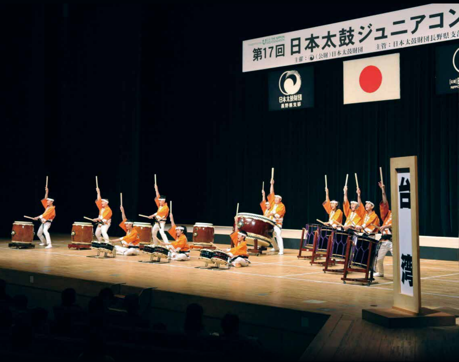
▲ 比賽時精彩演出驚艷全場，不負「臺灣之光」美名。