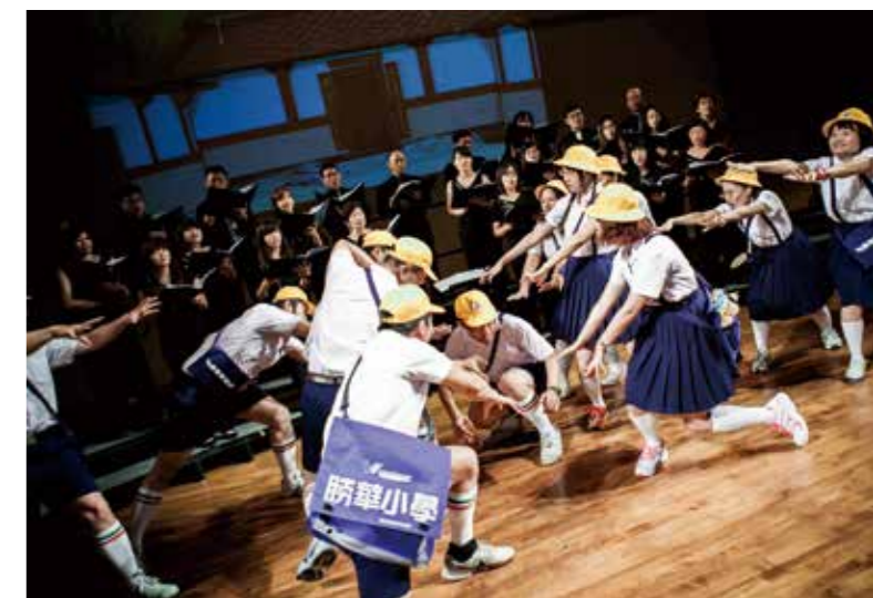
▲ 親子音樂會演出

他們用多年來累積的努力，證明合唱實力，「立足臺中、放眼國際」將繼續用畢生心力傳遞音樂無國界的感動給更多的朋友！