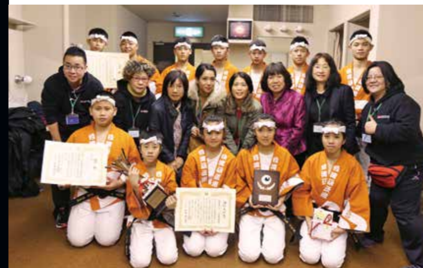
▲ 得獎後於後台合影留念