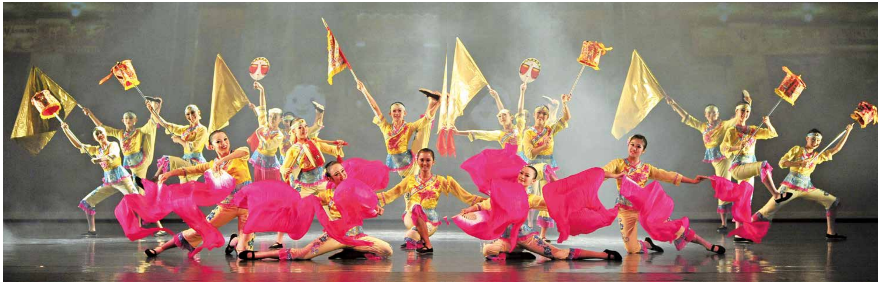
▲《節慶歡慶》演出劇照