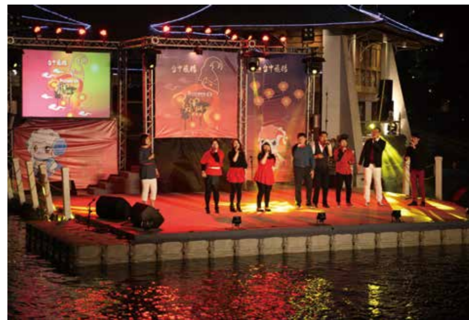
▲ 子團「Choco Lava 人聲樂團」在 2015 臺中燈會上表演

有了與松下耕的合作經驗，更促使台中室內合唱團往國際邁前一步，明年將受邀前往日本輕井澤參加「合唱音樂節」表演，準備最能代表臺灣原住民的一系列表演，呈現臺灣的風土民情之美，在世界舞臺上大放異彩。