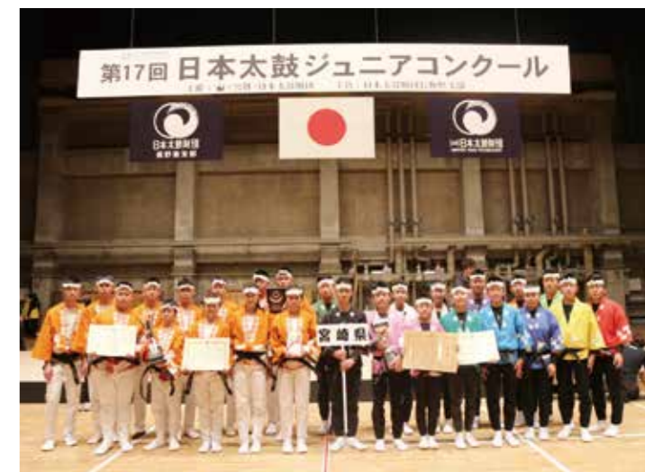
▲ 與第一名宮崎縣代表合影，臺日友好啓新頁。

又見臺灣之光！臺中市的在地演藝團隊「葫蘆墩 Smile 太鼓團」在今年 3 月 22 日代表臺灣前往日本長野參加第 17 回全日本太鼓青少年競賽，榮獲第三名的佳績，消息傳來，臺中市民歡欣鼓舞。