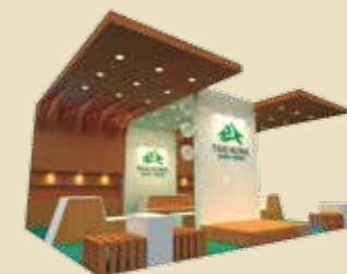
► 臺中生活館 3D 情境示意圖

日期 4/29 (三) 至 5/4 (一) 地點 臺北華山 1914 文創園區 (臺北市八德路一段 1 號)