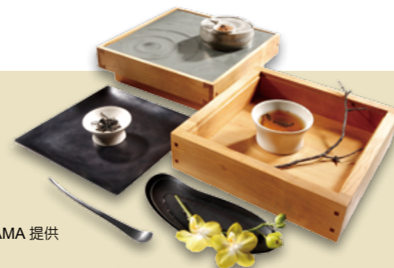
► ZAMAMA 提供