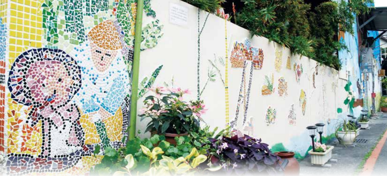
▲ 社區居民用馬賽克拼貼讓牆面更繽紛有特色