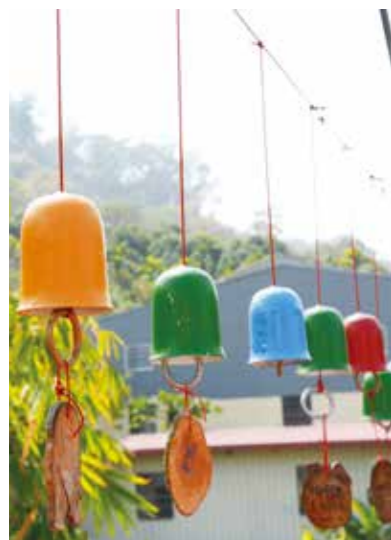
▲ 桐林 3 號橋畔的陶鈴，隨風搖曳生姿。