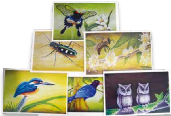
▲ 利用彩繪製作成的明信片