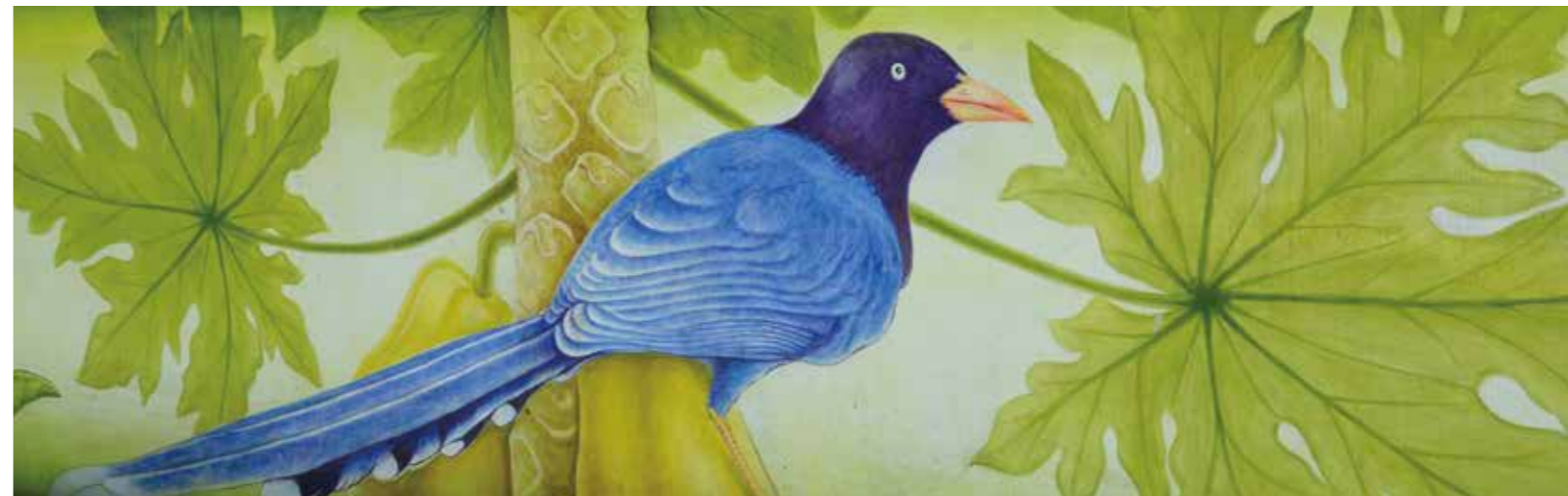
▼ 臺灣藍鵲為主題的牆面彩繪

融合既有的生態資源，挖掘屬於桐林的人文故事，發展特有的生態教育、協助農產業生產，融入生活文化，最終傳承桐林鄉土文化，將桐林社區的故事一代傳承一代。林理事長強調，桐林社區營造的過程並非一帆風順，都需要不斷的協調，以及發揮巧思，以及靠著社區居民共同努力，才能有至今的成果。未來將結合傳統農業、生態教育、文化創意三項主軸，發展終極的生態村落，著重生態觀光，吸引人潮發展民宿產業，將桐林打造成一個生態樂活村。