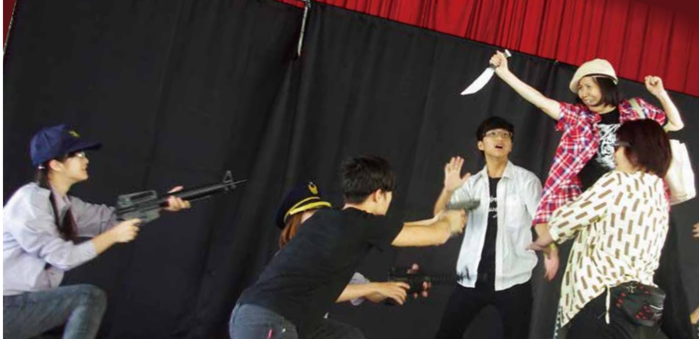
▲ 社區成員投入劇場排演

俗話說「人不親土親」，但在都市發展與時代轉變下使得人與人間、人與土地間的情感連結逐漸淡薄，因此工學協會透過劇場的方式拉近里民距離，凝聚出社區的向心力，找回對於地方的認同感。於2014年臺中市社區文化季中獲選進行劇場演出，獲得熱烈迴響與各界肯定，不僅找到了地方特色文化，也讓更多人看見與認識自己的家鄉。