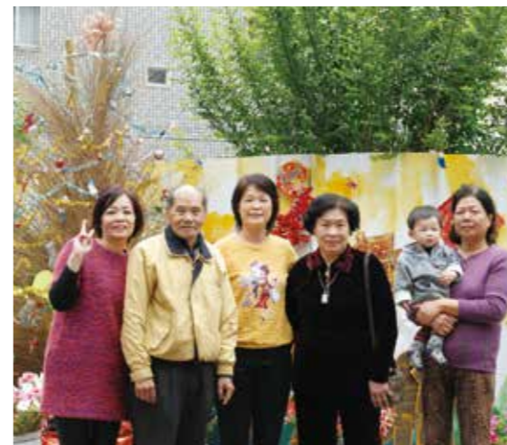
▲ 社區成員宛如一家人

後來很多鄉親或旅客都會以兩棵大樹作為活動集合的地點，大樹下更是成為左鄰右舍工作之餘聊天、泡茶的好地方，也是孩子們嬉戲的好場所，老一輩的人稱這裡為「樹仔腳」，也成了工學里的舊名。