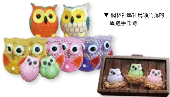
▼ 桐林社區社鳥領角鴞的周邊手作物