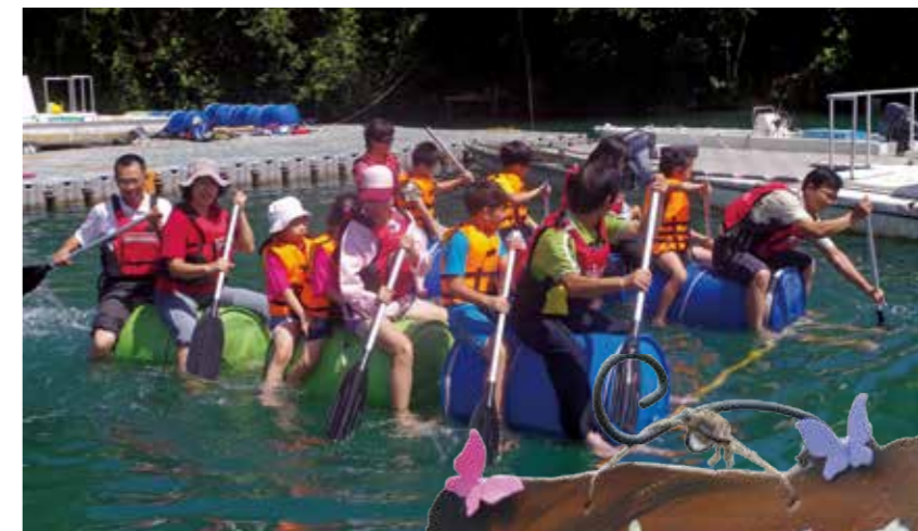
▲ 透過社區趣味活動，拉近社區間的情感連結。