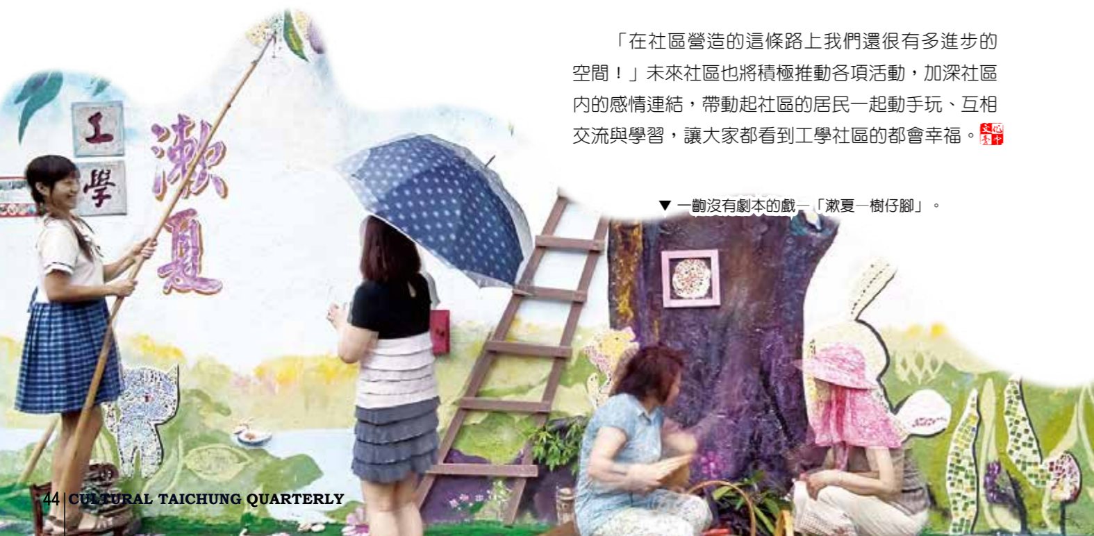
▼ 一齣沒有劇本的戲—「漱夏一樹仔腳」。

「在社區營造的這條路上我們還很有多進步的空間！」未來社區也將積極推動各項活動，加深社區內的感情連結，帶動起社區的居民一起動手玩、互相交流與學習，讓大家都看到工學社區的都會幸福。