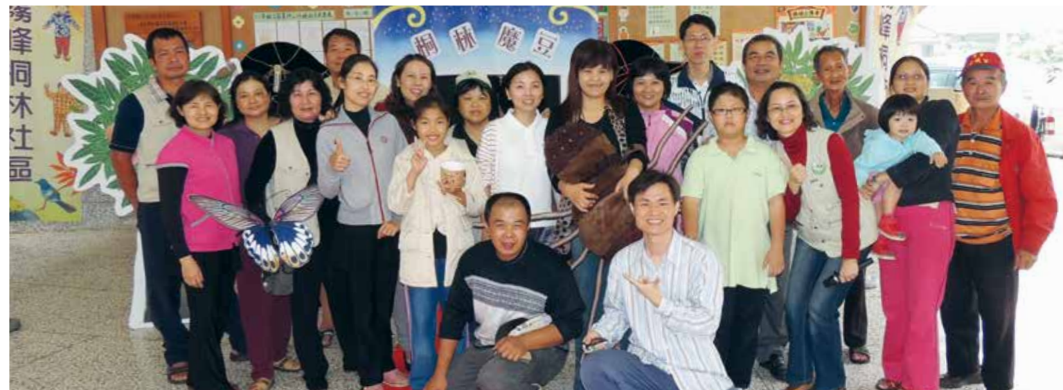
▲ 2012 年桐林魔豆木偶劇團在桐林國小公演後成員留念