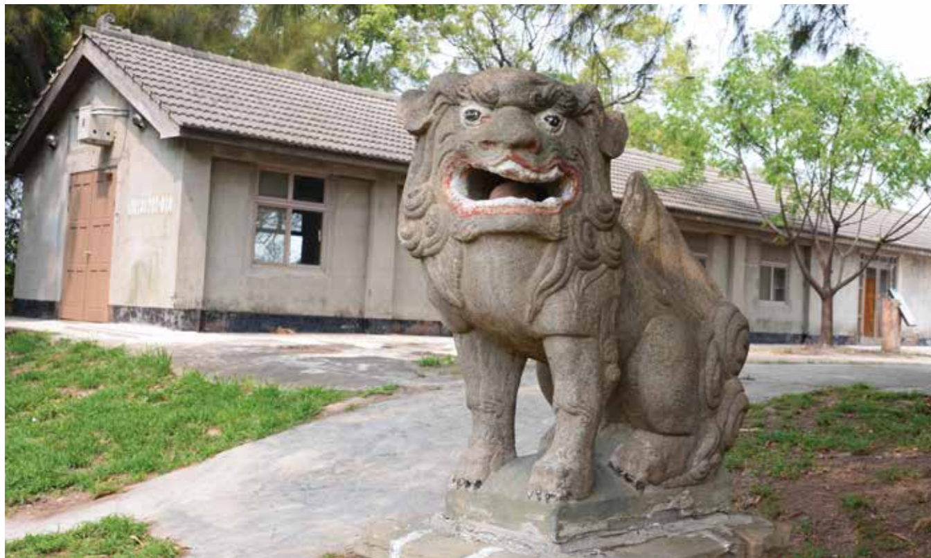
▲牛罵頭遺址文化園區