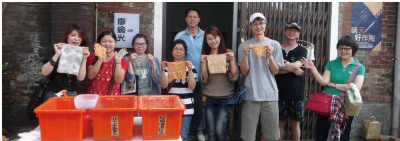
▲ 陶雕創意社在 20 倉庫舉辦晴天好作陶的泥染體驗活動。