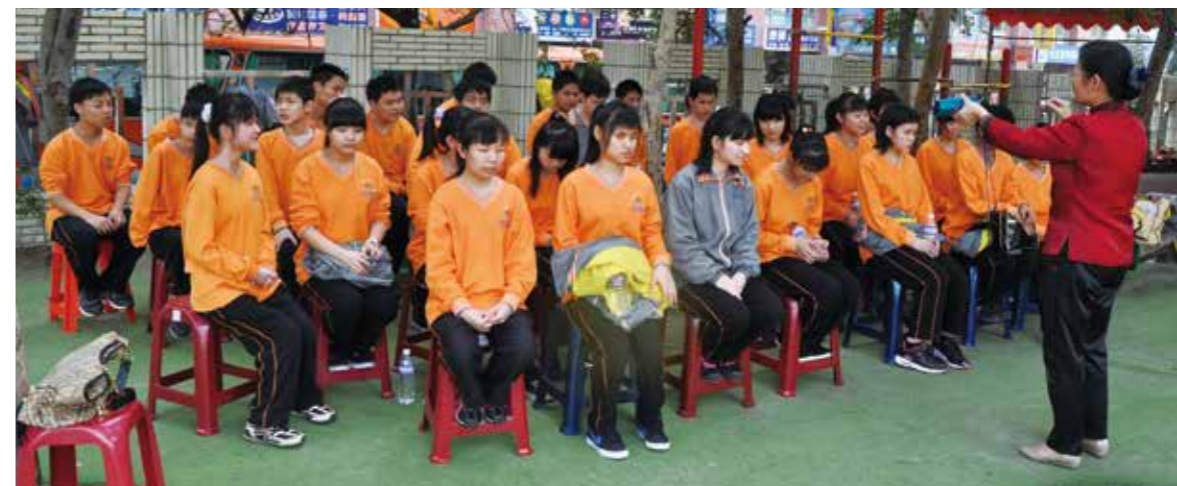
▲ 把握比賽前的最後練習時間，調整到最佳狀態。