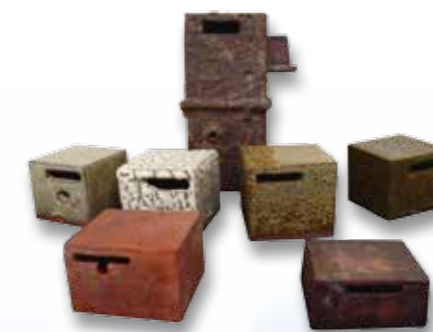
▲ 紅厝造型的作品，亦可作為存錢筒使用。

目前規劃「礦物染前世今生」、「五色與火山泥染」、「大肚夕照染布品」、「紅土染小小手飾」等活動單元，讓民衆參與的過程中，體驗到包括泰雅族色舞繞泥染、大肚山洪溪染、窯作紅殼土、石質紅土、蟻穴泥染、火山泥染……等，在繽紛的紋理與色澤，深刻感受泥染此項歷久彌新、尊重自然的傳統文化，學習人與自然和平相處之道。