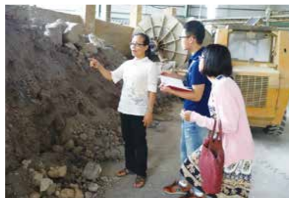
▲ 社團至外埔區的一成陶器工廠參訪

2014 年，廖倫光帶領陶雕創意社發起「搶救大肚山滾滾紅濤：以紅土陶作之名」的活動，秉持著推動針對大肚山土壤流失議題的另類反思、進行沙鹿古窯在地資源的創意提案、提升自然紅土的人文意義與發展等 3 大理念，透過學生的田野調查，詳細掌握大肚山紅土嚴重流失的地點，並經過實地的採土、練土、捏土作陶一系列的實作過程，廓清還原這片土地的真实樣貌，同時喚醒社會大眾對於大肚山自然生態的重視。