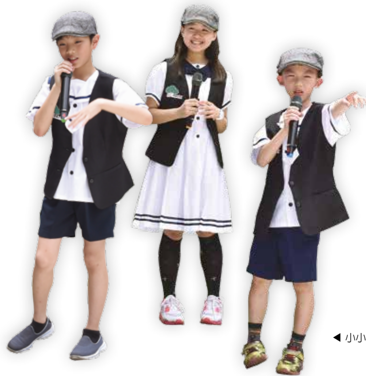
◀ 小小導覽志工們熱心解說