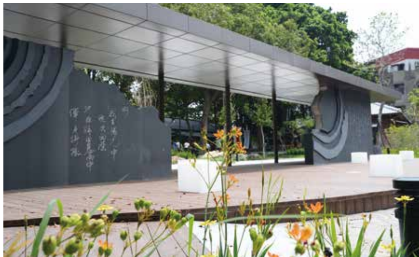
◀ 墨痕詩牆，師法自然，詩意無限。