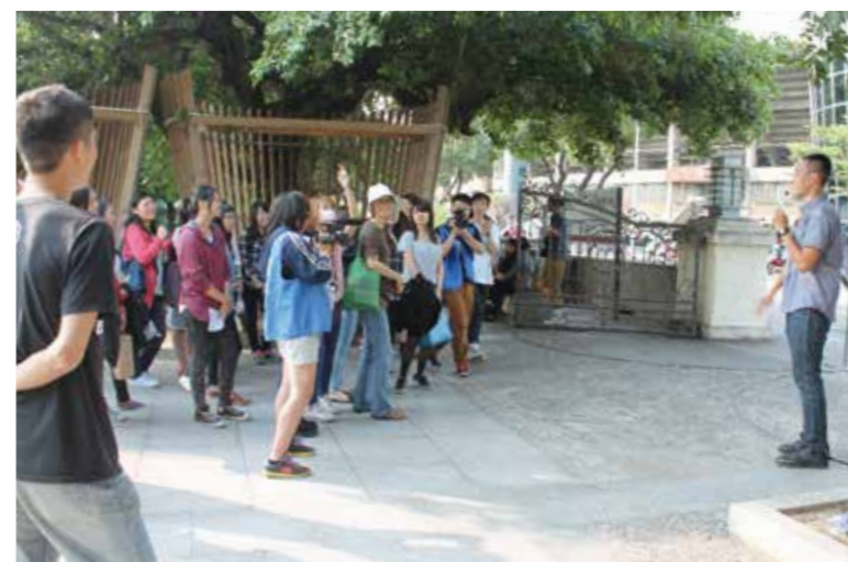
城市輕旅行活動帶領民眾認識放送局

前期的經營與營運，藉由文化行銷重新出發，將放送局作為臺中文化創意發展的新基地，讓更多資源透過放送局這獨特的地理位置，向中臺灣傳播更多國際化資訊、藝文消息與在地文化資源，使放送局成為一個文化創意交流平台，定期舉辦各類型的市集活動，讓更多人看見中臺灣地區的創意小物、手作設計等，亦能為產地直送的小農舉辦農特產市集，帶給更多朋友輕鬆無負擔且安全的食用到新鮮健康的蔬果，從無形的文化創意發展，到有形的文創設計商品，都將帶給中臺灣更多文化創意的觸媒與發展可能。