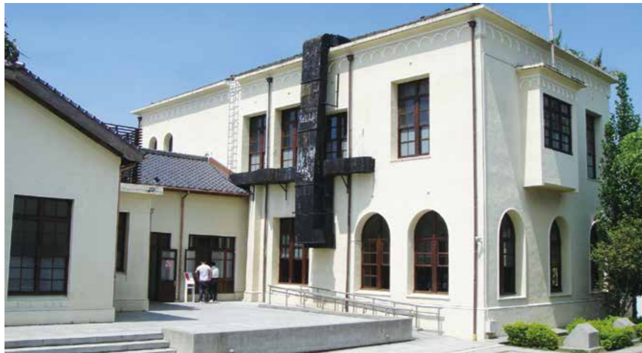
多扇窗櫺隨著光影變化映照款款風情