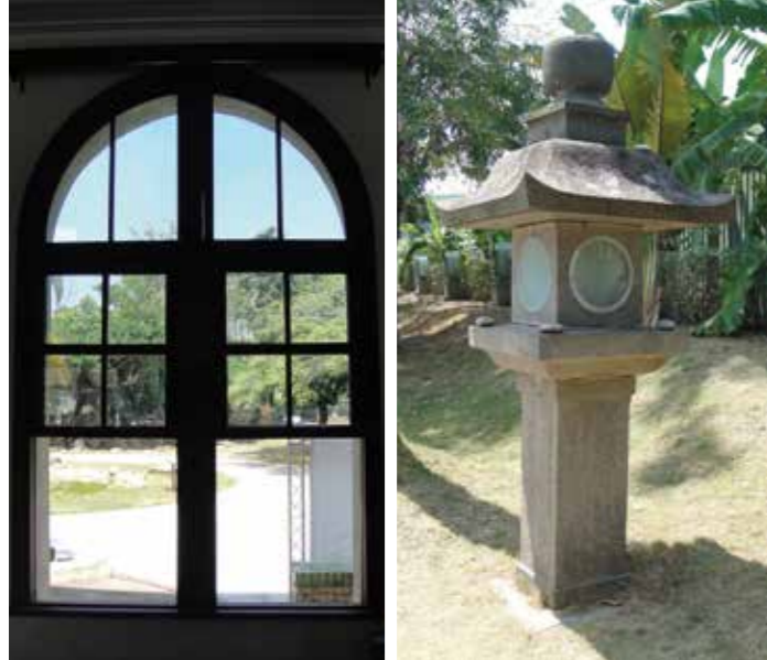
拱門型的窗櫺，風味十足。