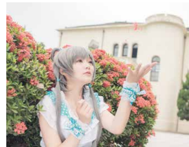
建築特色吸引眾多 Cosplayer 前往拍攝