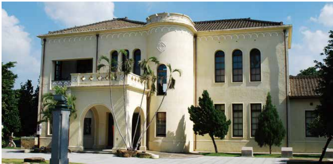
復古懷舊的建築外觀，是熱門的婚紗拍攝景點。