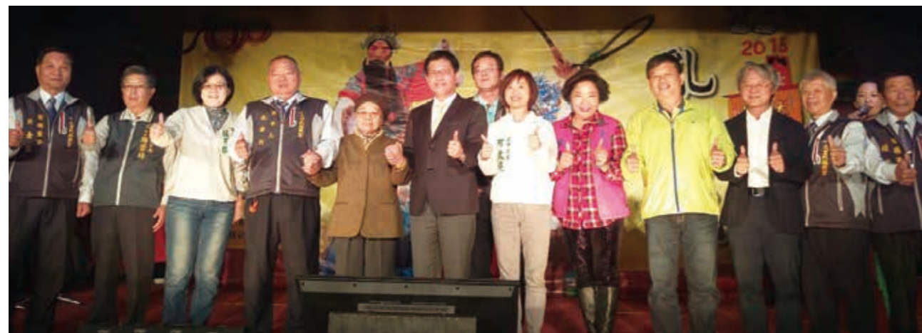
市長、與會貴賓與亂彈戲國寶潘玉嬌老師合影

有「亂彈嬌」美譽的潘玉嬌老師，深耕北管60餘年，勤於演出、教學及唱工，1990年榮獲教育部第6屆民族藝術新傳獎殊榮，並投入北管傳承與教育事業，除出版「亂彈戲曲唱腔」CD及錄音帶外，也創作數本樂譜，保存傳統戲曲的精髓；2013年登錄臺中市重要傳統藝術—亂彈戲技藝保存者，2015年文化部更授證「人間國寶」，表彰潘玉嬌是國內碩果僅存的亂彈戲表演藝術家，也榮獲第四屆臺中市表演藝術金藝獎的殊榮。