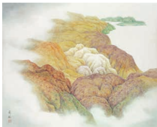
五彩山意象 - 雲

圍，呈現岩石與浪濤間的力動感，「雪韻系列」、「五彩山意象系列」表現遊歷黃山、新疆所見之震撼景象；宗教題材「聖地系列」、「福音西傳系列」以主觀色調寄託生命思考，而妻子罹病逝世的衝擊，詹前裕在「玉山圓柏」系列作品中，以臺灣高山險峻環境中屹立不搖的曲折柏樹，隱喻堅強的求生意志，其中「玉山圓柏 - 秋夜、枯寂」以藍色表現黑夜的憂鬱悲傷，但充滿生命力的蜿蜒柏樹突破了這片藍色憂鬱，帶來了生命的力量。而「牡丹小品系列」是最新創作，展覽中可以看到粉色、白色、金色等不同顏色牡丹，藉著牡丹探討色彩，美妙無比。