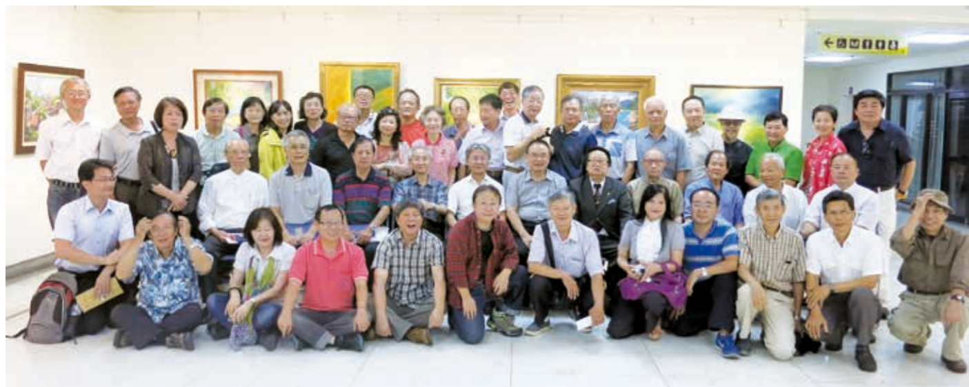
南部展全體會員與王志誠局長大合照