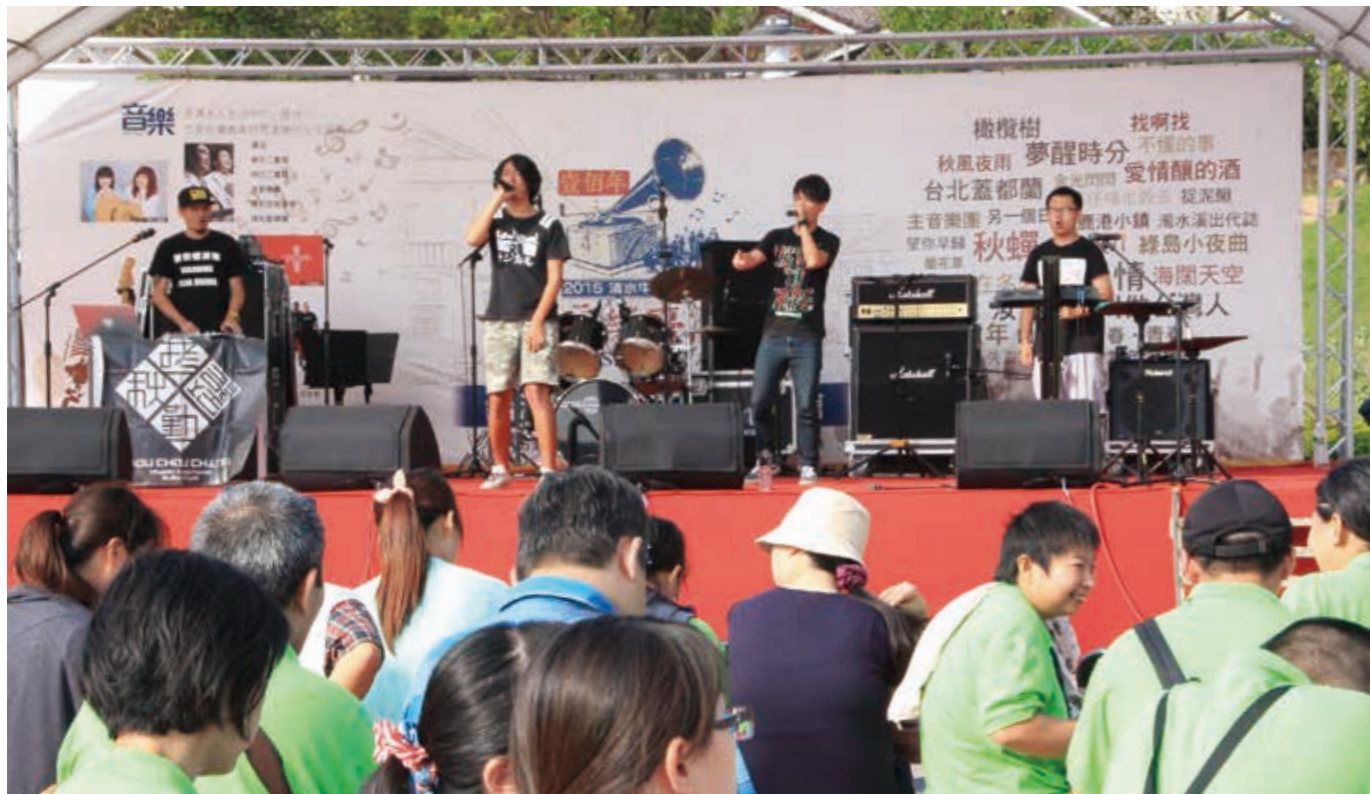
拷秋勤樂團演唱一首首膾炙人口的好歌，讓活動現場氣氛推向最高潮。