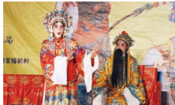
亂彈戲著名戲齣 - 「放雁·走三關」

《放雁·走三關》敘述王寶釧與薛平貴的愛情故事，在北管戲曲中屬於經典戲，曲牌中包含導板、西皮、刀子、緊板、彩板...等，每位老師指導的唱腔上也不一樣，因此展現出不同的風格。