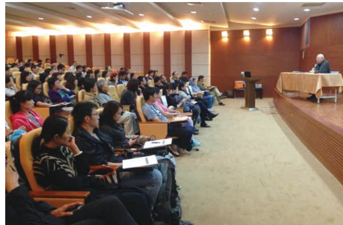
洛夫於屯區藝文中心開講，吸引大批民眾爭睹詩人風采。

講室，以〈一台卡車、兩家書店—水牛書店與我愛你學田的實踐分享〉為題，分享其創業的心路歷程及每個事業背後的經營理念。