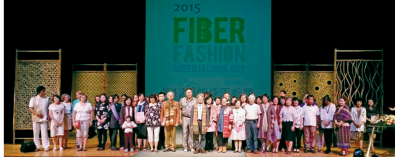
第 12 屆編織工藝獎頒獎典禮