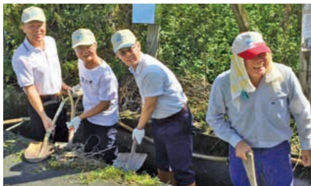
清淤疏圳，是新社區居民團結合作的象徵活動。

九庄媽為新社區深具歷史特色之信仰，有別於一般媽祖信仰，九庄媽的最大特色為「有神無廟」，至今仍由新社區內六村八庄的居民輪流奉祀，即所謂「爐主」。一年一度的「新社九庄媽遊庄」，由新社、山頂、畚箕湖、大南、土城、馬力埔、擺頭店、鳥銃