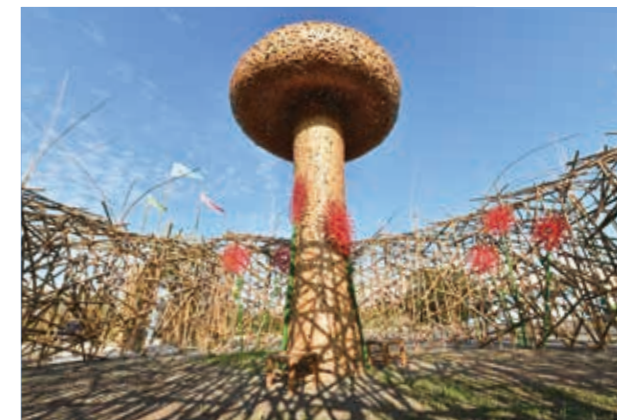
徐啓盛作品：〈福源廣佈〉

市長偕同各局處長官、地方議員、日本議員及磯田謙雄家屬一同切生日蛋糕，歡慶白冷圳完工啟用 83 周年。