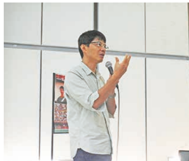
作家甘耀明與聽眾分享在山林田野調查之於創作的關聯性

104年10月31日，葫蘆墩文化中心演講室，擔任第73棒的作家甘耀明，其小說作品常融入客家語、文化及歷史，擅用民間習俗編織成一篇篇的鄉野傳奇，在文壇中具有極高的文學辨識度。此次，作家以〈一座山林學校的復建與拆毀—從小說《邦查女孩》談起〉為題分享寫作歷程與生命經驗。