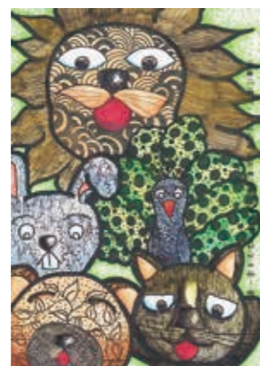
臺中市 順天國小 六年美班 蕭羽岑