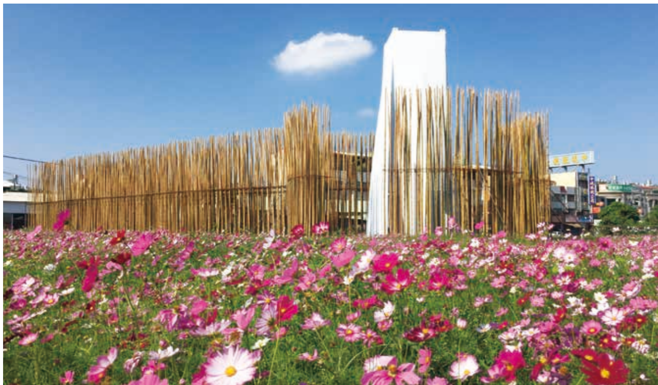
顏名宏作品：〈走入竹光的蒼穹—德布西與媽祖、洛書九星的空間組曲〉