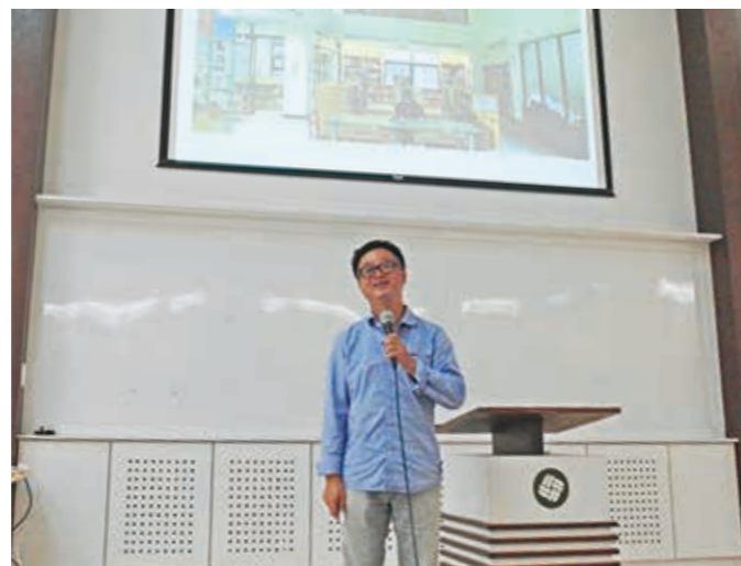
羅文嘉與臺下聽眾分享轉換跑道經營書店的心路歷程

曾擔任過立委和客家委員會主委的羅文嘉，卸下政治光環的身分後，投入偏遠地區學童教育的的逐夢事業。此次他亦響應「當全世界都在閱讀一百師入學」活動，於104年11月7日於葫蘆墩文化中心演