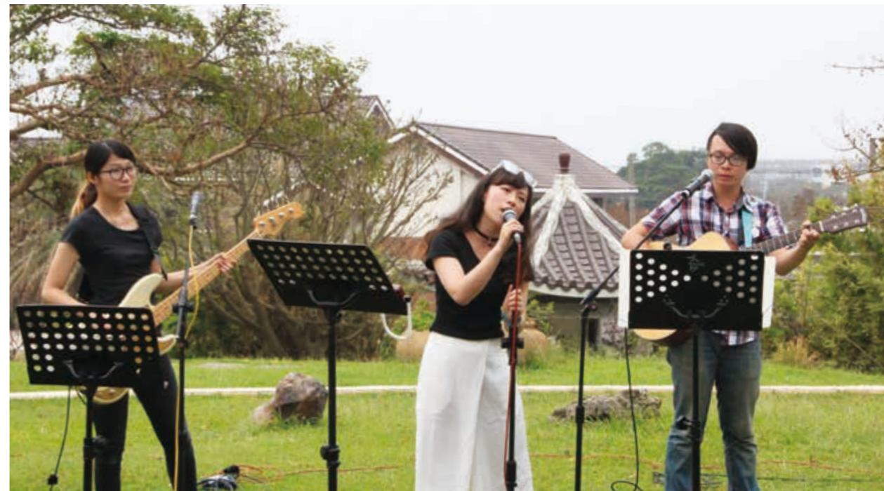
陽光、草坪、主音樂團，用音樂感染港區藝術中心現場的每一位聽眾。