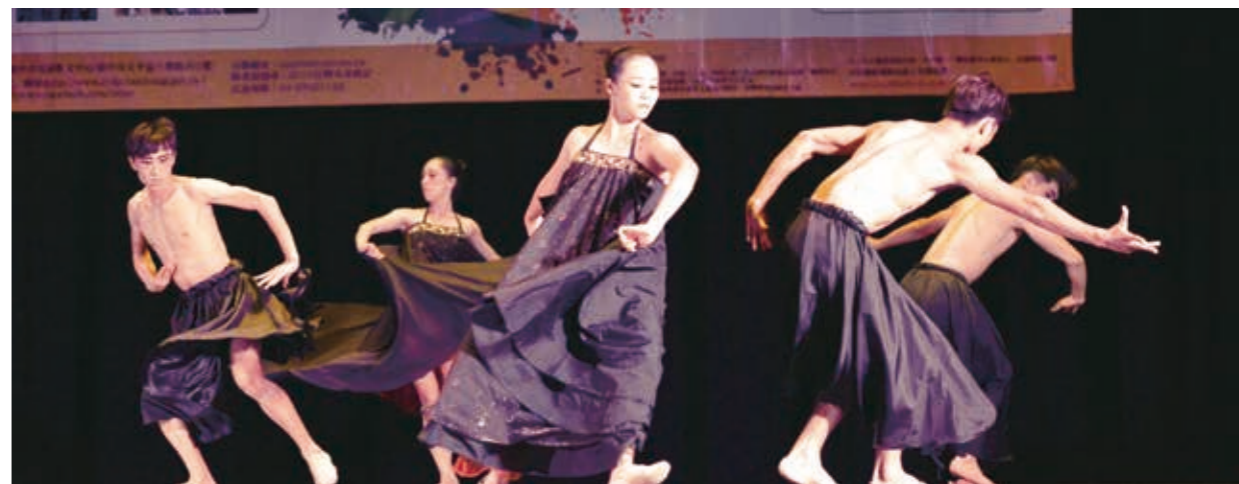
瓊瑤舞蹈團舞者展現優雅舞姿及舞者的自信、風範。