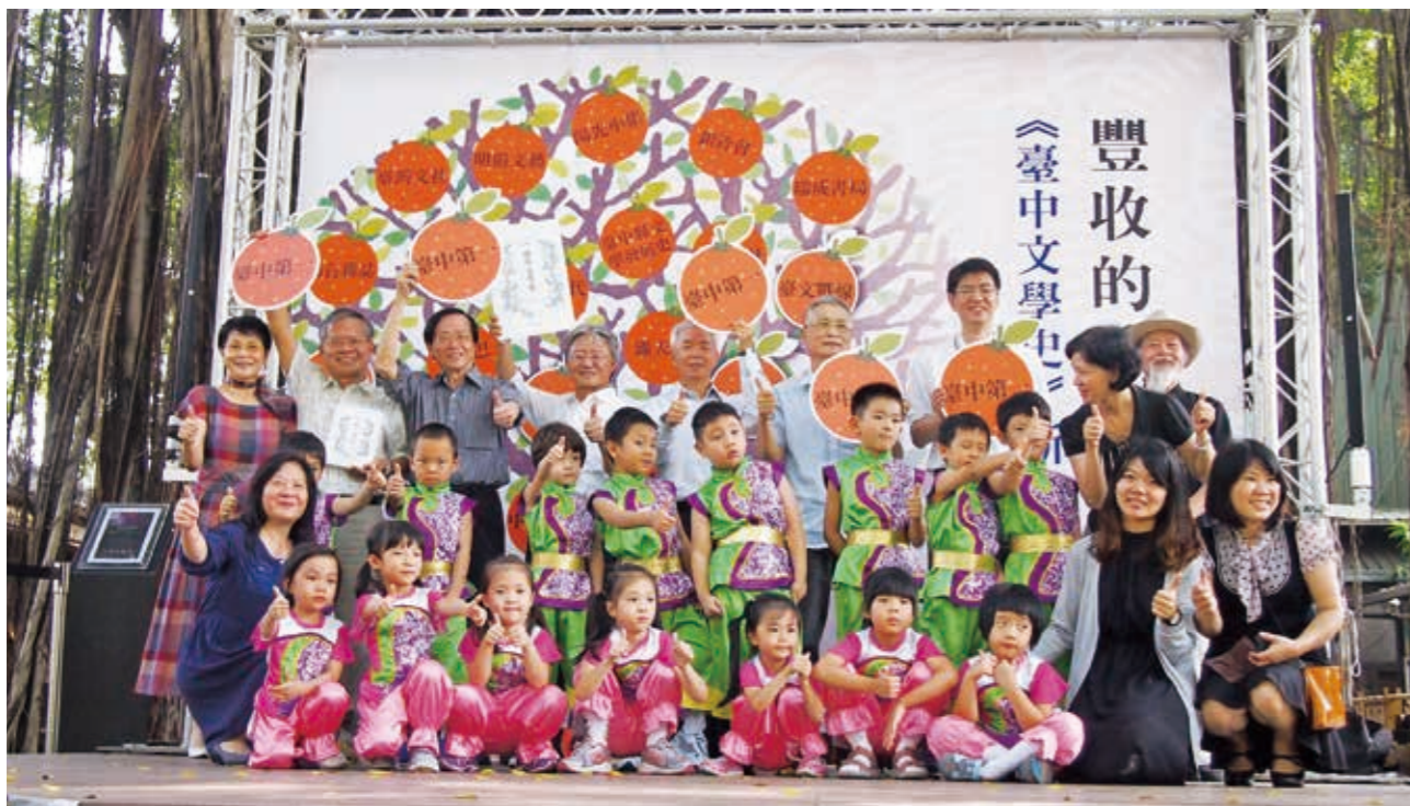
豐收的季節，臺中傳統與現代詩社代表出席見證《臺中文學史》出版。