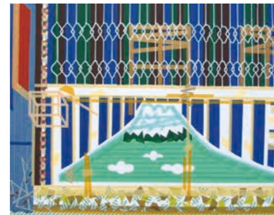
窗景的空間詩 - 金寶山之詩

本屆入選作品，包含單一創作媒材23件（油彩6件、版畫6件、壓克力4件、水墨2件、膠彩1件、水彩1件、原子筆1件、攝影1件、纖維創作1件）、複合媒材16件及1件於展覽現場手繪創作等40件，相當豐富多元。當代藝術創作者在媒材使用上多數仍舊偏好綜合多種媒材之屬性，乃至結合非繪畫媒材，譬如：紙膠帶、油漆、樹脂、日光燈管、鏡子、壓克力等物品，然而不同以往的是堅守單一媒材的創作者有回流現象，特別是版畫創作的表現，以傳統媒材展現年輕創作者表現形式新意象的企圖心。另外有多位入選者不約而同，以組件的形式排列組合成一件完整的作品、陳述作品之間的延續性，或強調作品因地制