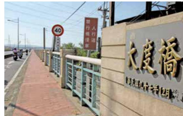
大度橋是烏溪與大肚溪的分界點，這座橋應正名為大肚橋。

我們從臺灣堡圖 (1898) 可以看到，烏日下街仔是民居聚集地，信仰中心王公廟 (今廣惠尊王 - 寶興宮) 與烏日庄役場均設於此，方圓約 300 公尺內是行政、經濟與市集的核心。在日本治明、大正年間，興建北邊的縱貫公路 (今中山路)，明治 41 年 (1908) 縱貫鐵路通車後增設烏日站，發展重心逐漸北移，烏日火車站前成為另一個新興點，稱為頂街仔，逐漸取代下街仔。