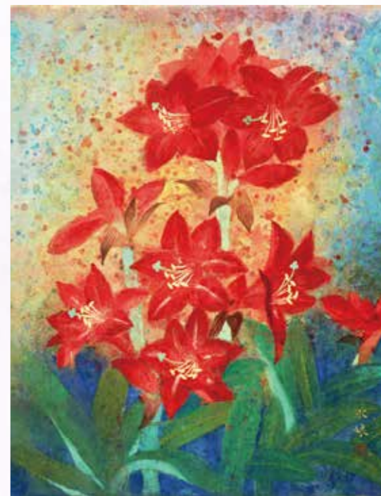
李水娘 - 孤挺花