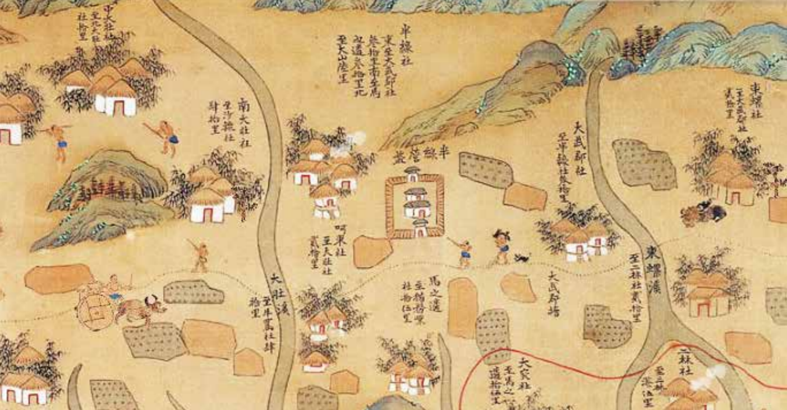
康熙輿圖中，首次出現中部的大肚溪。