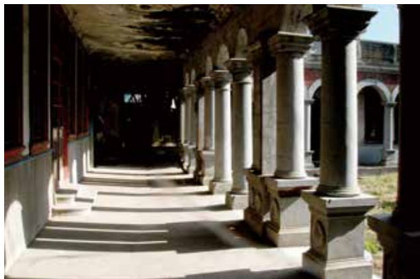
聚奎居正面的石柱十分宏偉

前大里溪北岸當地還留有「阿密哩」地名；二、拍瀑拉族大肚南社，在大肚溪畔烏日、湖日、頂勝厝（三和里）與下勝厝（榮泉里）等地，三、洪雅族（Hoanya）貓羅社 - 在石螺潭、同安厝、溪心填與喀哩等。