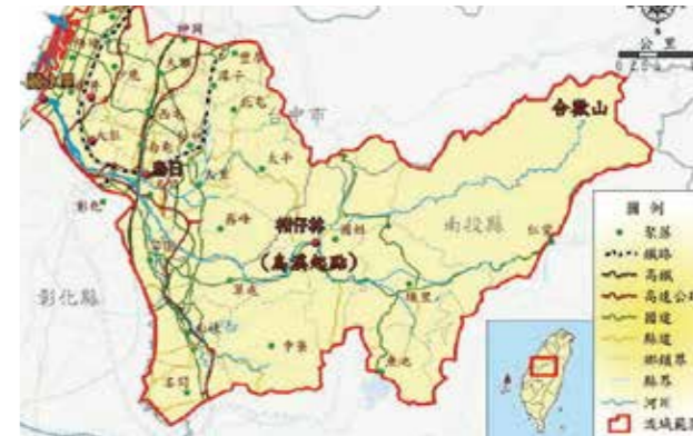
大肚溪流域圖

談到臺灣中部早期的平埔族 5 ，烏日地區原住民分佈可能有兩族三社：一、拍瀑拉族 (Popula) 貓霧揀社 4 ，分佈烏日九張犁、頭前厝與五張犁一帶，目