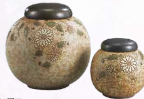
周妙文 - 富麗