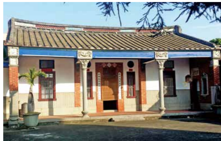
石螺潭林家合院順德堂