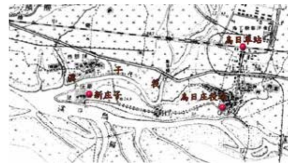
大正 10 年臺灣堡圖上，才出現烏溪名稱。