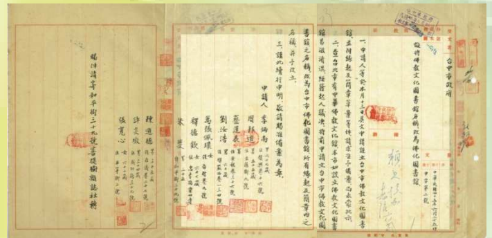
▲上圖為民國四十五年六月二十五日，送文將佛教文化圖書館改名佛化圖書館。