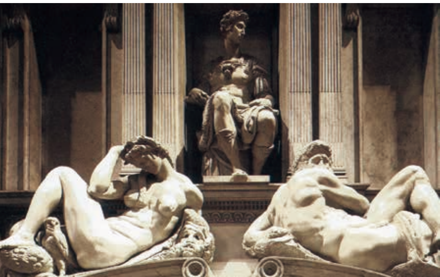
米開朗基羅作品「晝」、「夜」可謂公共藝術創作之濫觴。