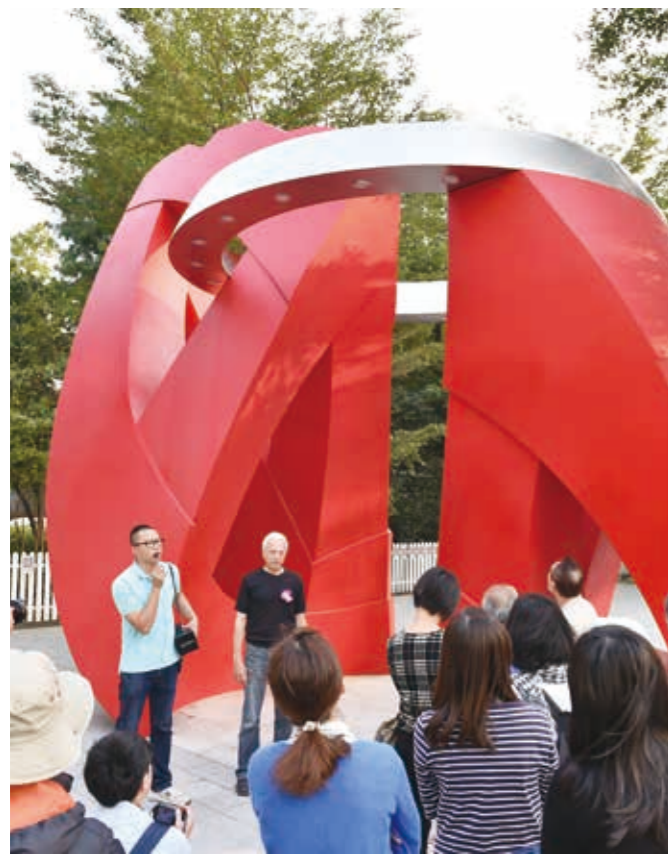
新市政大樓—從過去到未來之間

斬新澎湃的新市政大樓裡裡外外有多座公共藝術作品，中央區中庭有座紅色的大型作品「從過去到未來之間」，由法國藝術家艾瑞爾·穆索維奇 (ARIEL MOSCOVICI) 製作，抽象呈現一個擁抱的