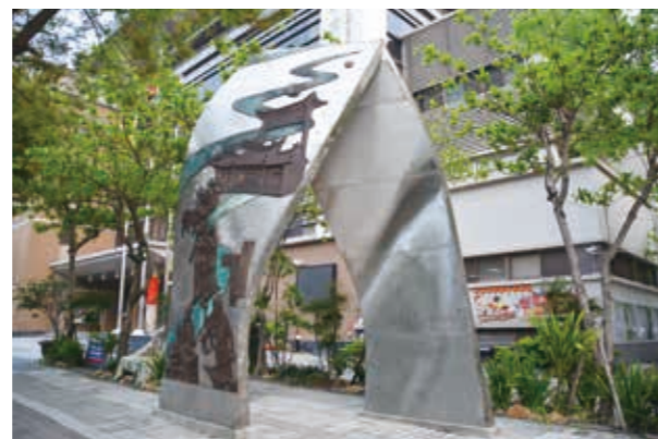
南屯區公所—祈福門

來到南屯區永春東路上落成僅三年的南屯區聯合辦公大樓，你會發現大門口有座以兩片不鏽鋼所組成的巨大作品，如兩人互相依偎象徵人與人間的互動，又如雙手合掌祈福。上頭的浮雕則刻出南屯的悠悠歲月，犁頭店打鐵、吃麻茅、躡鯪鯉及萬和宮，作者希望作品能讓長者回憶過去的點滴，也讓