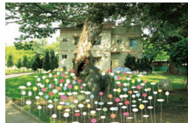
羅麗峯 - 加與減的歲月

而「藝術」在這樣的基礎上，成為了另類省思的推動「能源」——在此稱之為「藝能」。而這個「藝能」應該具備難以預估的強大「民眾動員」能量，並且在「借藝術之名」推行下，某些尖銳的社會命題得以獲得紓解與加強對話的機會。相信，這也是很多人的積極期待！