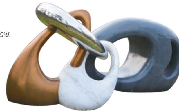
臺中女子監獄—心·鎖

「思想是自由的囚籠。當思想、意志失去了自由，才是真正的牢獄。」作品以眼淚環環相扣作為主體，當時一念之差的錯誤決定釀成這些眼淚，因而來到這裡，但所幸雖然身體失去了自由，但我們的內心卻是自由的，只要經過愛與省思後，我們便可以打開心鎖，脫胎換骨地展翅高飛了。看似冰冷的監獄擺放了如此有溫度的藝術作品，讓希望永不熄滅。