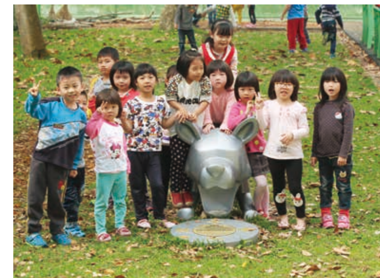
大甲幼兒園的小朋友們興奮地圍在黃柏仁作品「快樂狗」旁嬉戲

化公共藝術與學校課程、社區生活、城市紋理之結合，打造藝術化之公共討論空間。這次所舉辦的公共藝術節便是希望邀請民眾一同參與、瞭解公共藝術，培養更健全的公共藝術環境。