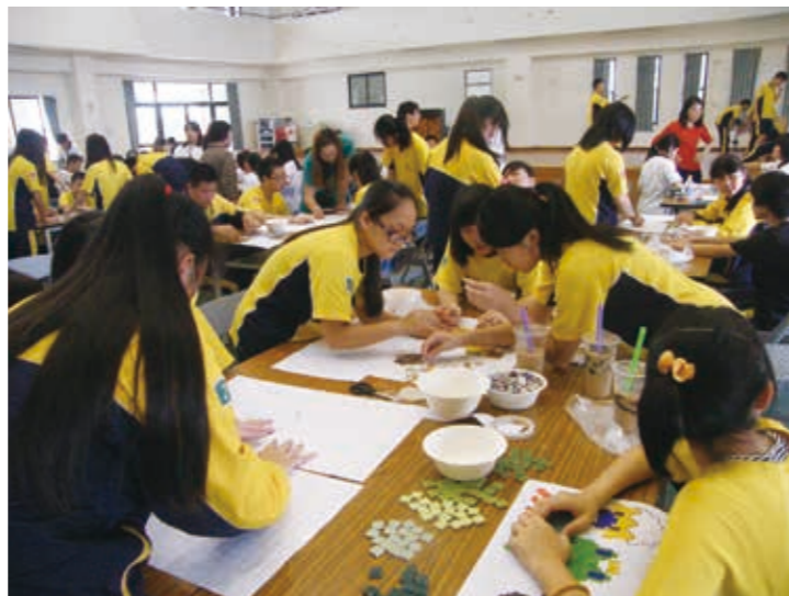
豐原國中的公共藝術作品是學生們一同參與製作完成的，為學子們留下難忘記憶。