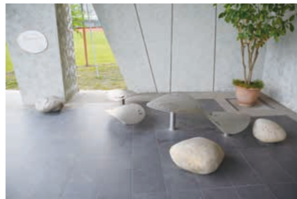
成功國小—歌腳石（旱溪印象）