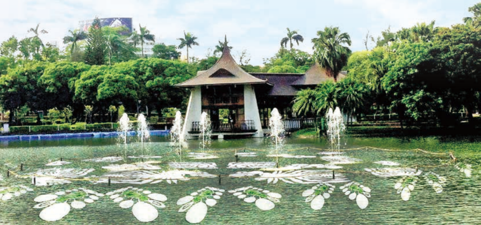
邱雨玟 - 水姑娘的繁衍計畫 - 漂浮記