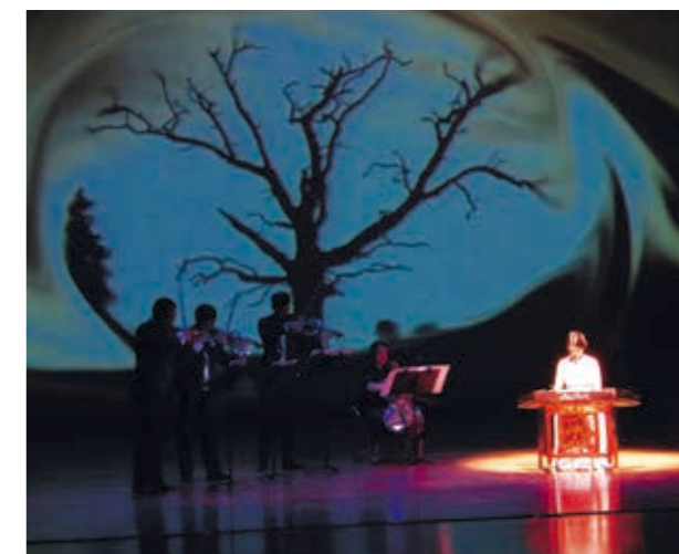
台灣揚琴樂團積極跨領域合作，展現多元表演風貌。