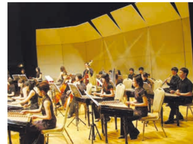
台灣揚琴樂團以立足臺中、臺灣發光、邁向國際舞台為願景。