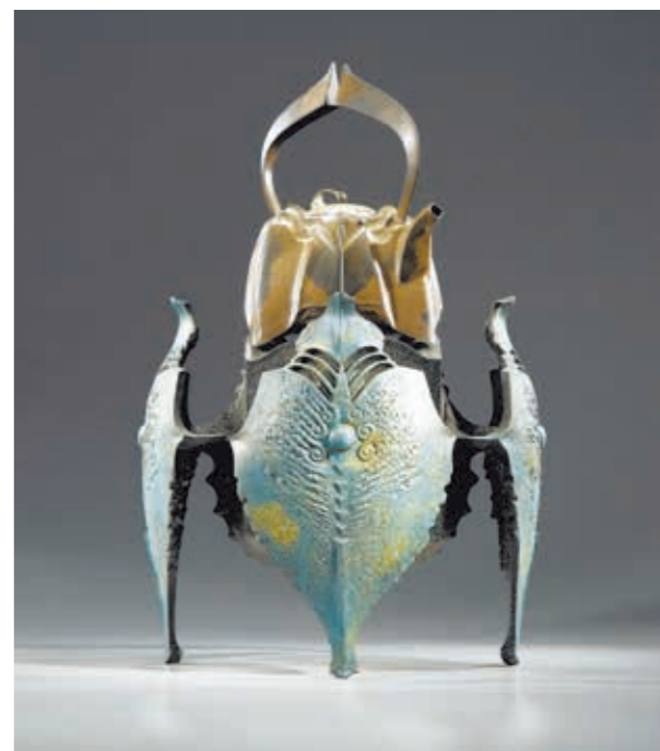
獲得韓國青州國際工藝設計競賽特殊榮譽獎的「修練」，揚名海外。

統」不是守舊，而是生命的根源，是心靈的原鄉，必須努力去創造新意、溶入當代，讓工藝文明得以延續。沒有根的樹是枯木，無延續性可言，有朝一日將隨風消散。欲窺傳統工藝奧秘，需先爬到巨人肩膀上，但現代人已無心爬巨人的肩膀，傳承千年的技法將逐漸消失……。