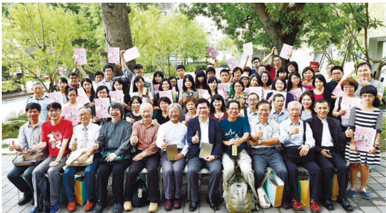
市長林佳龍與文學獎各類組得獎者、評審合影。