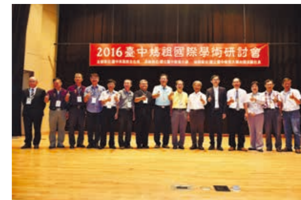
國內外學者齊聚一堂，從不同角度解析媽祖信仰文化。

年頭，今年於 9 月 24、25 日連續兩天在國立臺中教育大學舉行，邀請多位國內多位知名學者發表論文，並有來自中國、日本的學者與會，希冀讓臺灣的「媽祖學」研究得以奠基本土，並回應全球發展新方向。