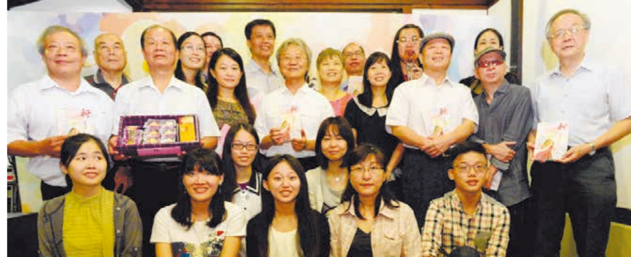
徵文比賽評審、貴賓與得獎者合影。

縣市合併至今，臺中文學獎已邁向第 5 年，投稿件數屢創新高，競爭激烈，未來的臺中將以創意生活首都為目標，每個人都能在此自在、恣意地透過文學對話與分享。