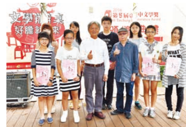
臺中青少年寫作族群日益茁壯，創作能量不容小覷。

此次，臺中市政府文化局也匯集了本屆兼具知性與感性文字，出版《豐原 6506：第五屆臺中文學獎得獎作品集》，期待與普天下的讀者對話，展示臺中文學的飽滿與豐盛。