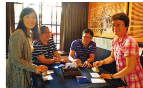
民眾參訪臺中文學館，仔細品讀建築與文學之美。

文化局長王志誠致詞指出，臺中文學館共有6棟館舍，規劃常設展區、主題展區、研習講堂、兒童文學區、主題餐飲區及行政區。常設一館設有「文心飛瀑」、「文學珍珠」等互動裝置，介紹臺中文學家及臺中文學發展概況；常設二館則以臺中文學地景、文學旅行為主題；主題展區的首場展覽以「春光關不住—普羅作家楊逵特展」打頭陣，展出楊逵