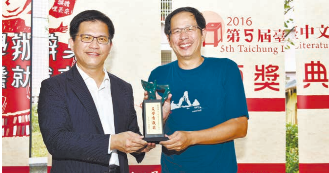
劉克襄（右）榮獲第五屆文學貢獻獎，林佳龍市長（左）親自頒發獎座。