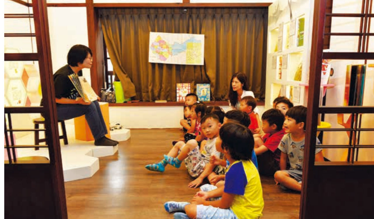
小朋友們在兒童文學區專注地聽老師說故事

高在上的神壇，而是融入庶民生活的一部分，也讓市民從日常中走進來，享受臺中文化城的生活氛圍。