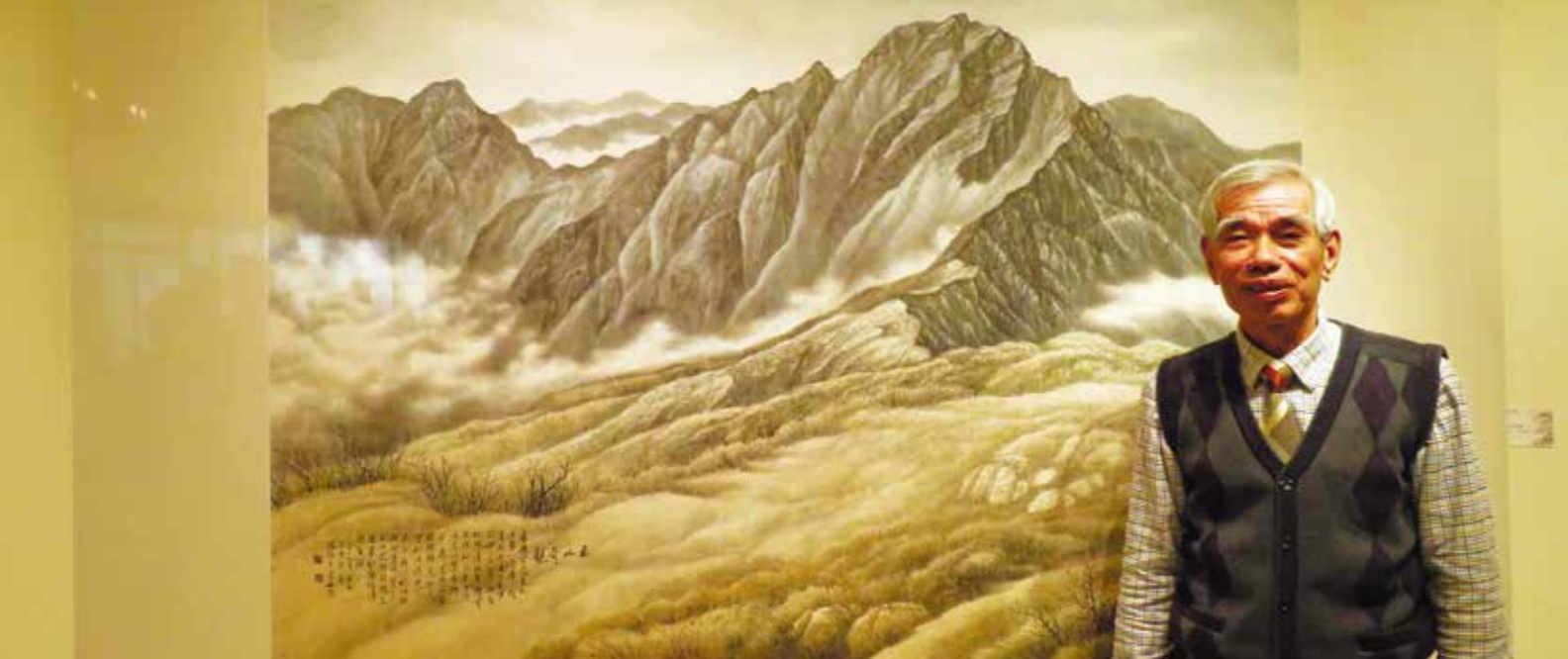
展覽現場最受大眾矚目的 2017 年新作〈玉山奇觀〉