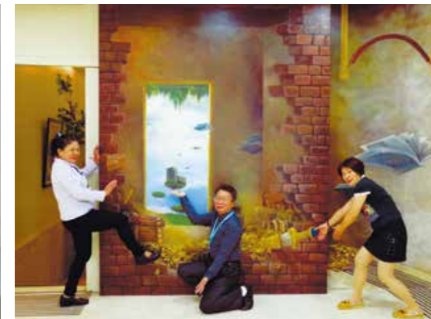
「藏藝 x 大墩 x 尋寶趣」3D 錯視彩繪牆面

透過花藝美化大廳，亦為藝術生活化的具體展現，2017 年 1 月 6 日至 2 月 16 日間，於大廳品字花臺策辦了「花枝招展喜迎新：2017 大墩新春花藝