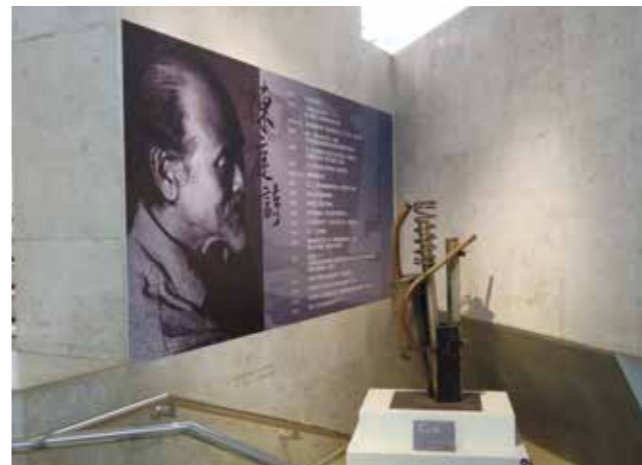
大墩典藏品—陳庭詩創作〈道〉

接 2018 臺中世界花卉博覽會，以手作彩繪瑪格麗特竹風車結合花語「期待的愛」，象徵土地的孕育順風轉動，以迎向未來為動力，繁花共構閃耀門庭為佈局，在夜晚更顯獨特風情，流露企盼 2018 花博盛會的到來。