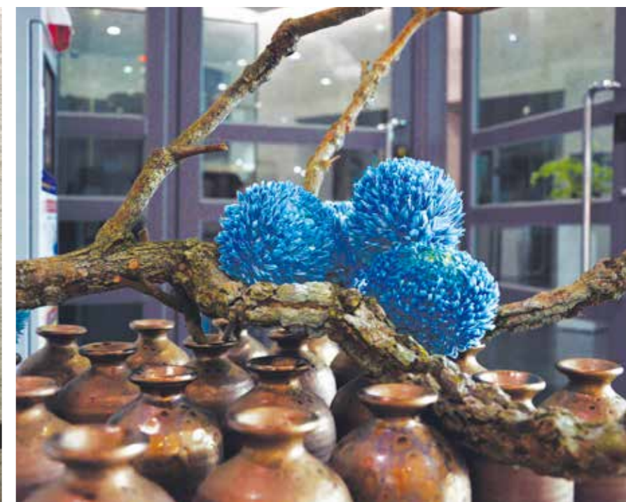
花穀子花藝設計工作室〈吉祥·平安〉