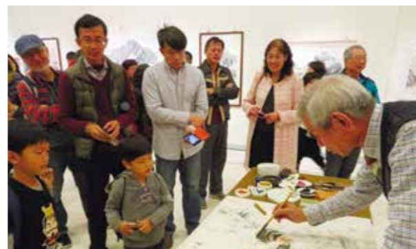
程錫牙教授為展覽揭幕現場揮毫