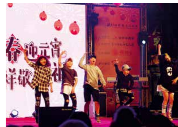
索布雷特舞團帶來精采的舞蹈表演

又是哨角齊鳴、娘傘如花翻轉的季節。今年大甲媽祖在 3 月 24 日（週五）晚上 11 點起駕，4 月 2 日（週日）回鑾安座，臺中市政府為配合大甲媽遶境活動，於 3 月 18 日、20 日及 22 日晚上 7 點在大甲蔣公路與育德路口，分別邀請「新藝芳歌劇團」、「藝人歌劇團」及「臺中聲五洲掌中劇團」演出起駕戲，向媽祖表達祝賀聖誕之意。