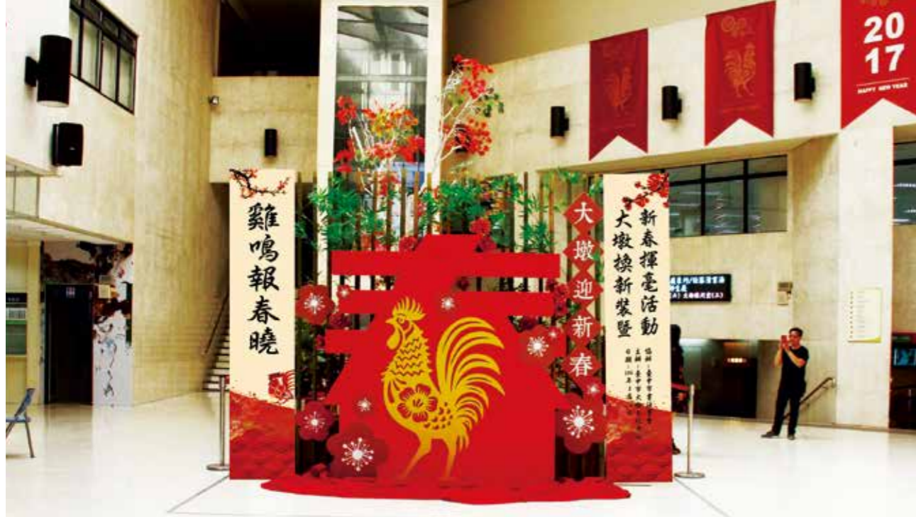
大墩文化中心展現新氣象