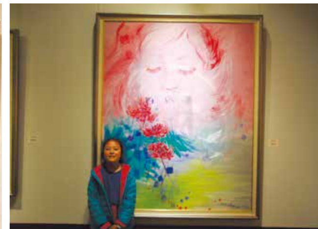
張淑美教授以 6 歲孫女為題的創作〈愛相隨〉

張淑美的創作時代橫跨逾 60 年，作品始終保持高度一致性，這或許可看做是她很早便有意識地建立起自我獨特的風格，且在長久的創作生涯中自始至終維持了此種符合其美學價值的風格脈絡。