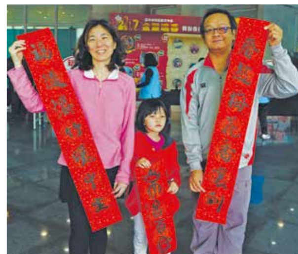
太棒了！一家大小都拿到各自想要的春聯。

前來領取春聯的民眾皆表示很開心能夠參與活動，透過領取書法大家的春聯，期許迎來更美好與福氣的新年，葫蘆墩文化中心則希望新春揮毫活動能夠讓大家樂迎金雞年、吉祥如意福氣來。