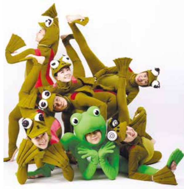
天真歡樂的布卡蛙，充滿好奇與熱情。

欣賞布卡律動劇場「大海的星願」後，生活中對孩子的每一種學習，都是生命過程中的小種子，一旦培養出對生命的熱情和不息的探索，擁有這般基礎，學什麼都不怕困難，這是很值得再繼續欣賞的劇場演出。