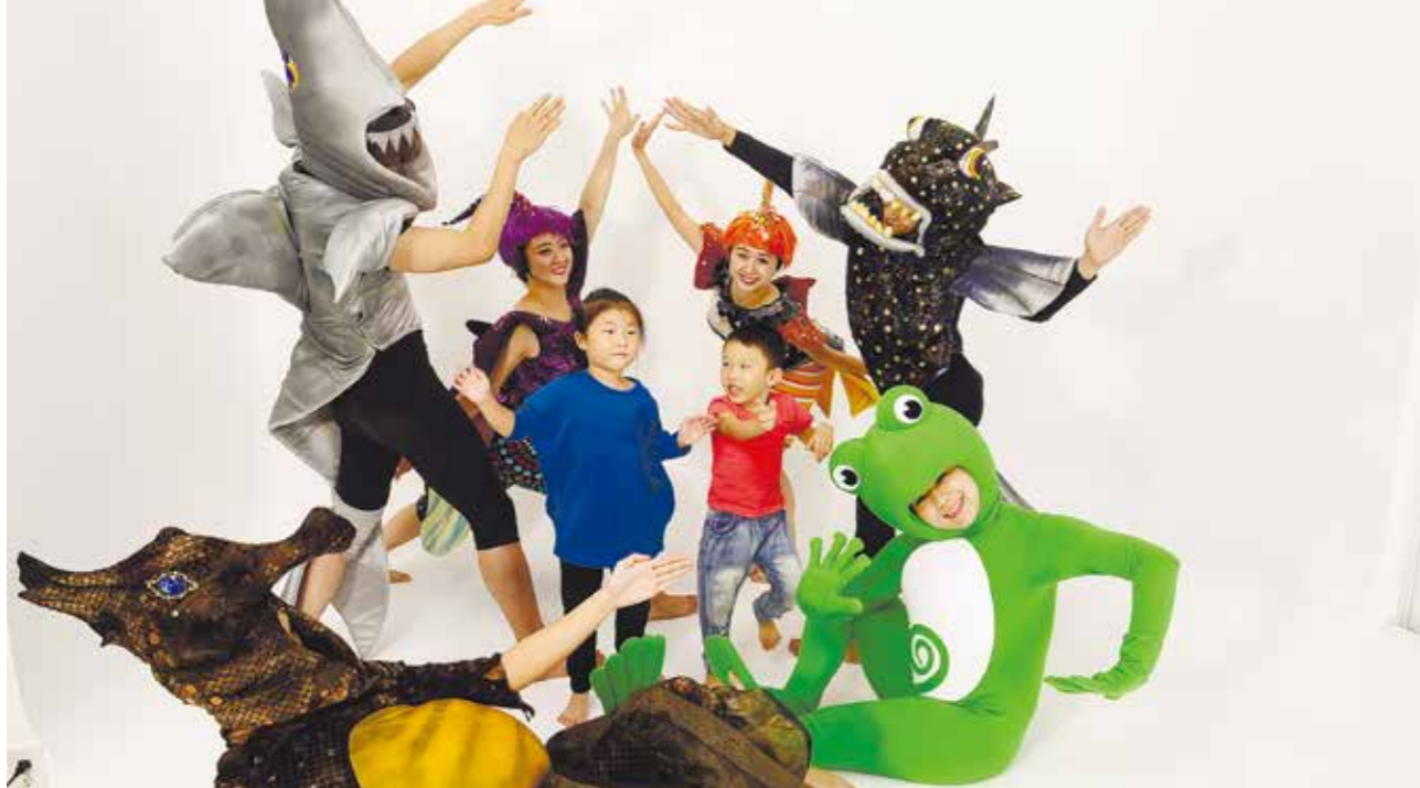
孩子藉由身體的探索玩出智慧