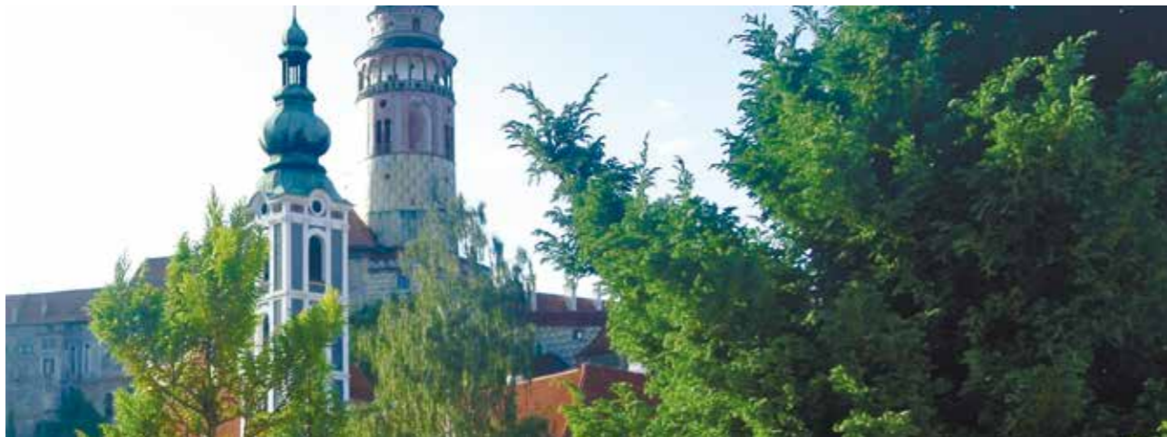
楊教授旅法多年，圖為法國巴洛克式建築。