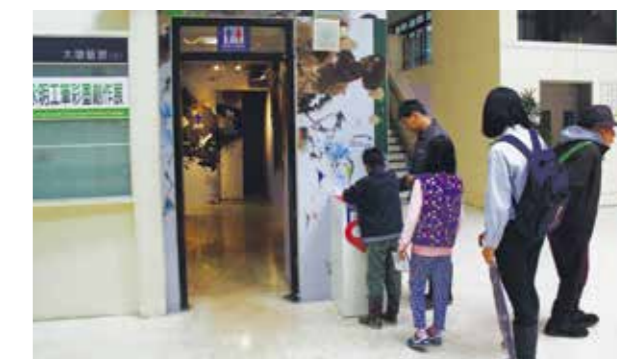
民眾參與大墩換新裝集章活動

大墩換新裝計畫，透過全新藝術裝置的妝點、典藏品的活化及生活化美學的具體呈現，經由各個「新藝點」巧思串連，結合成全新面貌，讓開館已 30 餘載的文化中心新意盎然。