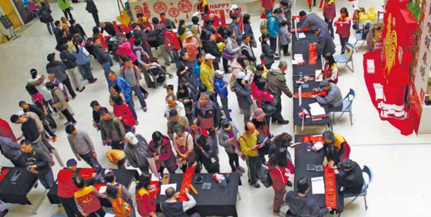
民眾在大墩文化中心排隊盛況