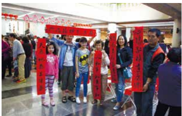
民眾滿心歡喜地展示春聯