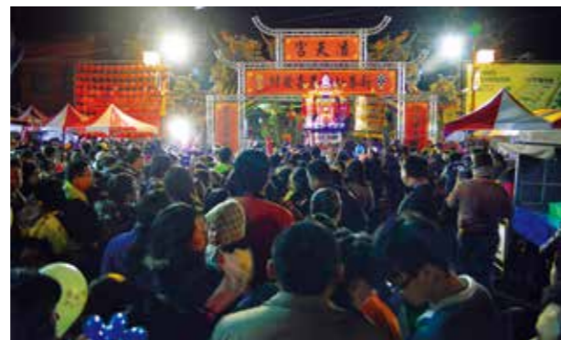
民眾依序排隊等著稜轎腳

品娘」歌仔戲，不僅演出古代女性的人生境遇，默娘與品娘這兩位媽祖的故事，更是迥然不同卻又相互呼應，在元宵節當晚，民眾靜心觀賞這訴說在地故事的歌仔戲演出，氛圍溫馨動人，也將地方的歷史記憶持續傳承。