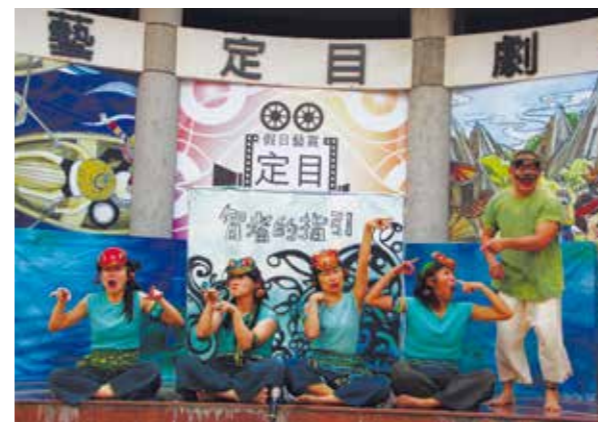
身聲劇場表演《在大水之中》，表演逗趣。

定目劇首場於2月19日起，由甫獲選參與「2017愛丁堡藝穗節台灣季」代表演出5個團隊之一的身聲劇場演出《在大水之中》，故事改編自布農族的神話傳說，劇中採用的素材有：戲劇、歌唱、器樂等，以不同的角度與土地生命連結，現場融合了多元的打擊樂器、肢體表現、面具、歌唱、傀儡與遊戲等，帶領觀賞者一起進入故事中。