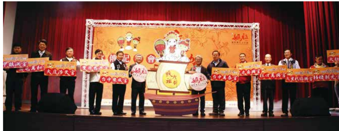
12 大宮廟的參與，讓臺中媽祖國際觀光文化節更添色彩。