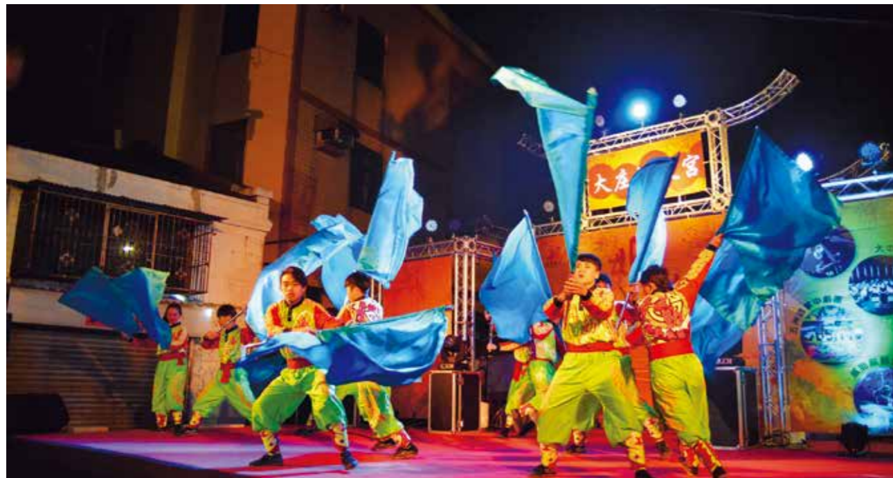
威勁龍獅武術戰鼓團博得滿堂彩

「二月瘋鑼鼓、三月痛媽祖」，臺中市政府文化局舉辦「2017 臺中媽祖國際觀光文化節—百年宮廟風華」系列活動，以臺中特色為基礎、年輕化為號召，自 1 月 31 日至 5 月 20 日邀請超過 40 組表演團隊，在全市 12 座百年宮廟熱鬧登場。