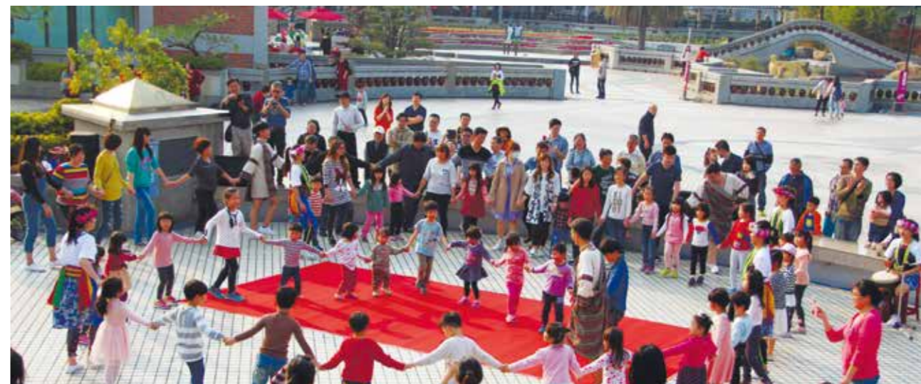
大小朋友隨著舞者一同共舞卑南族舞蹈

此外，臺上臺下的互動，更是打破了劇場中演出者與觀賞者的界線，跨領域現代劇場作品、明快易懂的戲劇節奏以及寓言式題材內容，深深地打動了現場所有觀眾。