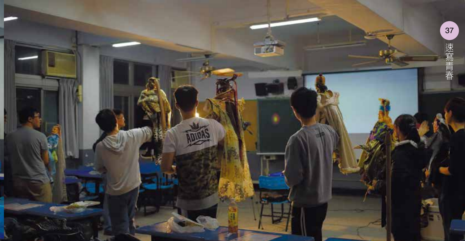
社員依序練習走位，再聆聽老師修改建議。