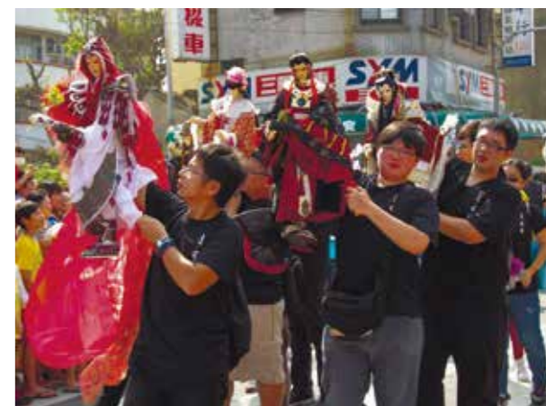
逢甲布研社應邀參加臺中花都藝術節

野台戲雖然傳統，但不代表不能賦予新生命。逢甲布研的同學發揮創意，導入日文歌、動漫或遊