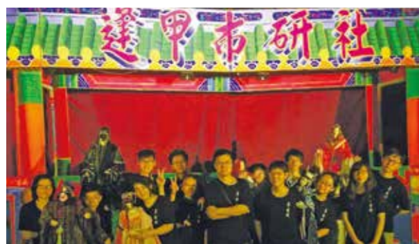
社員卯足全力準備每次成果發表