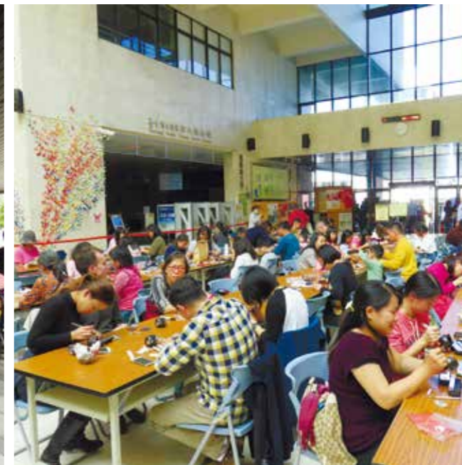
民眾享受 DIY 手作樂趣

天等民俗故事，也表演精緻偶劇與令人驚豔的腳底功夫—踢踏舞，不分老少、闔家觀賞。結合武術、擊鼓、舞蹈等元素的「優人神鼓」，1 月 31 日（年初四）一早以振奮人心的鼓聲於屯區藝文中心揭開序幕，下午則是由 Hydra 街頭劇場帶來超越人體極限的立方體雜技，一整日撼動人心的演出，讓民眾拍手叫好、意猶未盡。