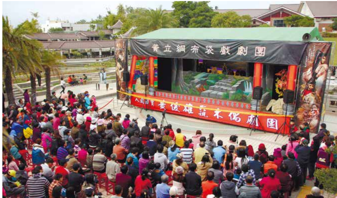
轟動武林、驚動萬教的黃俊雄布袋戲演出，現場人潮眾多。

為期 5 天的「2017 臺中市傳統藝術節」，於 2 月 1 日圓滿結束。今年的傳藝節系列活動，文化局過年不打烊，串連了大墩文化中心、葫蘆墩文化中心、港區藝術中心及屯區藝文中心同步舉辦，連續 5 天一系列精采的龍獅舞藝、民俗特技、音樂與舞蹈……等繽紛歡樂，活動期間也送出了 5,000 份傳藝紅包，吸引近 5 萬名臺中市民熱烈參與。