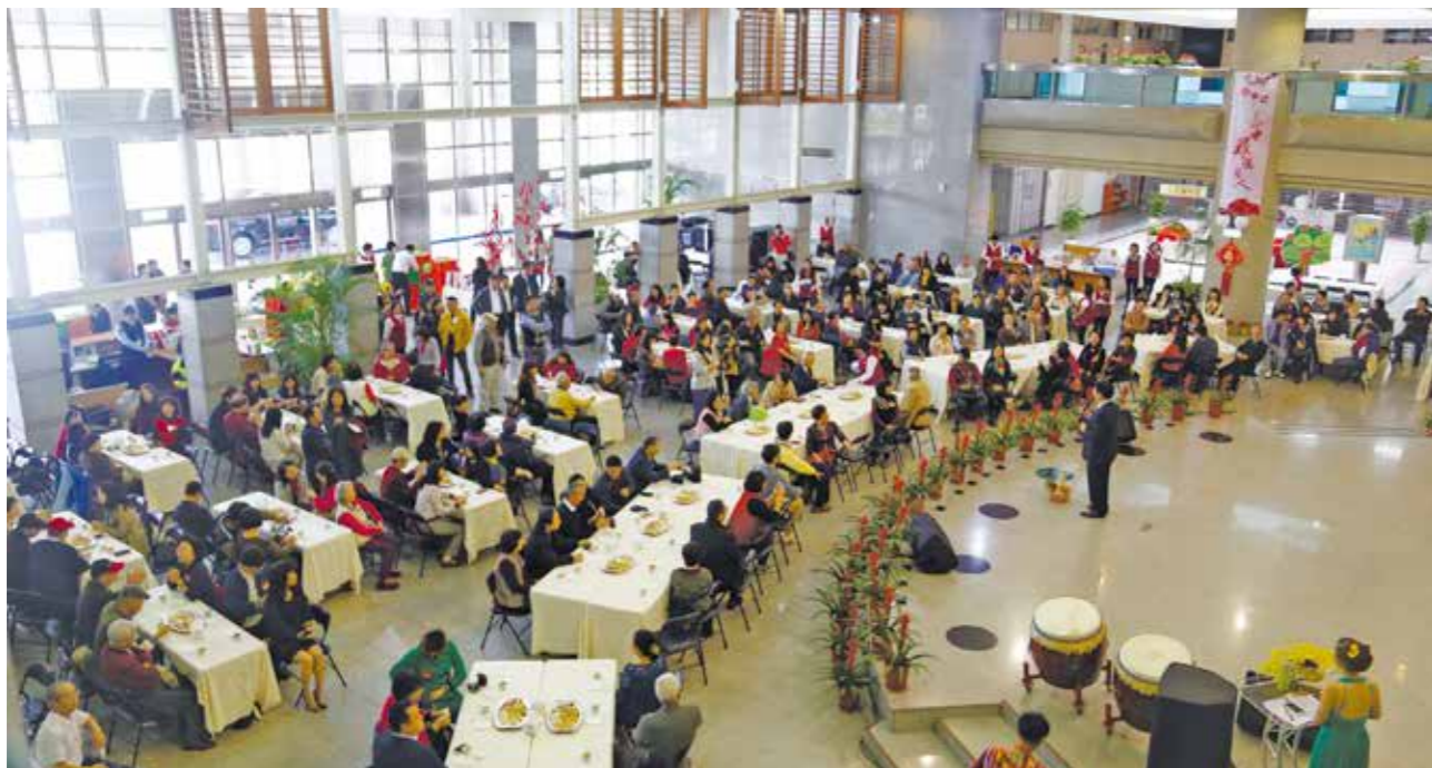
臺中市藝文界新春團拜，逾 260 位藝術家出席，場面熱鬧，圖為豐原陽明市政大樓現場。