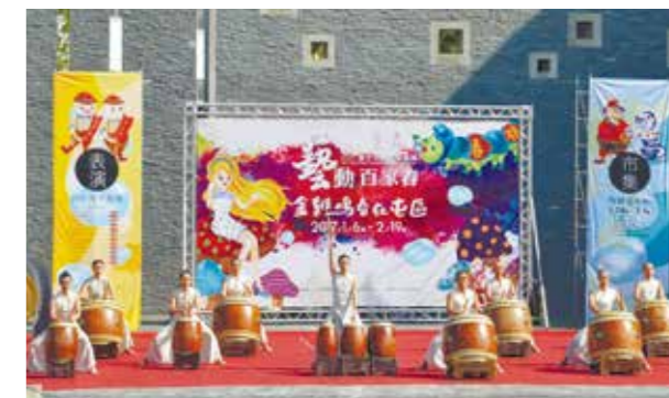
優人神鼓撼動人心的演出