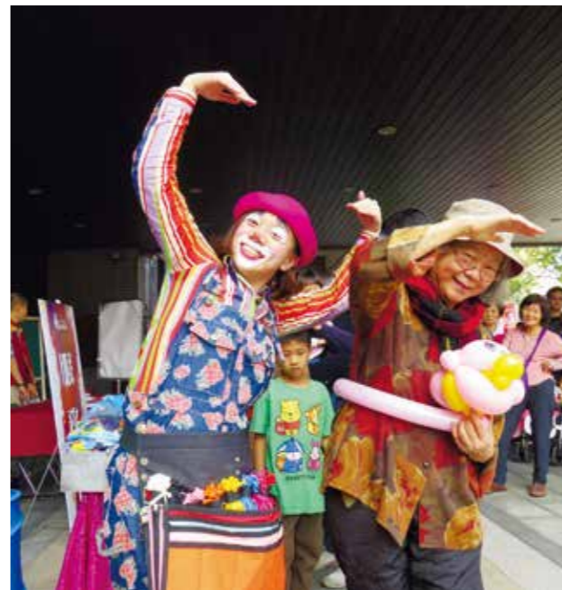
傳統藝術節讓大人小孩都開心

偶偶偶劇團與舞工廠踢踏舞團，分別於 1 月 29 日（年初二）及 1 月 30 日（年初三）在大墩文化中心以生動活潑的偶戲，演繹盤古開天與女媧補