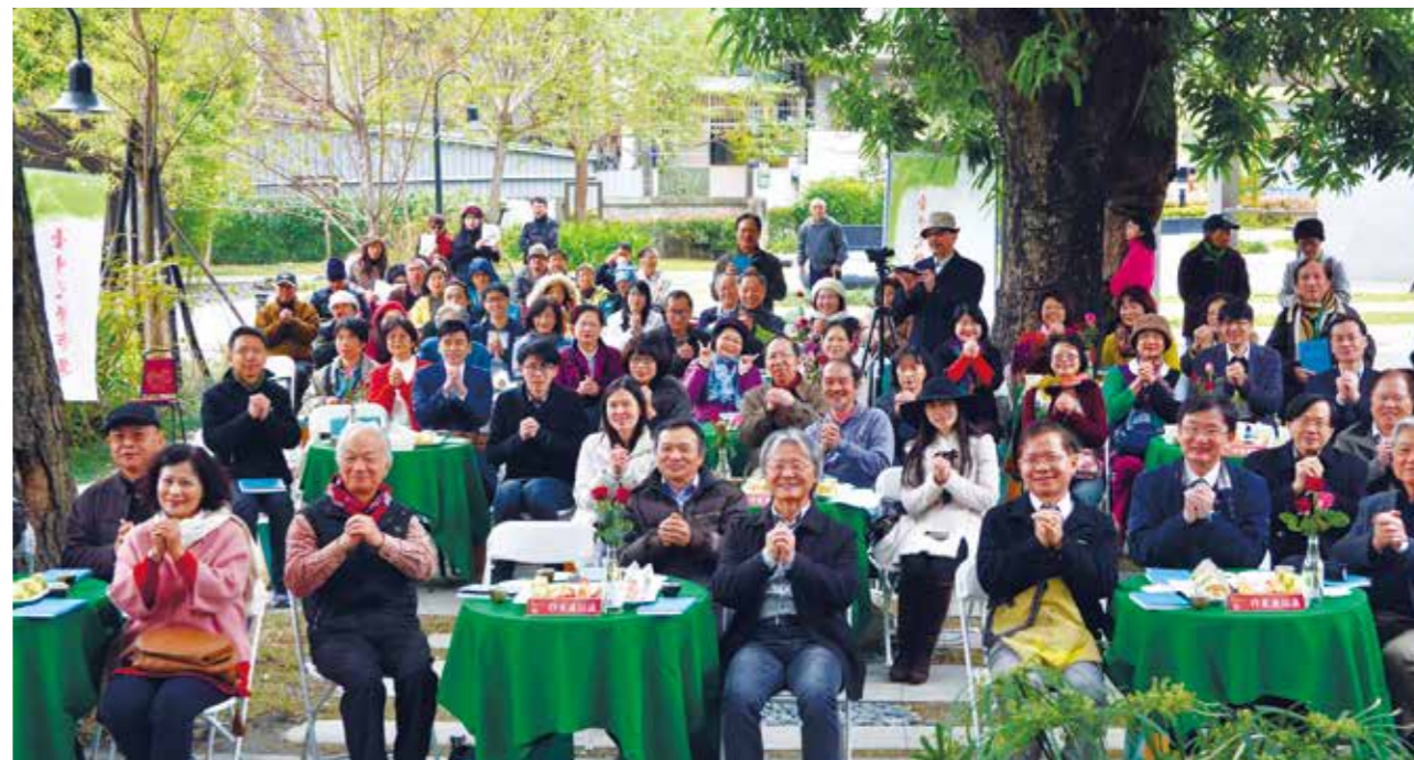
元宵節當日，近 60 位來自全國的臺中作家齊聚一堂賀新年，圖為臺中文學館現場。