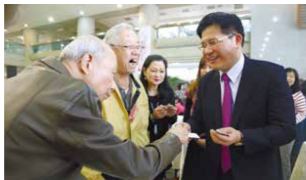
林佳龍市長與藝術家寒暄互動

林市長肯定文化局每年舉辦的新春團拜，是藝文盛會及優良傳統，並表示「文化是城市的靈魂，城市是文化的容器」，臺中因深厚的文化底蘊，入選為全球宜居城市及百大旅遊城市，近年更致力舊