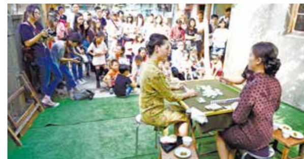
清水眷村文化園區曾舉辦多項活動，重現眷村風貌。

來到清水，除了走訪人文生態觀光景點，也別忘了名聞遐邇的清水美食—筒仔米糕、肉圓、擗麵、炸粿、韭黃等「清水名物」，風味獨特，簡單又實在；