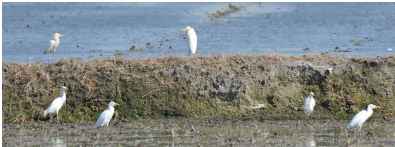
大安出海口擁有豐富的自然資源與生命力

漢人先祖在海線留下的文化遺產，還有昔日的文教中心—大肚磺溪書院。過去，書院招收在地子弟實施啟蒙教育，現在，書院磚工雕琢之精美，足以令人駐足欣賞，讚嘆再三；龍井的龍目井，相傳井水從一棵老樟樹根部自然湧出，水質清澈甘甜，旁邊有兩塊大石，形狀如同龍的眼睛，故而得名；另一座大甲鐵砧山上的劍井，由鄭成功部將以寶劍插地得甘泉，又名「國姓井」，如今鐵砧山風景區蓊蓊鬱鬱，涼爽自在，十分適合闔家踏青同遊。