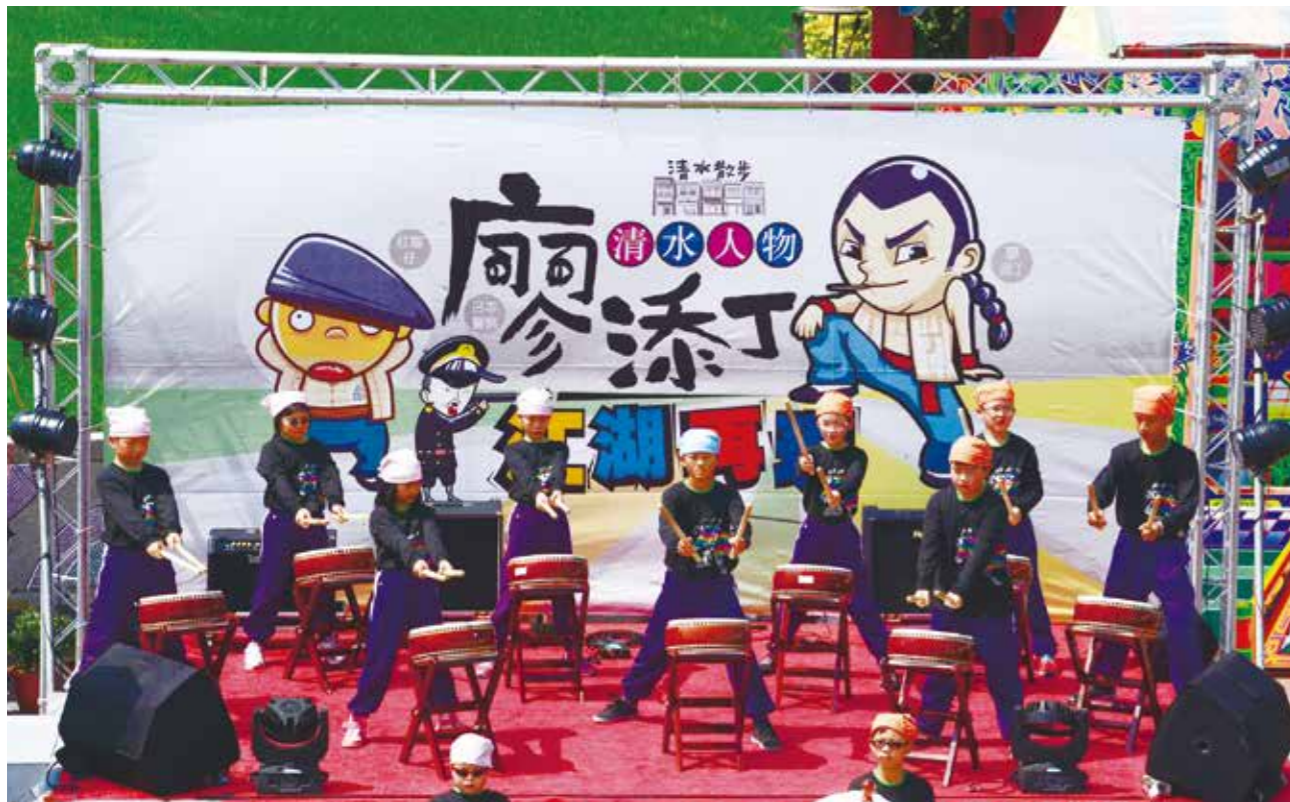
廖添丁俠客文化節是清水地區的年度盛事，當地亦經常舉辦廖添丁主題活動。

文 / 紀肇聲（臺中市牛罵頭文化協進會常務監事）