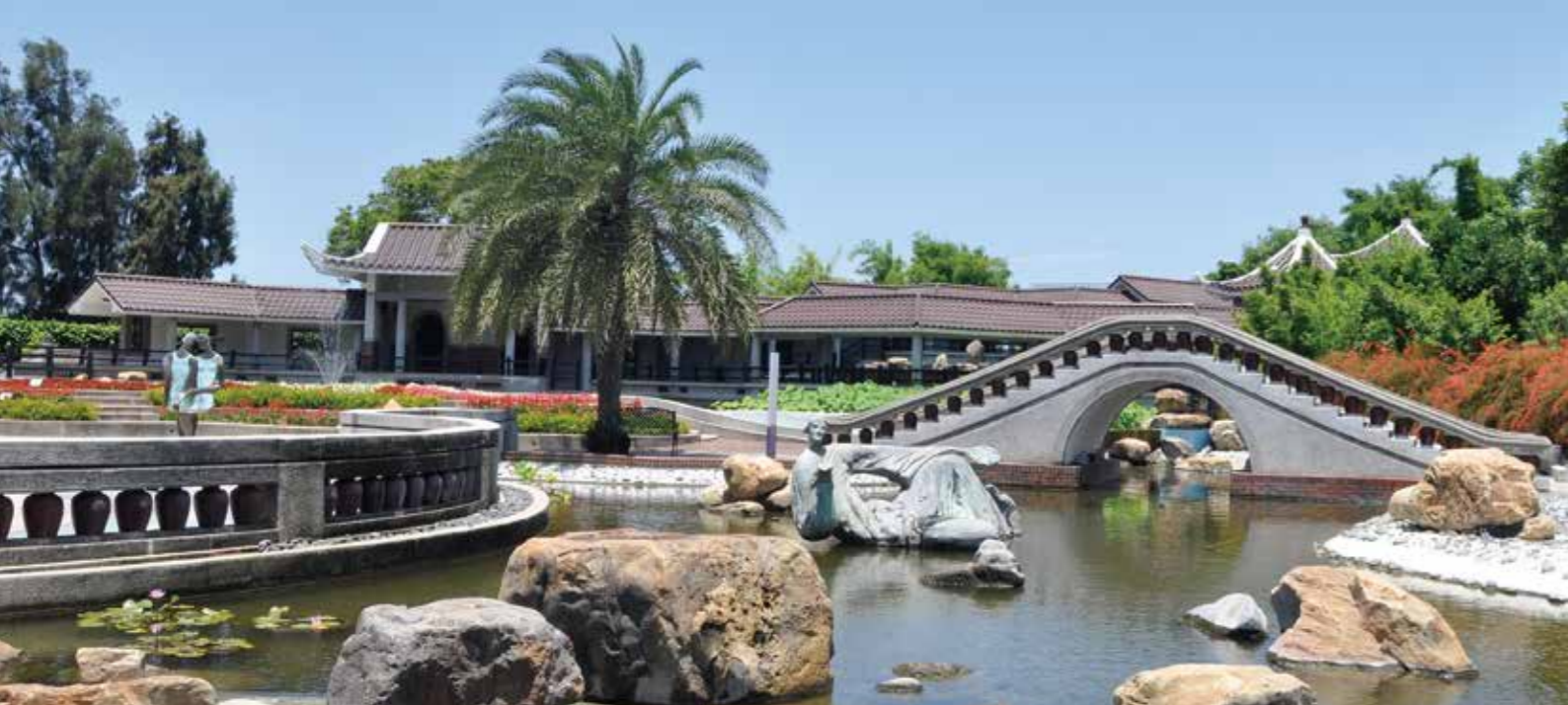
港區藝術中心為海線人藝文休閒的好去處