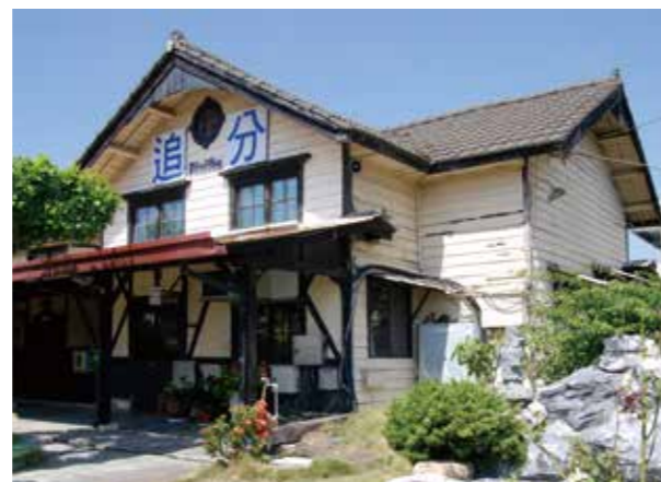
追分車站因販售「追分—成功」車票而聞名