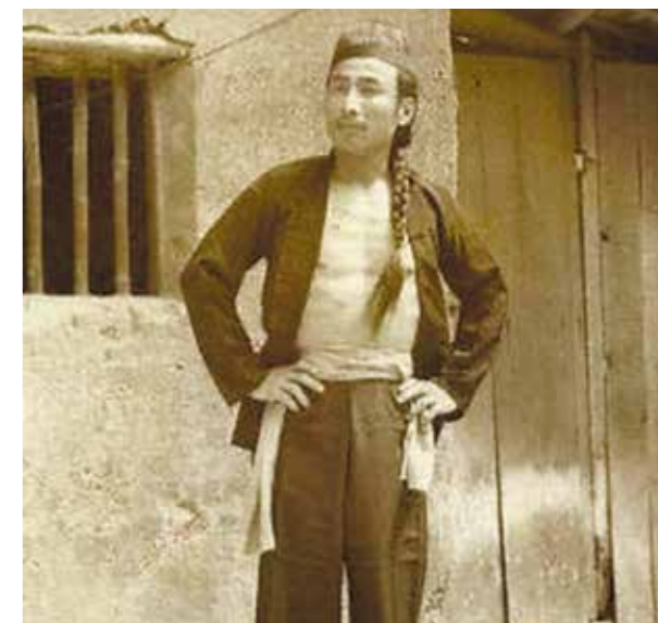
廖添丁留下許多劫富濟貧的俠義事蹟，成為臺灣家喻戶曉的傳奇人物。