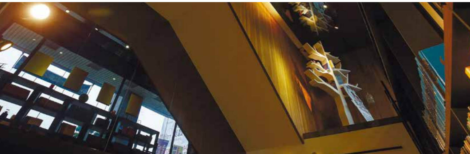
書房的裝潢設計相當別緻獨特