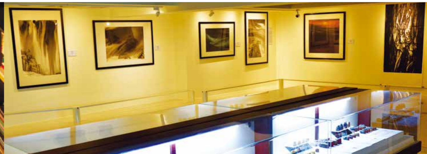
免費、小型、安靜的展場，有別於大型美術館的喧囂。