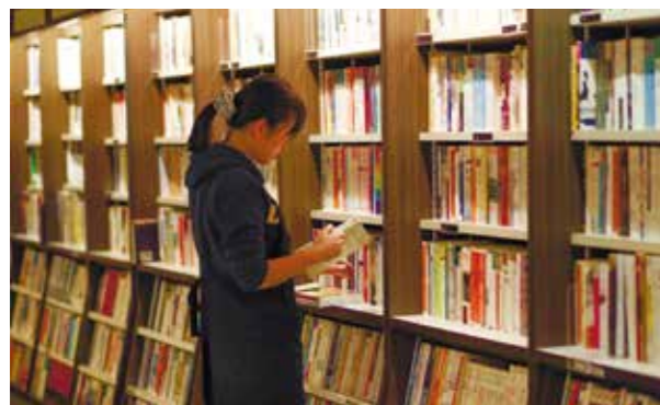
茉莉二手書房的書籍排列清晰明瞭

書店強調販賣書籍，而茉莉則是著重於「環保、公益、閱讀」，蔡總監一路以來的信念皆是如此。