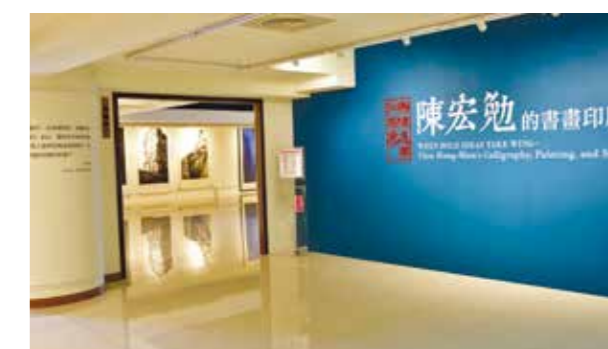
展覽著重於呈現藝術家的人生奮鬥歷程

對中心的志工導覽員而言，致力於藝術推廣比什麼都重要。行之有年的「行動美術館」，2016 年共走訪臺中 333 所小學及中學，播放教材影片，由導覽員或大師本人與學生交流互動，將藝術種子播撒在莘莘學子心田；此外，這裡也是臺中市藝術亮點及文化專車的參訪點之一。