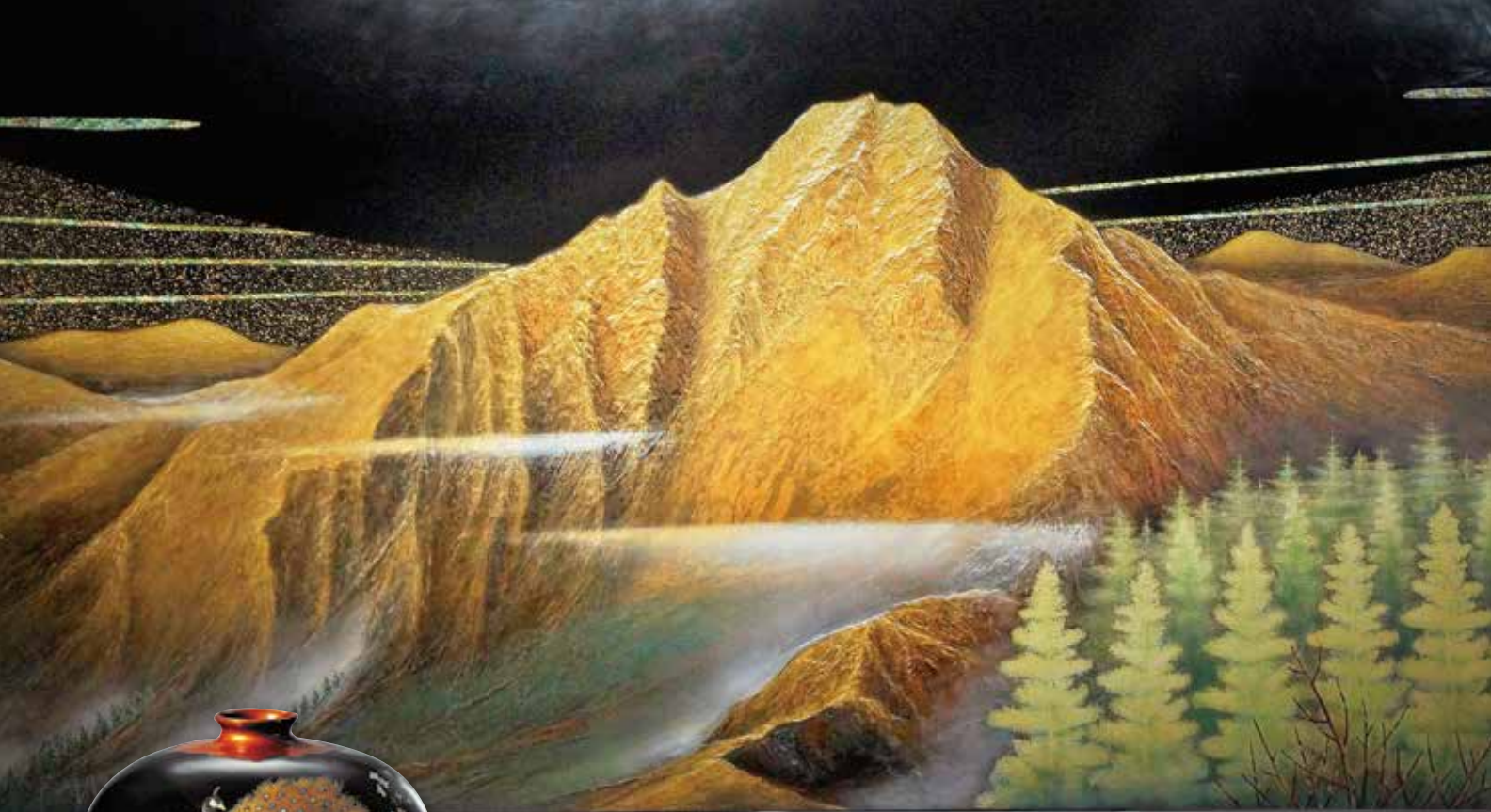
王清霜 82 歲登玉山，長時間觀看才完成漆畫〈玉山〉。