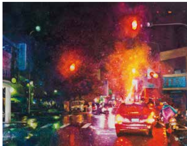
梁軒瑜的大學畢展作品〈午夜霓虹〉，現由國立臺中教育大學典藏。

受寫實畫風影響，梁軒瑜在中學時代的創作主要分為兩方面，一者以關懷社會並表達對社會想法為出發點，另一者則描繪兒時記憶。因此，長者、時下熱門的議題以及小朋友在巷弄中奔跑的情境等，都被她深刻入畫，也是此時確立了往美術發展的志向。