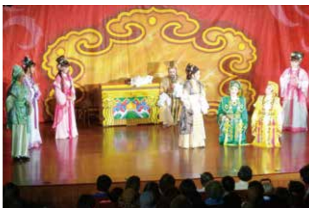
《十里桂花香》歌仔戲表演展現各學員一年來努力成果

「台灣微笑樂團」積極推廣唸歌文化，以新創作、跨界模式重新詮釋唸歌，讓唸歌在國際舞臺發光；「水溝蓋樂團」則是國內少數橫跨主流與獨立市場的新興樂團，曲風分明且多樣，涵蓋金屬、說唱、搖滾以及英華語流行等，以流行音樂為主軸，對於流行歌曲皆有相當程度的掌握。