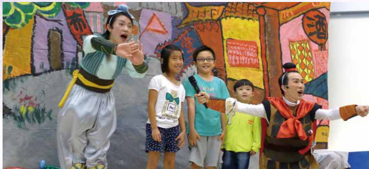
演員邀請小朋友上臺一起表演，小朋友笑不攏嘴。

回到家已經一個半小時，兩個孩子還是不斷地跟我討論著剛剛的大開劇團兒童劇《花木蘭》，說她們要把剛剛在戲裡面發生的事情，寫在聯絡簿上的日記。