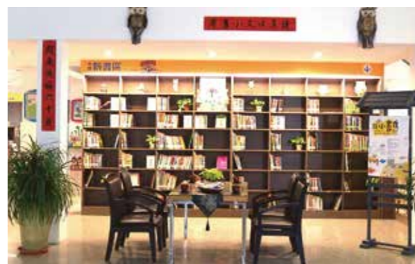
霧峰以文分館小書房

色，如大安的客廳書房、后里的薩克斯風書房、沙鹿之春書房、梧棲的小樹窗書房、葫蘆墩的創意設計書房、新社的戶外庭園書房、大里的家庭書房、太平的傳承書房、霧峰的讀享書房、烏日的樂活書房、東區的懷舊書房及北區的餐飲特色書房等。閱讀書房配合主題書展、氛圍及傢俱佈置，讓民眾就近參觀各圖書館的創意。