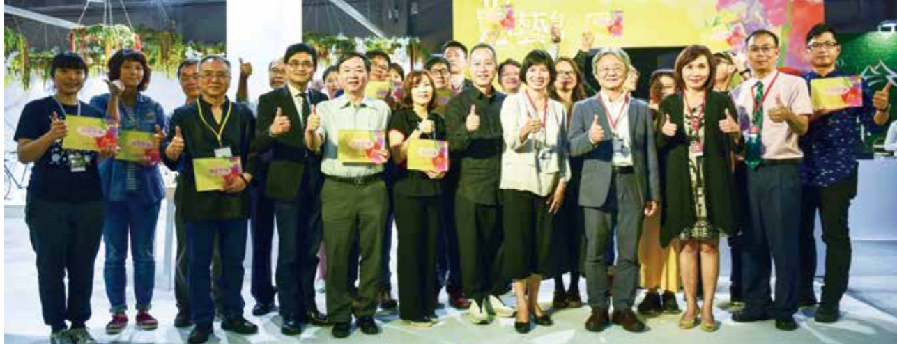
因為 20 家廠商的參與，臺灣文博會臺中館大成功。