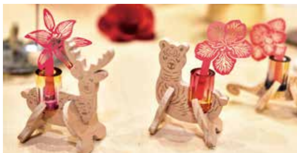
大視設計 MarkTaiwan 系列展品具中國風味