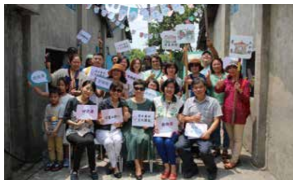
原眷戶與來賓手持關鍵字，回味眷村點滴。