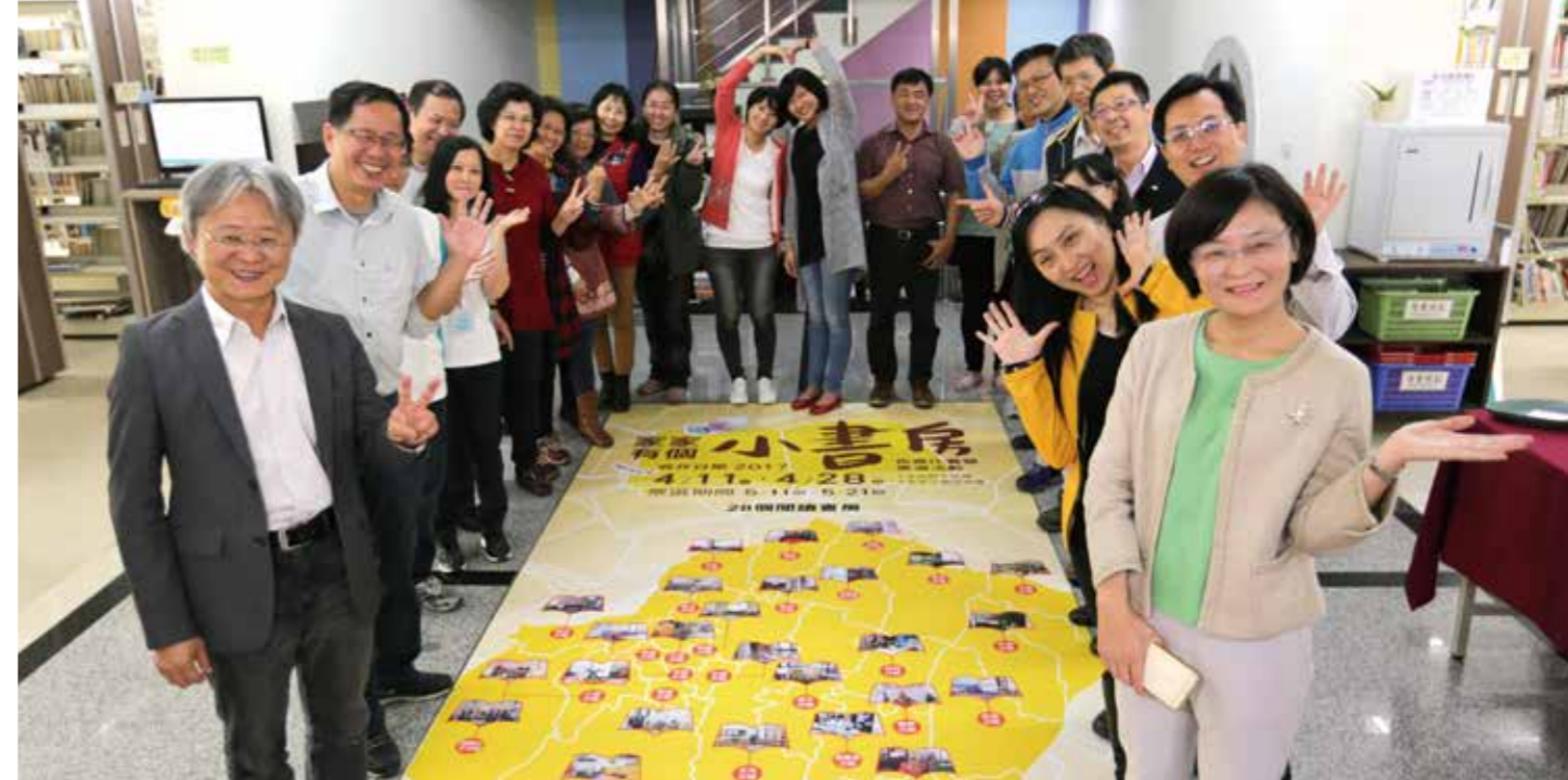
臺中市圖 28 間分館響應家家有個小書房活動，佈置溫馨閱讀環境。