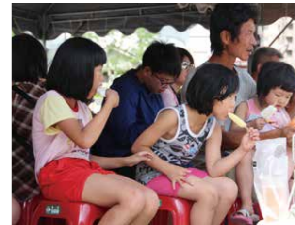
大家一邊吃冰棒，一邊看表演，好不快樂。

葫蘆墩文化中心在當天下午安排街頭藝人暖場表演，裝扮成小丑的氣球達人定點發送造型氣球，趣味層出不窮，留下美好記憶。搭配文創雜貨、小農市集、扭蛋親子彩繪 DIY、打卡按讚送野餐墊等活動，演出時發送枝仔冰，讓民眾置身沁涼舒爽的初夏氛圍，融入金光布袋戲迷人的聲光情境空間，享受這場端午節慶與地方文化內涵兼具的藝術饗宴。