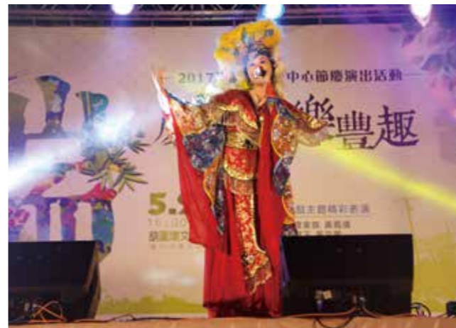
真人布袋戲 cosplay，服飾精緻吸睛。

而大墩文化中心則是與弄藝坊研習班成員經過一年共同努力，於端午連假期間，為民眾獻上優質好戲《十里桂花香》。活動當天，在金曲小旦李靜芳老師指導下，《十里桂花香》用新生代的音樂設計、別出心裁的曲調和唱段、戲曲新鮮人不斷磨練的唱念和作戲，讓大墩文化中心演講廳座無虛席；參與觀眾的熱情掌聲，也充分說明他們感受到的歌仔戲的十足魅力。