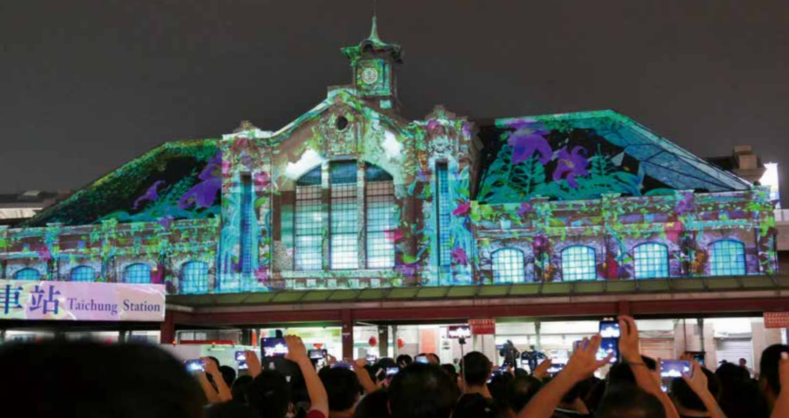
光影藝術節 3D 光雕秀震撼感官神經