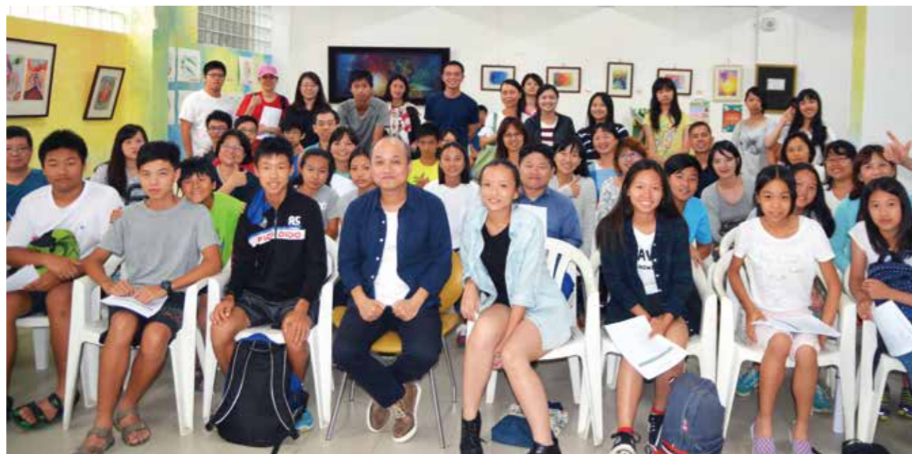
鄭文堂導演的演講深受國、高中生喜愛。

「百師入學」邀請各領域專家學者赴學校、圖書館演講，每年滿意度皆達 8 成，今年「百師入學」於 4 月登場，舉辦地點將擴展至全市 29 個行政區，而舉辦場域原為各區圖書館、4 大文化中心、臺中文學館等，本年度更延伸至監獄、醫院、讀書會、社區大學及獨立書店等，講師皆為各領域菁英，讓百師入學每年都能吸引上萬民衆參與。