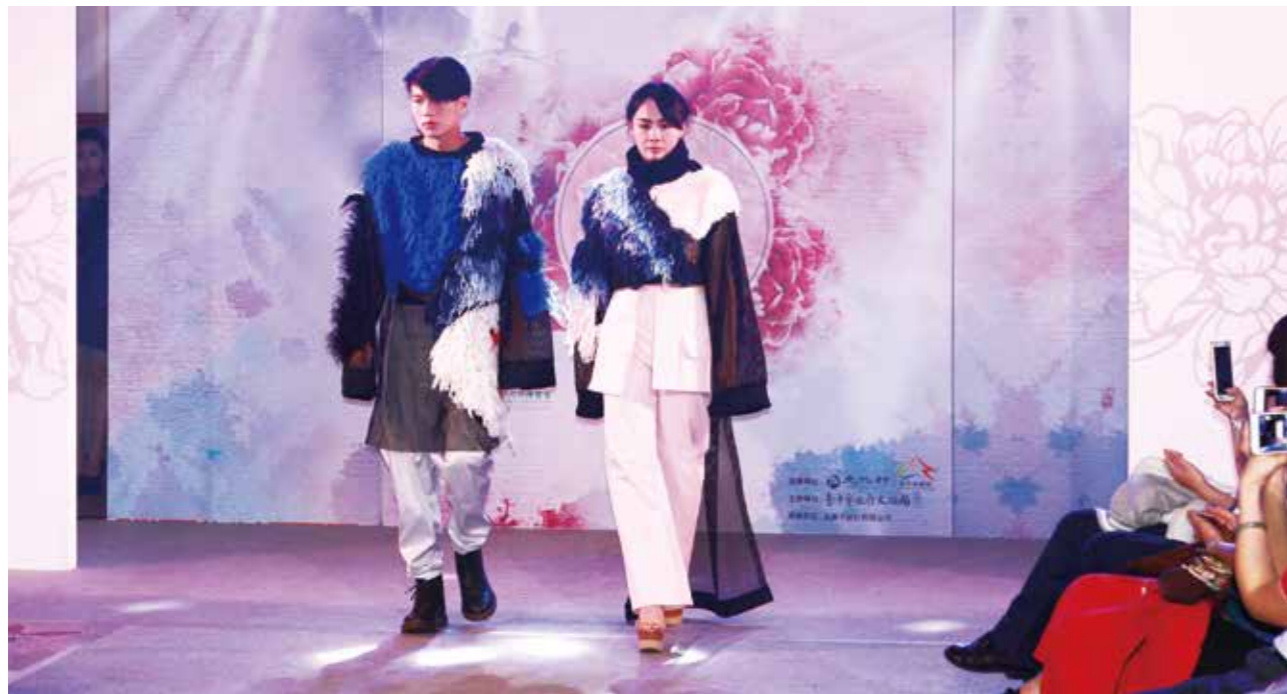
學生擔任走秀模特兒，透過肢體詮釋設計理念。