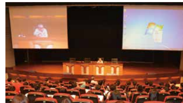
李喬大師開講，吸引許多莘莘學子聆聽。

6 月 9 日邀請單親兒童文教基金會創辦人黃越綏造訪臺中監獄，主講「面對生命轉彎處」，今年春天正好滿 70 歲，見過人生百態的她，正好以豐富經