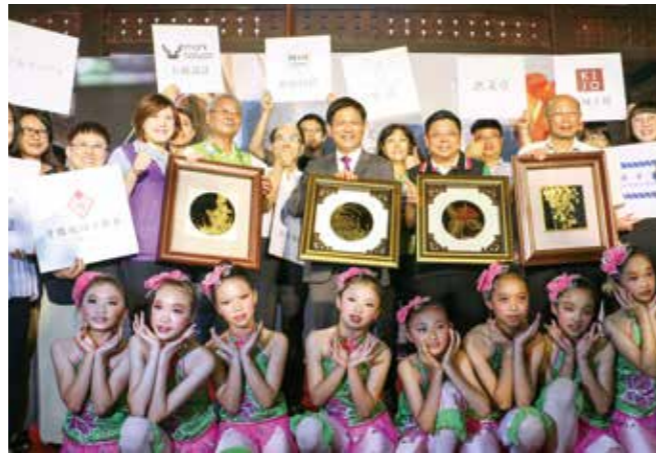
花現臺中生活工藝展為明年的花博熱身

巧聖仙師文化祭—花現臺中生活工藝展 5 月 19 日至 5 月 28 日於東勢客家文化園區熱鬧開展，嚴選 20 組臺中傑出工藝職人，展出 4 大主題工藝生活器具，並與豐原漆藝館合作，展出漆藝產學成果作品，除推廣漆藝與生活工藝結合，也為 2018 臺中世界花卉博覽會暖身。