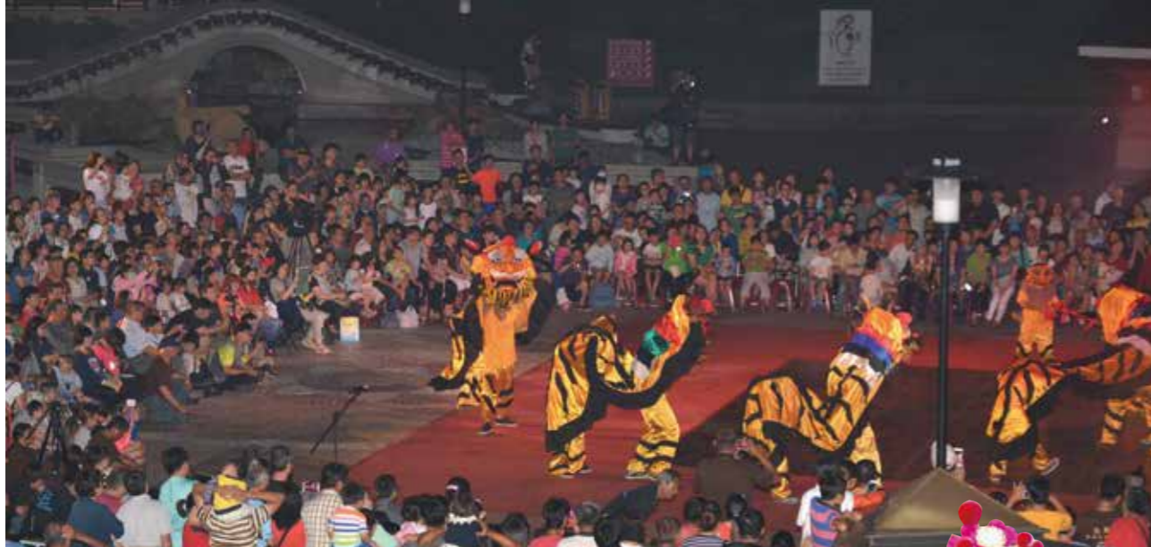
五虎將陣，祝福觀眾平安順利。