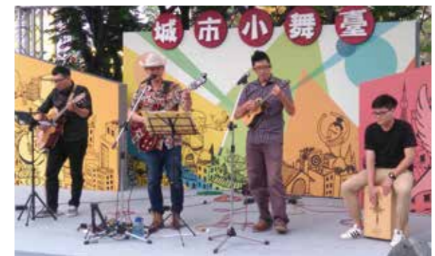
「愛德華烏克麗麗」盡情彈唱演出。

對大墩文化中心城市小舞臺演出有興趣的藝人，可上「大墩文化中心網站 / 便民服務 / 表單下載」查詢活動須知，歡迎有興趣藝人踴躍申請！