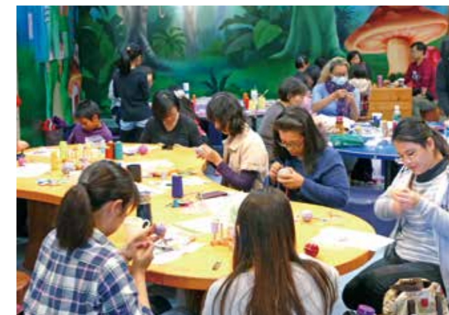
纖維主題工作坊提供民眾動手 DIY 的機會