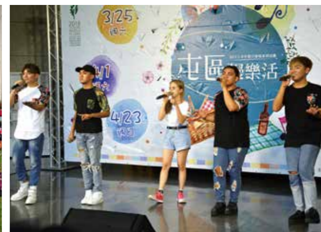
扶桑花樂團和 I-WANT 星勢力成員一同高歌經典歌曲

每場次15:00至15:30都有街頭藝人帶來精采暖場表演，從大鐵環到古典吉他演出，各式各樣街頭藝人齊聚在屯區藝文中心，以令人目不轉睛的暖場，使民眾更加期待正式登場的團隊。從春暖花開的3月到帶著微微暑氣的5月，屯區藝文中心上半年假日廣場已圓滿告一段落，下半年假日廣場將於10月登場，敬請期待！