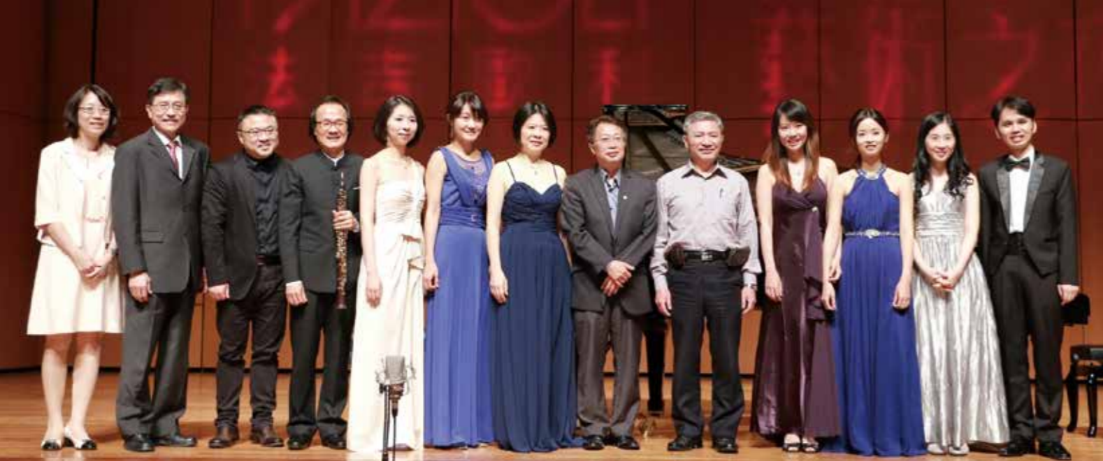
眾音樂名家齊聚中山堂，瀟灑美妙樂音。