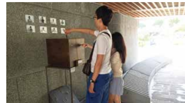
城市遊戲帶領玩家走訪舊城區特色店家及景點，圖為柳川關卡。

註：《拼湊的記憶》為藝術家劉哲榮創作之雕塑作品，榮獲得第14屆大墩美展大墩獎，現由大墩文化中心典藏。