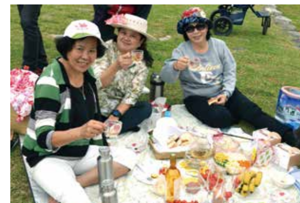
親手佈置野餐，其樂無窮。

出，期間正逢母親節前夕，現場發送100朵康乃馨給予辛苦的媽媽；5月21日則由臺灣青年管樂團銅管五重奏和優樂國樂團攜手演出中西經典樂曲，兩個團隊都是今年度臺中市傑出演藝團隊，技巧精湛，讓現場民眾在這壓軸場次中感受到了臺中表演藝術發展的無限可能。