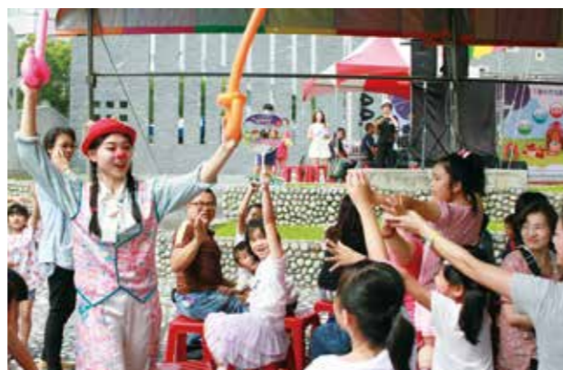
圓劇團與現場民衆互動熱絡，笑聲不斷。

本系列活動在 6 月 4 日晚上 7:30 由蘋果劇團帶來的經典好戲《勇闖黑森林》，該劇為全臺第一場英文歌舞劇。今年的親子藝術節不只有兒童劇，更邀請表演藝術界經驗豐富的師資，以舞蹈、戲劇、布袋戲等不同主題，規劃互動教育課程，讓參加的小朋友享受藝文之餘，爸爸媽媽也能學習，促進親子和諧，未來希望吸引更多家庭參與！