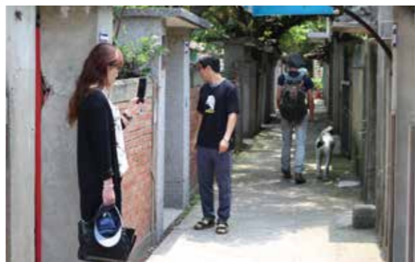
漫步園區，感受前人在此的生命記憶。