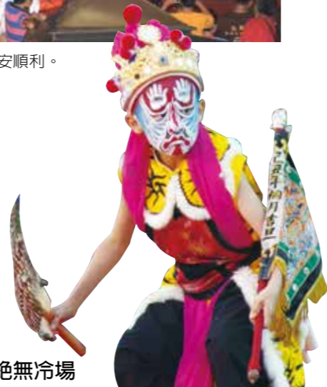
新藝芳歌劇團的 《家將獻藝》

臺中法天壇民俗將坊是臺中最具特色精緻藝術臉譜的家將團；兩廣拳兒醒獅團則帶來少見的京鼓及醒獅跳椿；威勁龍獅舞術戰鼓團以夜光龍騰耀星空；臺中大肚山同仁堂國術獅藝館臺灣獅與精讚武術展演真功夫；首次加入陣頭匯演的新藝芳歌劇團安排了家將獻藝以全新臉譜開臉上陣；旭陽民俗車鼓劇團的車鼓陣與牛犁歌是媽媽們的最愛，也是本次演出唯一的外縣市團隊。