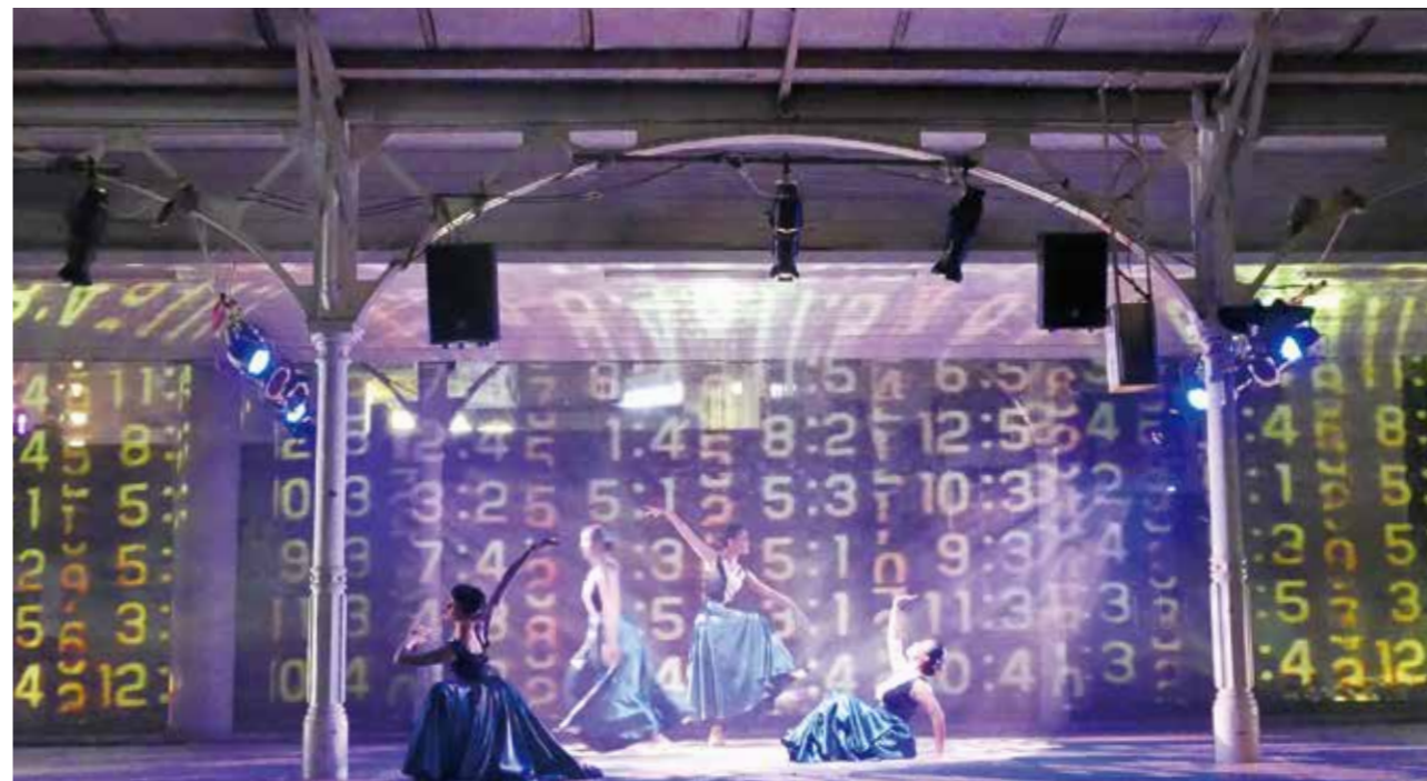
光影劇場氛圍獨特，帶領觀眾感受奇幻的臺中百年之旅。

承載著眾人記憶的車站在2017年卸下百年來的重擔，為了慶祝車站百歲，文化局特別與臺鐵局攜手合作，打造百年一次的震撼3D光雕秀《浮光·花弄影》，為舊車站建築畫上美麗的妝容，以三個段落述說臺中百年記憶，從第一、二代車站落成的記憶開始，透過古典詩詞文字，以流動線條為視覺效果；再以火車站為起點，沿著臺灣大道出發，輕快地帶領觀眾踏上新舊交替的時光旅程，看見臺中美麗夜景；最後則以2018臺中花博花卉光影，包覆並療癒觀者的心靈，提醒我們記得停下來省視身邊的美好回憶，並