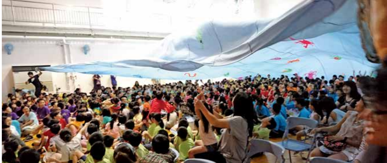
蘋果劇團的校園巡演帶來精采好戲