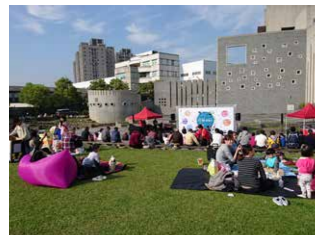
民眾欣賞假日廣場演出，洋溢歡愉氣氛。

4月23日起，活動場地移至茄苳樹區，由龐克搖滾「怕胖團」與動益科大熱音社帶來熱血搖滾音樂會，藉此讓學生社團與搖滾樂團交流且互相成長，民眾亦與樂團互動熱絡；5月13日則是扶桑花樂團以及 Choco Lava 人聲樂團帶來優美人聲演