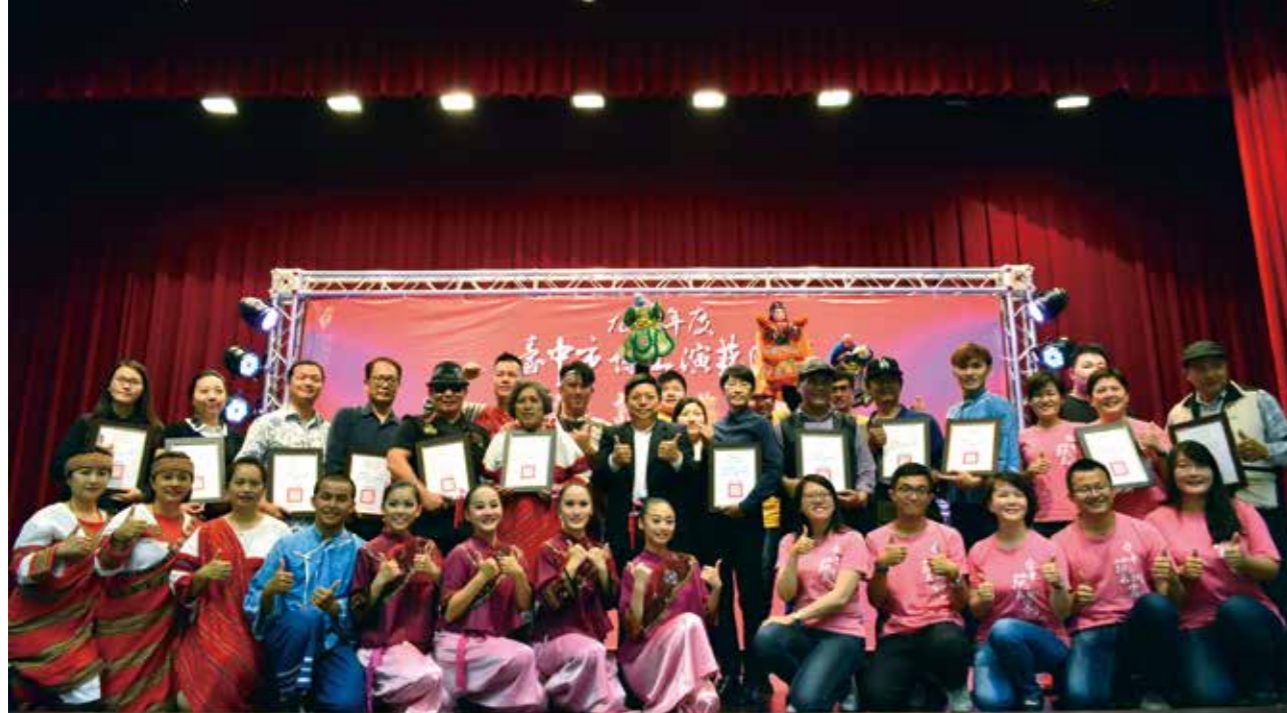
臺中市傑出演藝團隊齊聚一堂，展現豐沛藝文能量。