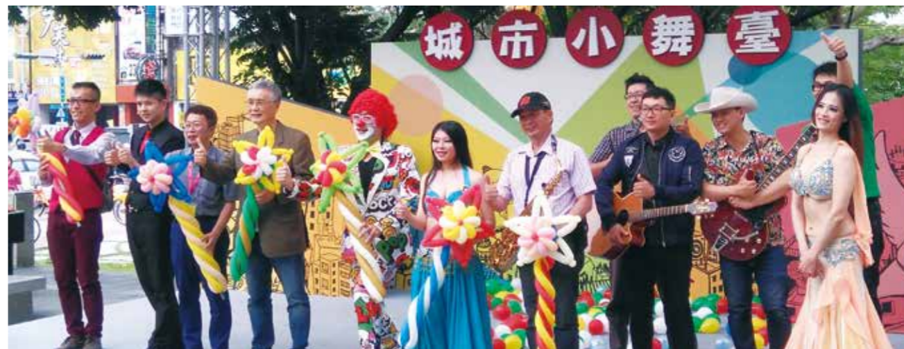
4月23日城市小舞臺正式啓用，演出者與街頭藝人共襄盛舉。

2017 年 4 月 23 日下午 3 時，涼風徐徐，大墩文化中心戶外親子廣場流洩著沁人心脾的樂音，在這一時刻，城市小舞臺正式啓用了！開場的汽球瀑布特效、小丑變出一支又一支小雨傘，肚皮舞孃如波浪般律動搖曳生姿，隨後，〈海闊天空〉、〈愛情釀的酒〉旋律響起，街角駐足的人群跟隨著舞臺上的藝人高聲唱和，這樣的街角浪漫，是臺中生活首都的真實寫照。