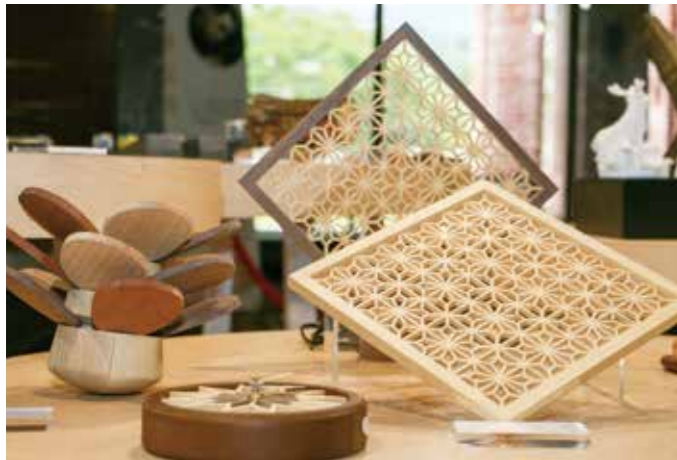
木匠兄妹展出細緻的木製工藝品