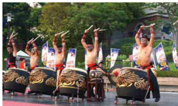
九天戰鼓開場演出充滿力與美

整場 120 分鐘的表演十分超值，原汁原味的各式文、武民俗陣頭，從 5 歲到 95 歲都愛看，搭配現場舞台燈光特效，帶來最震撼的視覺饗宴。