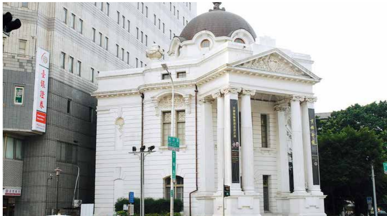
臺中市役所矗立超過百年，是臺中第一棟鐵筋混凝土建築。

為活化再利用珍貴的文化資產，臺中市文化資產處首度推出旅遊護照「臺中市古歷建藝遊趣」，集結已委外營運及標租的 6 處古蹟及歷史建築，即日起，民眾每參訪一處可蓋章，集滿 6 處徽章可獲文資處紀念品及館舍好禮。民眾可到各館舍及 4 大文化中心（葫蘆墩文化中心、大墩文化中心、屯區藝文中心及港區藝術中心）索取這本旅遊護照。