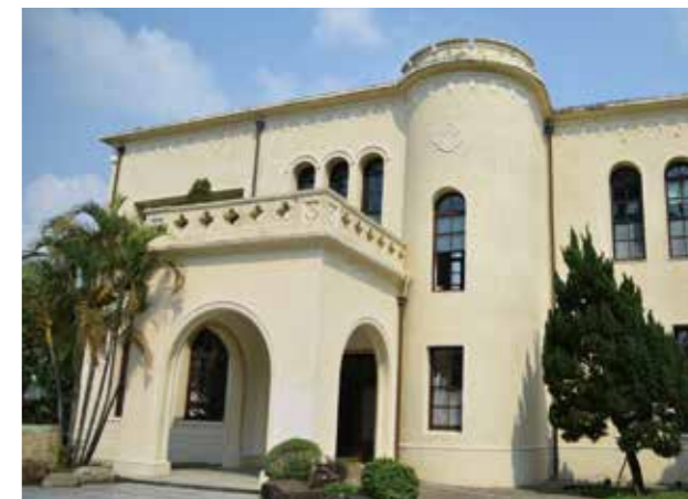
臺中放送局於日治時期曾是中部地區重要的廣播據點

臺中放送局在空間規劃上，將機能相似的空間分區集中且利用中央廊道串聯，滿足現代建築機能性導向的佈局方式，在建築藝術風格上，以「仿羅