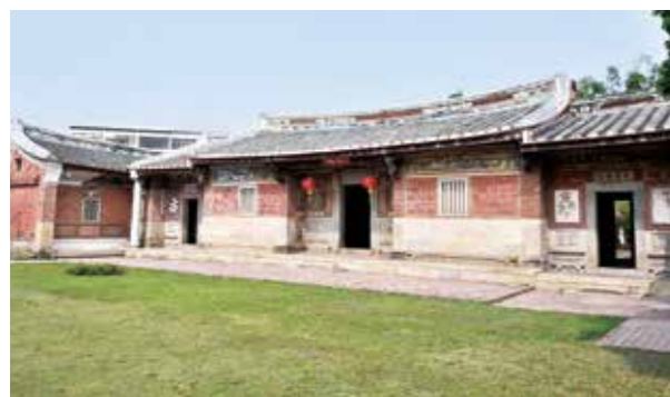
摘星山莊曾被票選為臺灣十大民宅之首

為活化再利用珍貴的文化資產，臺中市文化資產處首度推出旅遊護照「臺中市古歷建藝遊趣」，集結已委外營運及標租的 6 處古蹟及歷史建築，即日起，民眾每參訪一處可蓋章，集滿 6 處徽章可獲文資處紀念品及館舍好禮。民眾可到各館舍及 4 大文化中心（葫蘆墩文化中心、大墩文化中心、屯區藝文中心及港區藝術中心）索取這本旅遊護照。