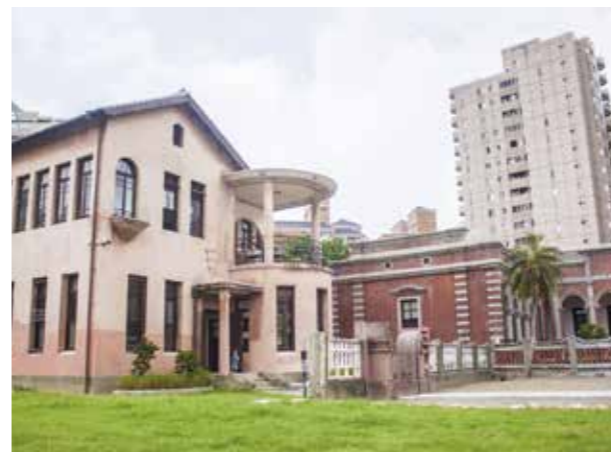
林懋陽故居匯集閩式、和式及西式洋樓風格。

歷史建築「臺中市役所」建立於 1911 年，至今矗立已超過百年，是臺中第一棟鐵筋混凝土的建築，並與總統府的「辰野式」相同建築風格。臺中市首任日籍市長金子惠教即在此宣誓就任，因此臺中市役所可說臺中市的正式誕生地。歷經百年歲月，臺中市役