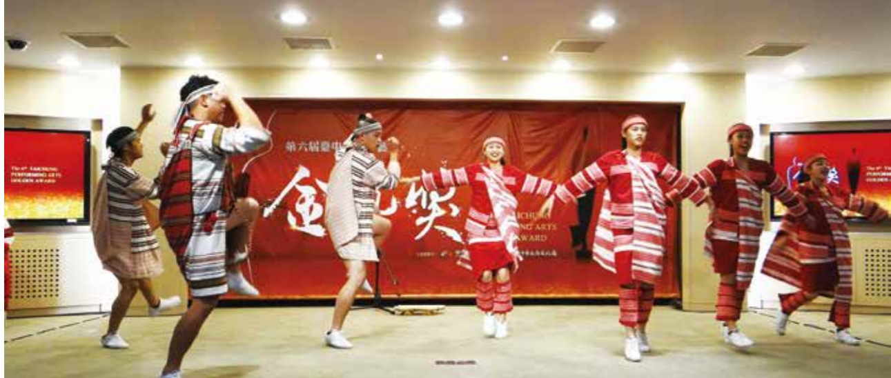
泰雅原舞工坊開場演出，充滿原民活力。