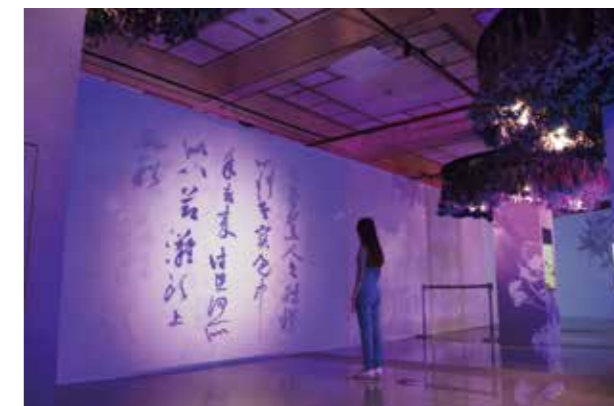
花氣薰人互動裝置，靠近牆面時，中央的花草剪影瞬間幻化成書法墨跡。

此外，展場提供 DIY 和教育推廣活動，民眾可 cosplay 扮成文人雅士，體驗古代文人搖扇的風雅氣息。主辦單位亦規劃偏鄉及鄰近學校社區推廣活動，舉辦種子教師工作坊，並補助 20 所偏鄉中小學師生參觀展覽。