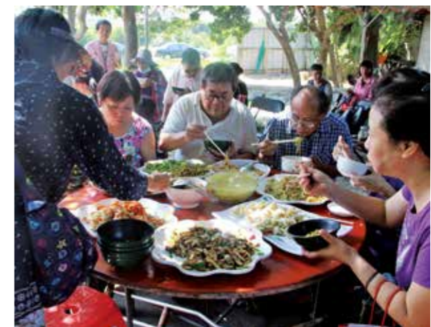
「眷村菜體驗」端出好料，享用美味的眷村美食。