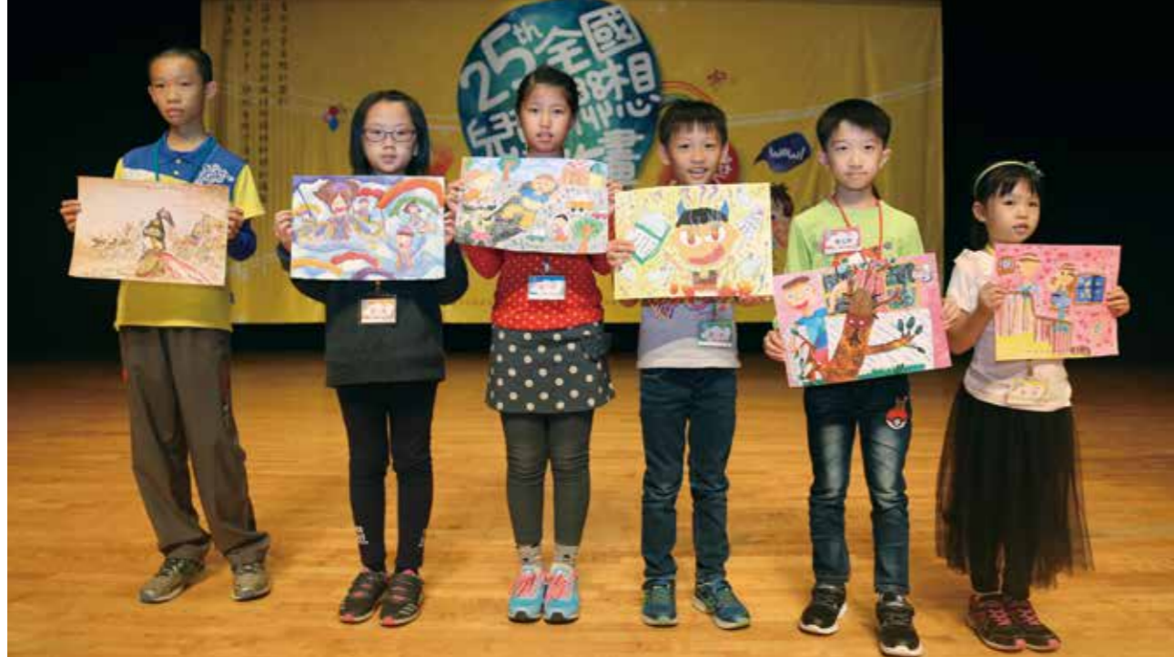
第 25 屆六年級至一年級的第一名得主（由左至右）。