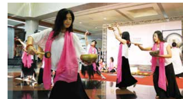
開幕式獨具特色的舞鉢表演

如同本展覽於2017年10月1日開幕式上，林依瑩副市長提到，中部地區的大甲東陶、沙鹿陶由來已久，陶藝相關創作能量非常豐沛，期望結合更多民間力量，再創臺中陶藝發展的輝煌篇章。