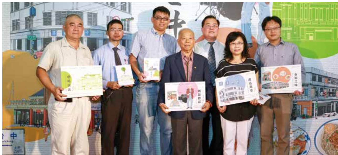
「臺中學」特選火車站等多元主題細述臺中百年風華，圖為五書作者群。

第二輯臺中學5本叢書分別為《驛動軌迹：臺中火車站的古往今來》、《市街之味：臺中第二市場的百年風味》、《書店滄桑：中央書局的興衰與風華》、《劇場演義：演藝娛樂現代化的天外天劇場》以及《踢躂膠彩：臺灣膠彩畫之父林之助》。民眾可於臺中市立圖書館各分館借閱，或於國家圖書館門市、五南文化廣場、各大實體及網路書店購得。