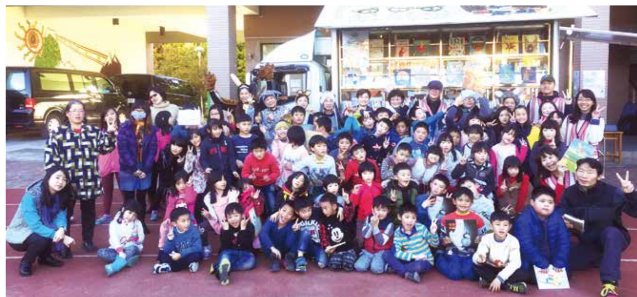
偏鄉學童在行動圖書車前，流露幸福滿足的神情。

另外圖書館也將主題書展佈置示範交流，帶上梨山規劃聖誕節氛圍主題展示，讓學童提前感受到節慶氣氛，平時連學校圖書室都很少進去的學生，也被這