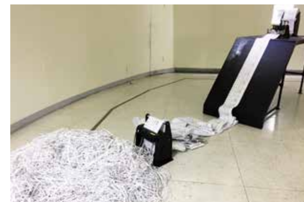
〈誓言的保固期〉以臺中結婚和離婚數據為基礎，讓觀眾思考婚姻的意義。

視覺化的影像，以探討人口老化議題。「時光@臺中」邀請劉克襄、莊靈等25位臺中居民敘述臺中生活經驗，期望喚起觀眾的情感及對臺中的感知能力。