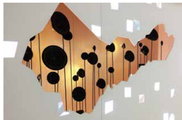
〈中聲鳴響〉以喇叭單體排成臺中地圖，佈局成專屬於臺中的時間音景篇章。

「玩·創客實作自造」辦理了「混搭未來工作坊」，由藝術家帶領60位來自不同領域的素人，運用開源工具及開放資料，以有趣且創新的文化集體創作形式，帶領素人藝術家們以跨領域角度創作，將資料視覺化、採集環境聲音再創造，更活用開放資料分享城市空間經驗，激盪出對於數位時代的城市發展想法。學員們表示，可將所學應用於建築設計、學校教材編輯等，很有幫助。