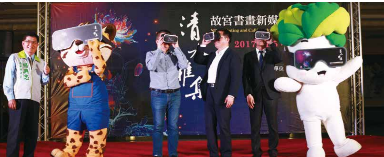
記者會與會嘉賓與花博吉祥物「來虎」及國寶吉祥物「小翠」一同戴上 VR 眼鏡，體驗古藝新境的魅力。