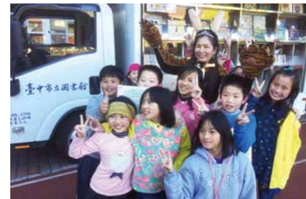
小朋友看見會長出翅膀的行動圖書車，均興奮不已。

行動圖書車最吸引小朋友的就是能張開兩側翅膀，像變形金剛一樣，當小朋友第一眼看到時往往會驚呼不已，形成誘因而願意親近書本，對於梨山的學童更是如此。梨山地區資源取得不易，距離學校最近的圖書館，路程也要一個半小時，行動圖書車之到來，增加了學童跟外界接觸的管道，也提供更多的可能性和學習機會。每每看見學童在校園裡