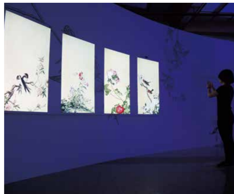
「春生」聲控互動裝置，觀眾以聲音觸動畫中看似靜止不動，實則隨風搖曳的鳥兒與花卉。