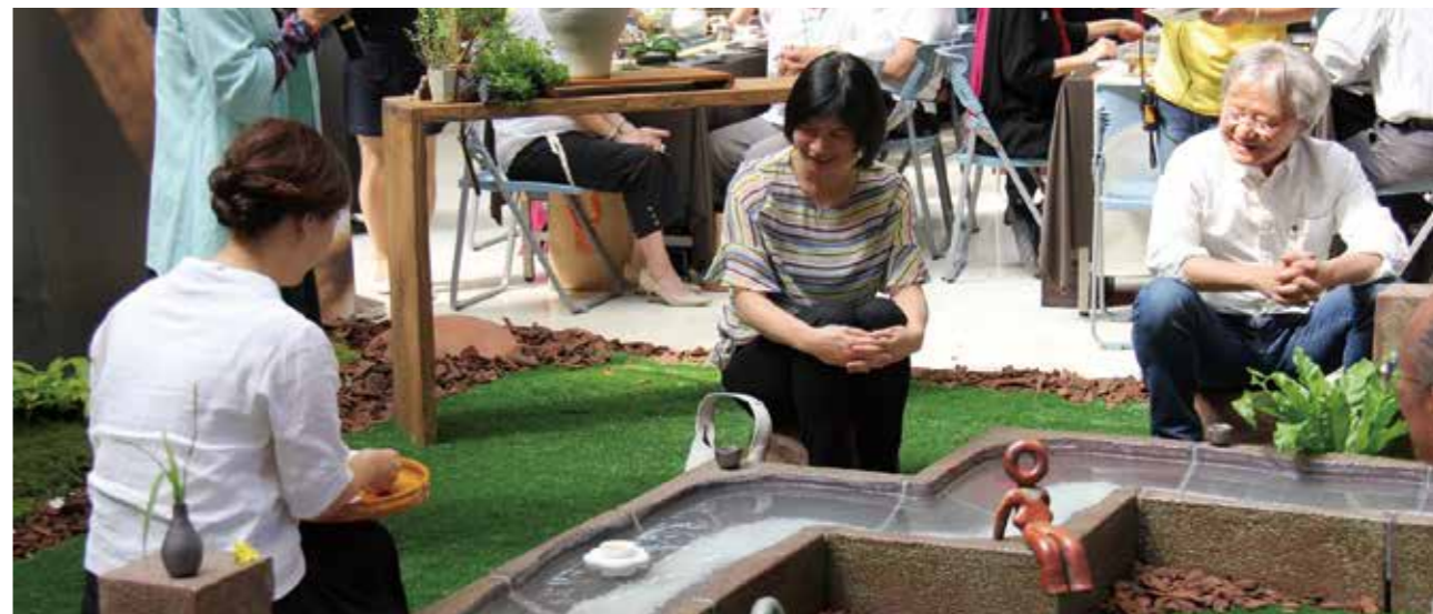
「詩情花藝曲水流觴」活動，林副市長以「花開如意」獻祝福。

這三間圖書館的重新啓用，象徵本市閱讀空間的大躍進，未來也會有更多優質的閱讀空間，讓臺中市民能徜徉其間，讓閱讀成為生活的一部份。