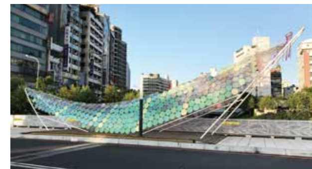
作品從遠處觀看像蝴蝶翅膀，也像葉脈紋路。

為迎接2018臺中世界花卉博覽會到來，本次展覽透過裝置藝術，呈現藝術、自然與人的互動，來呼應臺中花博「聆聽花開的聲音·花現GNP：GREEN、NATURE、PEOPLE」的精神，從綠色議題出發，不只是曇花一現的華麗展出，而是三者和諧發展的美好價值。