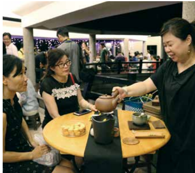
陶花曲戲茶，邀請民眾賞月、聽曲、品茗、享茶點。

港區藝術中心年度活動「清風茶宴」，2017年10月1日晚間迎來三部曲「陶·花·曲·戲·茶」，適逢中秋佳節前的週日夜晚，除了舉頭望明月、品上一壺專業司茶人精心泡製的好茶與佈置的花藝茶席之外，活動更規劃一場爵士女伶五重奏帶來的經典爵士與巴薩諾瓦（Bossa Nova）悠閒愜意音樂饗宴，令人留下深刻印象。