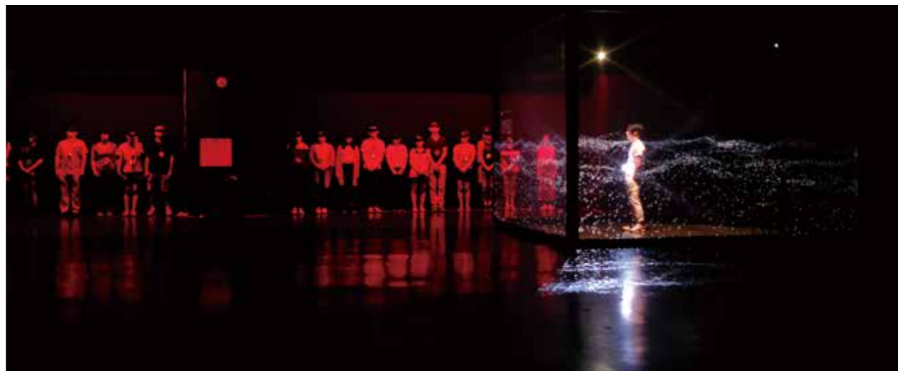
木天寮《薛丁格的黑盒子》，觀眾進入睡眠艙等待進入系統。

當科技遇上戲劇，會產生什麼驚奇？屯區藝文中心首度舉辦「戲遊文化城—屯區科技劇場藝術節」，活動自2017年9月16日至10月21日一連演出10場次科技戲劇，將密室脫逃、光影、動畫、數位科技與3C產品等融入，呈現表演藝術與科技跨界結合後激發的火花，引領觀眾馳騁在想像空間，讓戲劇不再是傳統實體的佈景與模式，而有更多表現方式。