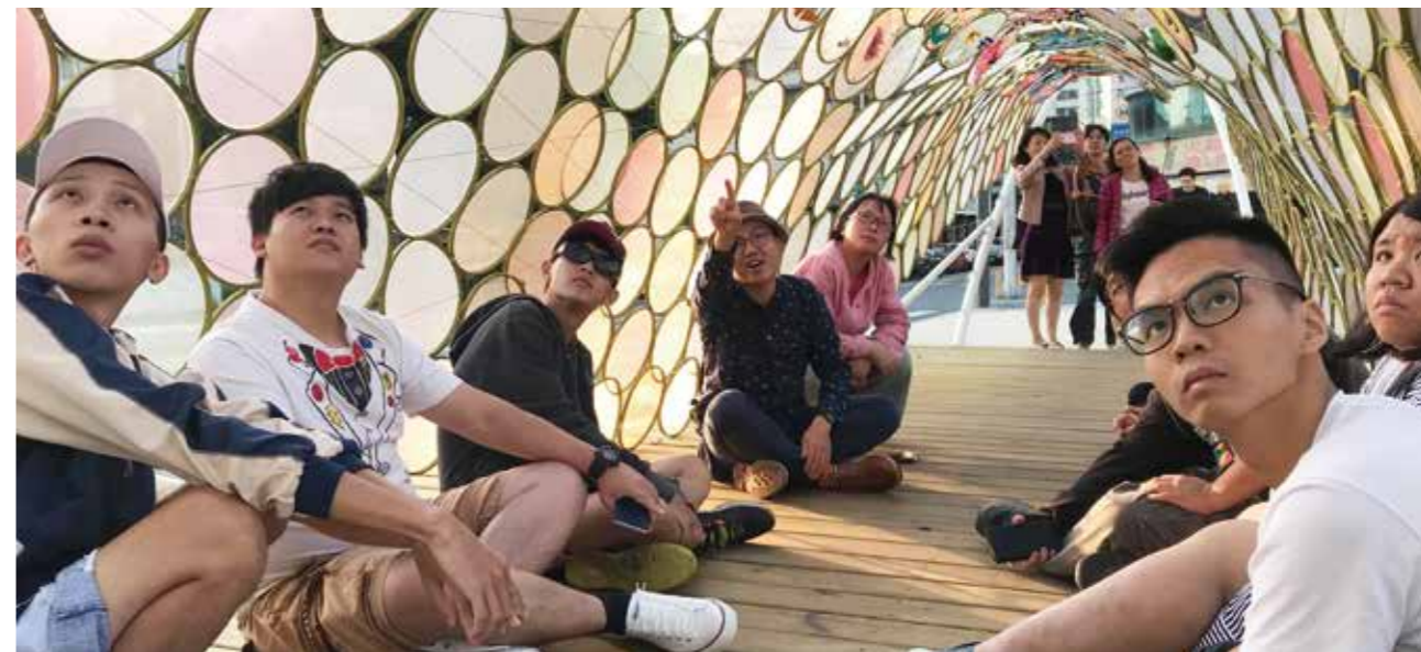
每個人都再尋找那片心中的夢田

臺中故事景點裝置展，自2017年10月9日至11月29日於柳川景觀水岸民族路橋上展出，開展期間吸引許多民眾注目，紛紛搶拍打卡！