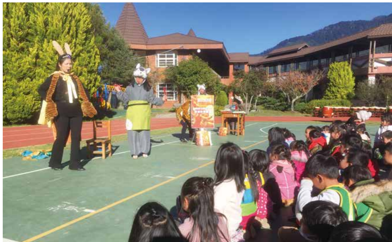
喵喵故事團演出《獅王的秘密》故事劇，與小朋友熱情互動。

什麼樣的堅持可以日行百里而不墜？臺中市立圖書館每月定期安排行動圖書車，行駛上百公里路程，將圖書資源帶入臺中市最偏遠的和平地區梨山學校，只希望為小朋友多開一扇認識世界的窗。