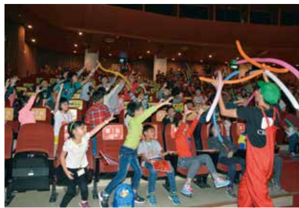
小丑於頒獎典禮上發放氣球，小朋友十分興奮。

2017 年 12 月 3 日上午，第 25 屆全國兒童聯想創作畫複賽在葫蘆墩文化中心展開，近 10 萬張畫作徵選出的 420 位優秀菁英認真應戰、揮灑創意。戶外廣場則特別安排銀河谷音劇團〈一休小和尚〉，透過人偶舞臺音樂劇精采緊湊的故事節奏與舞蹈，讓民眾及陪同比賽的家人開心欣賞，歡度快樂週末時光。