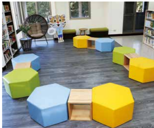
中市圖總館於二樓閱覽區設有「花博閱讀角」

重新啓用的中市圖總館，多了許多創新體驗及數位服務，例如一樓增設「智慧借還書機」，民眾可藉由簡便操作，大幅減少等候時間。另外也增設「閱讀e點靈」數位服務平臺，提供最新電子書與電子期刊閱讀，可透過數位載具進行數位資源借閱。另外一樓兒童區跟樂齡區採分齡分眾概念設計，兒童區以木質地板打造，透過溫暖色系家具調和出兒童喜愛的氛圍；樂齡區則增設舒適的閱讀沙發，讓樂齡族能自在閱覽報紙期刊。