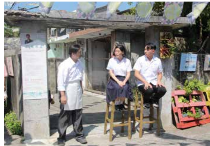
大開劇團環境劇場利用園區戶外空間演出《小城故事》

地方社團更精心推出各類精采有趣的主题活動，包括臺中市清水生活美學協會的「懷舊老磁磚紋樣藍染體驗活動」、臺中市海線社區大學的「懷舊音樂會」、社團法人臺中市海灣故事文化創意協會的「眷村繪本 / 影像分享 & 眷村美食親子體驗」、弦外織音藝術工作室的「走讀眷村的巷弄拾趣」、臺中市清水區博愛關懷協會的「傘兵飄飄一童玩 DIY」、臺中市眷村文化發展協會的「空軍建軍及八一四空戰勝利 80 周年圖片展」、以及臺中市清水小願文化創