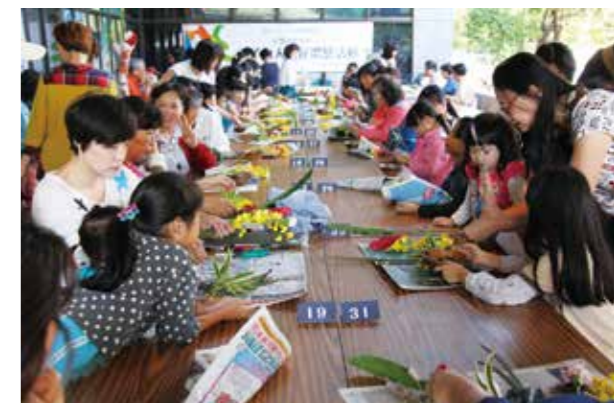
親子百人插花體驗活動熱鬧展開

除了靜態展示外，還有即興插花創作表演、親子百人插花實作體驗以及花香茶香滿溢的空間質感營造等，一次滿足民眾五感美學體驗，共迎2018臺中世界花博盛會。