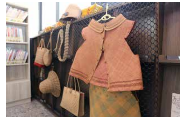
大甲的傳統工藝以蘭草編織聞名，大甲圖書館即以「編織」為特色館藏。

2017 年 11 月大甲圖書館重新啓用，開放式的空間規劃帶給民眾全新閱讀體驗。尤其改造後的圖書館，考量使用者多樣性進行不同空間調配，如一樓以嬰幼兒、兒童閱讀區為主，空間明亮開闊，搭配大面落地窗與戶外景色連為一體，具有通透感，提供超過 2 萬冊的童書供孩子自在閱讀；二樓樂齡區則搭配新建電梯，讓長者使用無負擔，而舒適與寬敞的閱讀空間，提供近 70 種期刊與 20 份報紙，讓樂齡區成為長輩的新樂園。