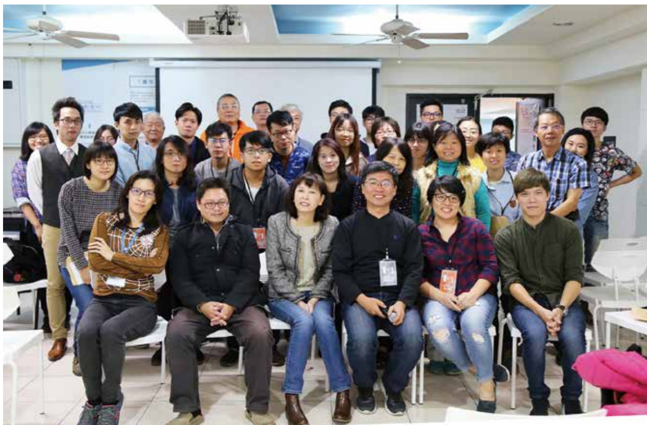
「混搭未來工作坊」帶領學員以實作方式，進行一場新型態的文化集體創作。