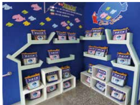
大安圖書館以「悠遊在書海的鯨魚」作為識別標誌

為全國第一個以「自然生態」為特色的典範館。過程花了很多努力爭取，尤其在 2015 年獲選為典範館時，大安圖書館是當年度全國獲選的 5 座典範館中館舍最小的一座，也曾遭質疑：「這麼小的圖書館，如何執行卓越典範計畫？」，但獨特的地方海洋自然生態與人文特色，完善且多層面地執行計畫及企圖心，終讓大安圖書館脫穎而出，以當年度最高票獲選典範館。