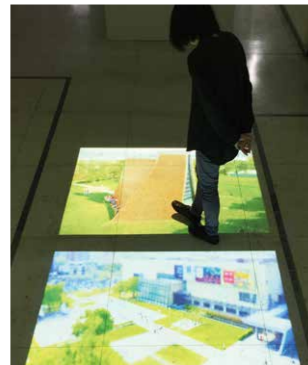
〈時光顯微鏡〉將熟悉的臺中街景微縮攝影，表現空間行旅之感，觀看者就像在世界之外，仔細又模糊地觀看一幕幕人生百態。

〈中聲鳴響〉使用29個喇叭單體排列成臺中地圖，以音景記錄時間，佈局成一首專屬於臺中地區的篇章；〈臺灣聲音地圖計畫〉利用Google Map定位分析，逐步錄製臺中各地的常民聲音；〈在看得見的臺中，看見城市高齡化〉將高齡化人口分佈數據轉為