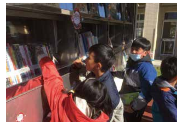
許多小朋友對書本充滿興趣，一頭栽進閱讀世界。

聚在一起看書、分享討論和把書帶回家中與家人分享，臺中市立圖書館行動圖書車就更能堅持行百里，為偏鄉孩子傳遞閱讀幸福的希望，正無限蔓延。