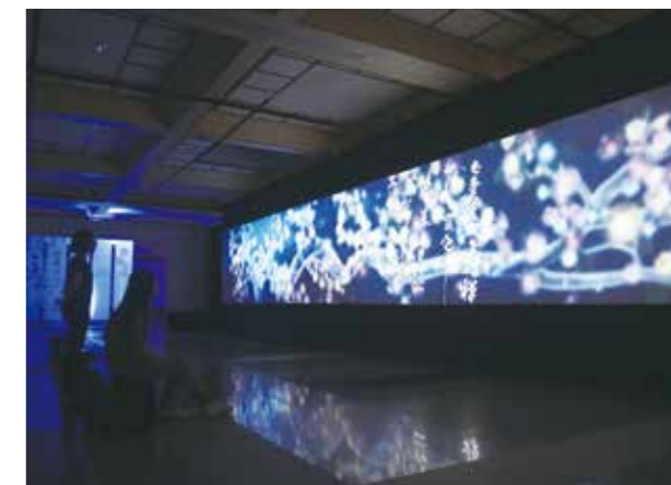
21 公尺長的古畫動畫，娓娓道來黃庭堅創作「花氣薰人帖」的心境。