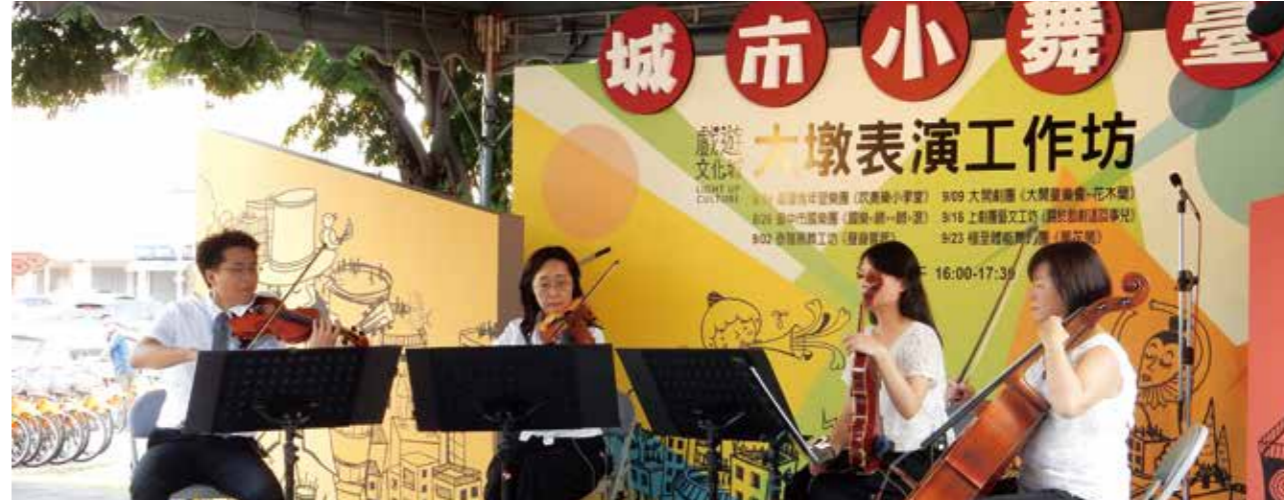
「就是四重奏」以悠揚的小提琴樂聲洗滌民眾心靈

大墩文化中心城市小舞臺自2017年4月啓用，第一季熱情的肚皮舞、烏克蘭麗麗、非洲鼓舞及七夕的無雙樂團等演出，點燃了屬於夏日的激情奔放。小舞臺下觀眾忘情跟著演出團隊搖擺吶喊，我們看到表演藝術所迸發的火花，在演出團隊與觀眾間閃耀映照。