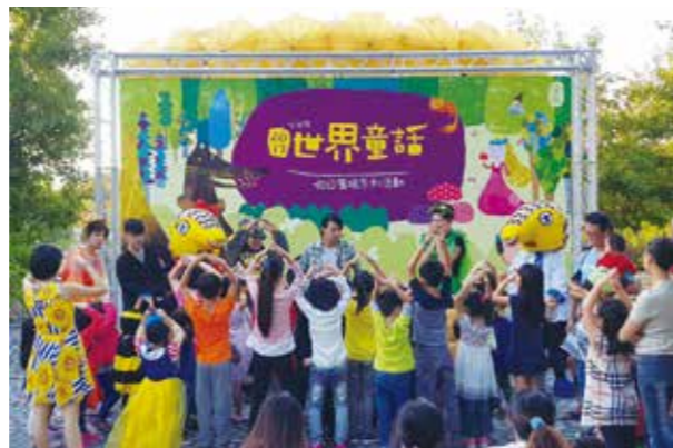
頑石劇團與觀眾互動，笑聲不斷。

在小朋友歡笑聲中，2017年的假日廣場系列活動已圓滿落幕，敬請期待2018年更精采的假日廣場活動。