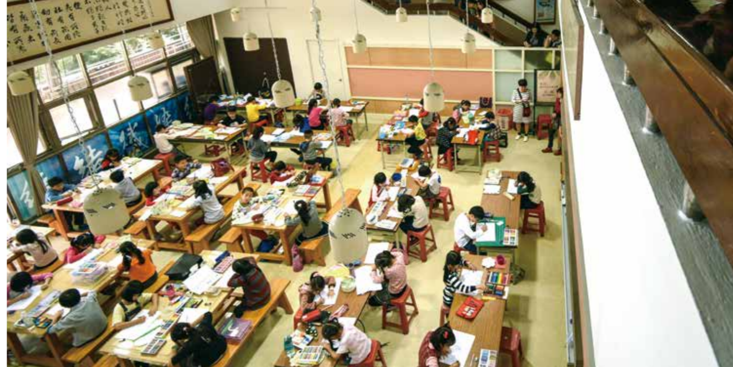
靜謐的空間裡，參賽學童專心作畫。