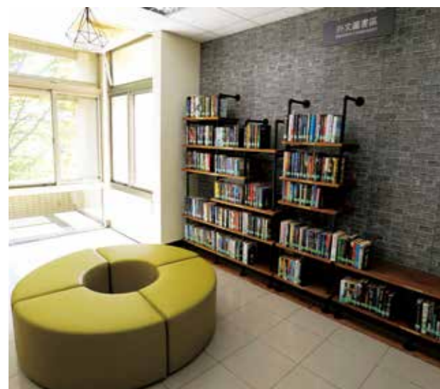
位於總館的青少年閱讀專區，窗明几淨。

為了提供各年齡層讀者更優質服務及豐富資源，建築師將原有樓梯牆面設置為智慧樹高書牆，以書牆向上延伸，做為圖書館入口意象亮點，打造符合現代化圖書館空間，頗受民眾好評。高書牆分成上下兩區，下方為新書展示區，讓民眾自由借閱；上方佈展圖書選擇出版年代超過10年以上之複本圖書，或民眾捐贈不適宜上架之圖書。