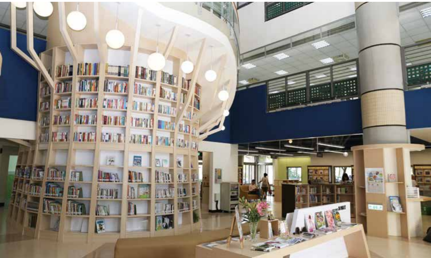
臺中市圖總館的入口意象為知識樹高書牆，相當壯觀。