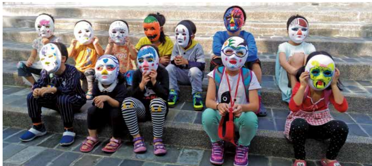
小朋友戴上自己DIY彩繪的面具

屯區藝文中心舉辦假日廣場系列活動已行之有年，每次皆求新求變，期盼帶給市民難忘的假日午後時光。2017下半年以「世界童話」為主題的兒童戲劇演出搭配「小老闆跳蚤市集」，演出團隊邀請北中南知名兒童劇團，而小老闆跳蚤市集則是屯區藝文中心首度向民眾招募攤位，每位家長提出各種有趣的攤位規劃，有自製扭蛋機及彈珠臺等攤位，從中看見民眾的無限創意。除了家長使出渾身解數來設計攤位外，小老闆們也賣力招客，讓現場逛攤位的民眾皆忍不住會心一笑。