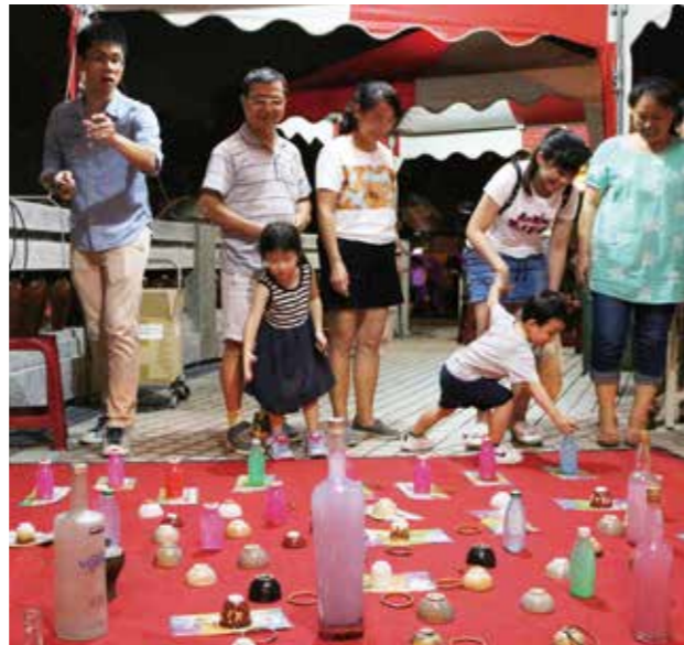
親子套陶體驗活動，訓練小朋友手眼協調。

藝術廣場規劃親子套陶樂活動，報名品茗者可憑茶券換得套圈來進行體驗，除了訓練小朋友的手眼協調，還可以把精美文創品帶回家。同時邀請 Raenina 蕾妮娜手作藝、小巷莫兒、陶器 TaoChin、紫雲陶