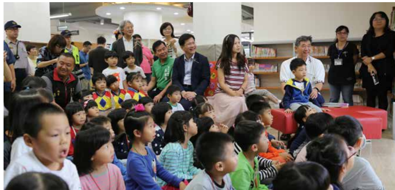
大甲圖書館全新舒適的空間，讓大人、小朋友享受閱讀樂趣。

為了讓民眾認識大安的自然生態與海洋文化。大安圖書館以「悠遊在書海的鯨魚」作為識別標誌，空