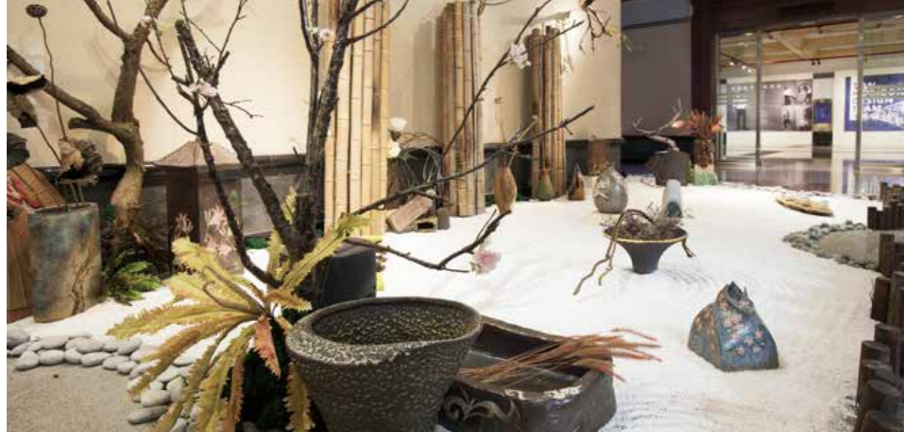
7組美學情境之一《枯山水意境》