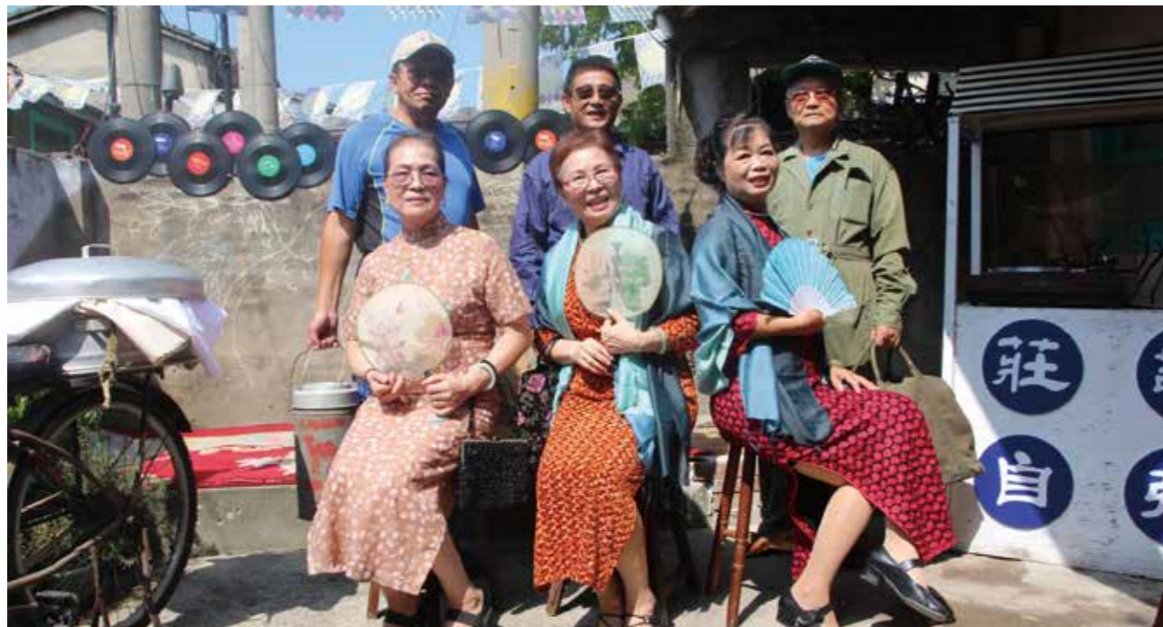
2017 臺中眷村文化節開幕記者會上，原眷戶精心打扮走秀。