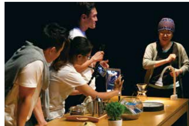
我和我的午茶時光工作坊邀請觀眾上臺體驗即時投影技術