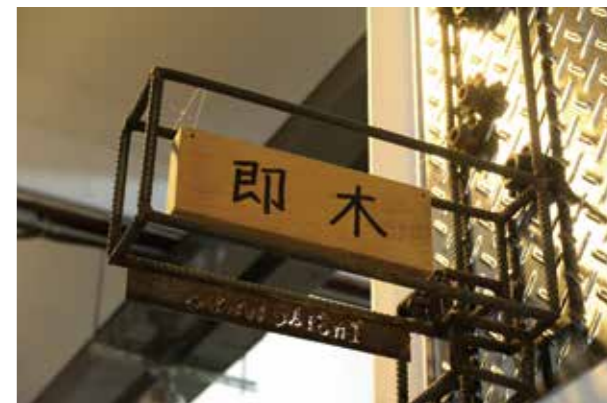
即木招牌結合兩大技藝—木工及焊鐵，呈現特色。

2016 年，即木的「山櫻精神—花木手工筆禮盒」榮獲臺中市十大伴手禮精品類首獎，原本損壞要回收的校園課桌椅，經即木巧手再製，擁有了嶄新生命，並且結合 2018 年花博的意象，讓手工筆禮盒從在地出發，將臺中的價值傳播到各地。