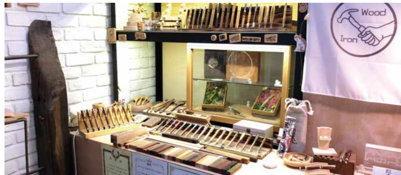
即木陳列許多精緻木製品，傳統工藝之美一覽無遺。