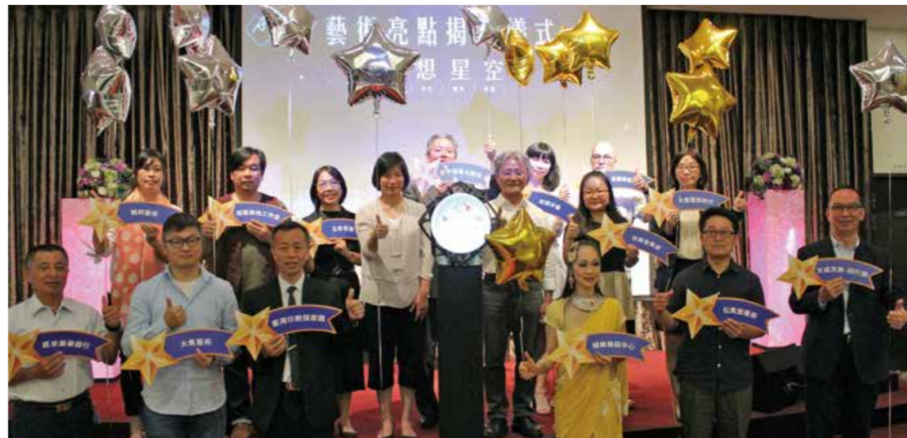
林依瑩副市長與文化局王志誠局長，熱情歡迎新增亮點。

醫創立了和顏藝廊，定期展示攝影、油畫、水彩畫，建築設計中也包含各種當代藝術元素，將藝術帶入生活，是藝術亮點中唯一一家社區型診所。