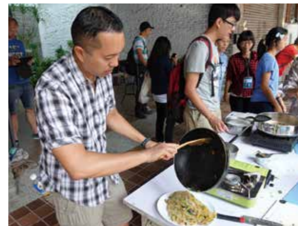
民眾參加「臺中百味·旅人餐桌計畫」，大展廚藝。

著 i-bike 逛市場採買新鮮食材，沿路導覽城中城重要的文化景點，再回到旅館一展廚藝，大飽眼福與口福。