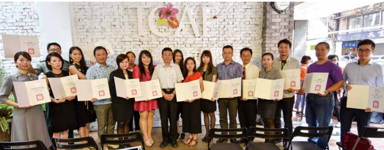
文化局頒發感謝狀給參與 2017 花都藝術季藝術亮點代表