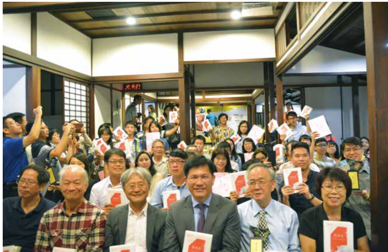
第6屆臺中文學獎頒獎典禮於2017年10月15日舉行，各文類得主聚齊一堂。

第6屆臺中文學獎結果出爐，共計69人獲獎，2017年10月15日於臺中文學館頒獎。主辦單位臺中市政府文化局表示，本屆來稿數創新高，共收到來自國內外1,225件作品，其中6成參賽者為40歲以下，足見歷經6年耕耘，臺中文學獎從地區性文學獎逐漸轉為舉足輕重的全國性文學獎，另一方面也突顯文學創作向下扎根，新秀輩出。