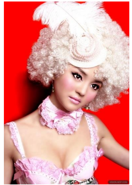
纯爱性感真人木偶