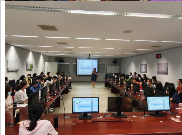
圖二:講師與同仁分享社會上性別平等的實踐過程