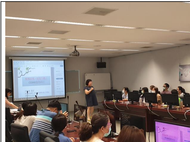
圖一:講師正與同仁講述 CEDAW 相關案例。