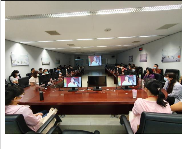
圖三:講師透過影片讓同仁更了解 CEDAW 條文及暫行特別措施內容